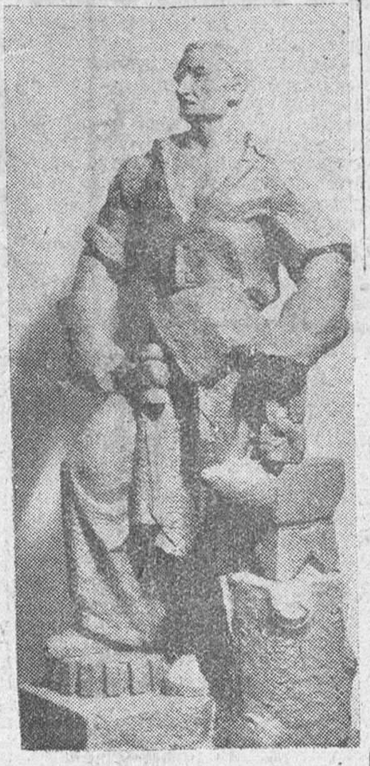
He aquí una reciente obra del notable escultor Lucarini, para la Excm. Diputación de Bilbao

Todas las existencias a menos de la mitad de su precio TEJIDOS - PAÑERÍA - SEDAS GENEROS DE PUNTO