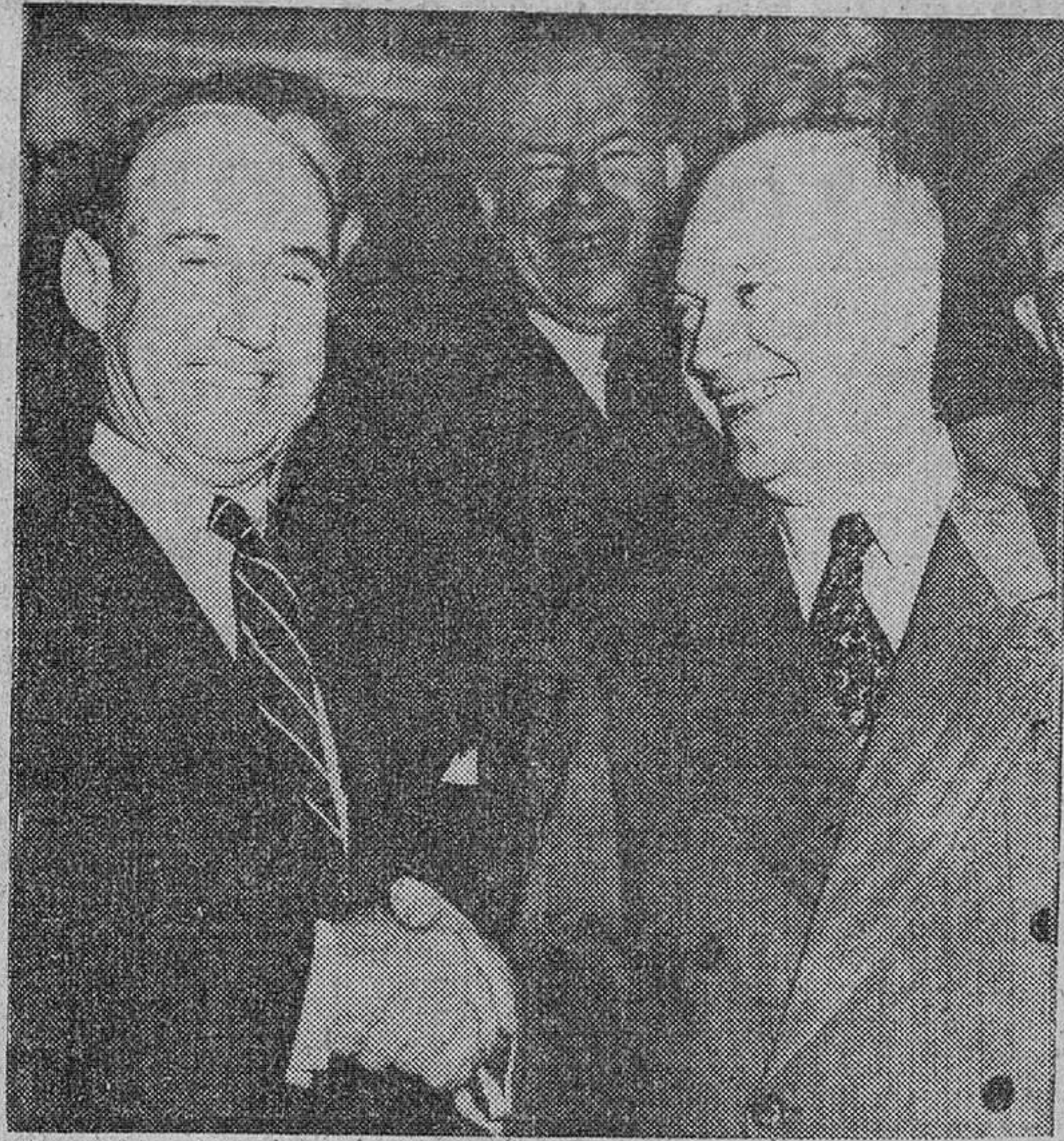
Concluidas las elecciones presidenciales de 1952, los dos rivales políticos, Stevenson y Eisenhower, se estrecharon amigablemente las manos, después del triunfo republicano. ¿Volverá a repetirse ahora la escena?

DWIGHT D. Eisenhower dedicó casi cuarenta años de su vida a la compleja ciencia de la destrucción. En el West Point estudió a Scott, a Washington, a Grant, a Napoleón. Durante la segunda guerra mundial dirigió las fuerzas armadas que arrasaron ciudades enteras, desde el Báltico al Norte de África. Luego, como Saul en su visión en el camino de Damasco, Ike se ha convertido en el hombre de paz. Eisenhower es hoy a la Paz, lo que Churchill fue una vez a la guerra. El viejo soldado, harto de ver correr la sangre y asustado ante la amenaza de una guerra atómica, se ha convertido en el "fídic" de esa búsqueda hacia la paz mundial. En la Nato, en los helados frentes de Corea luego, en las Naciones Unidas, este hombre ha traído algo nue-