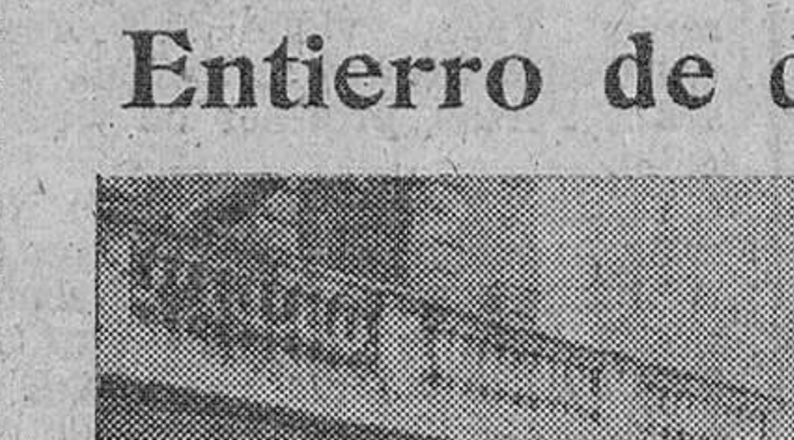
Madrid. — El ministro de Educación Nacional y los parientes del finado en la presidencia del duelo, con motivo del entierro del ilustre escritor don Pío Baroja.