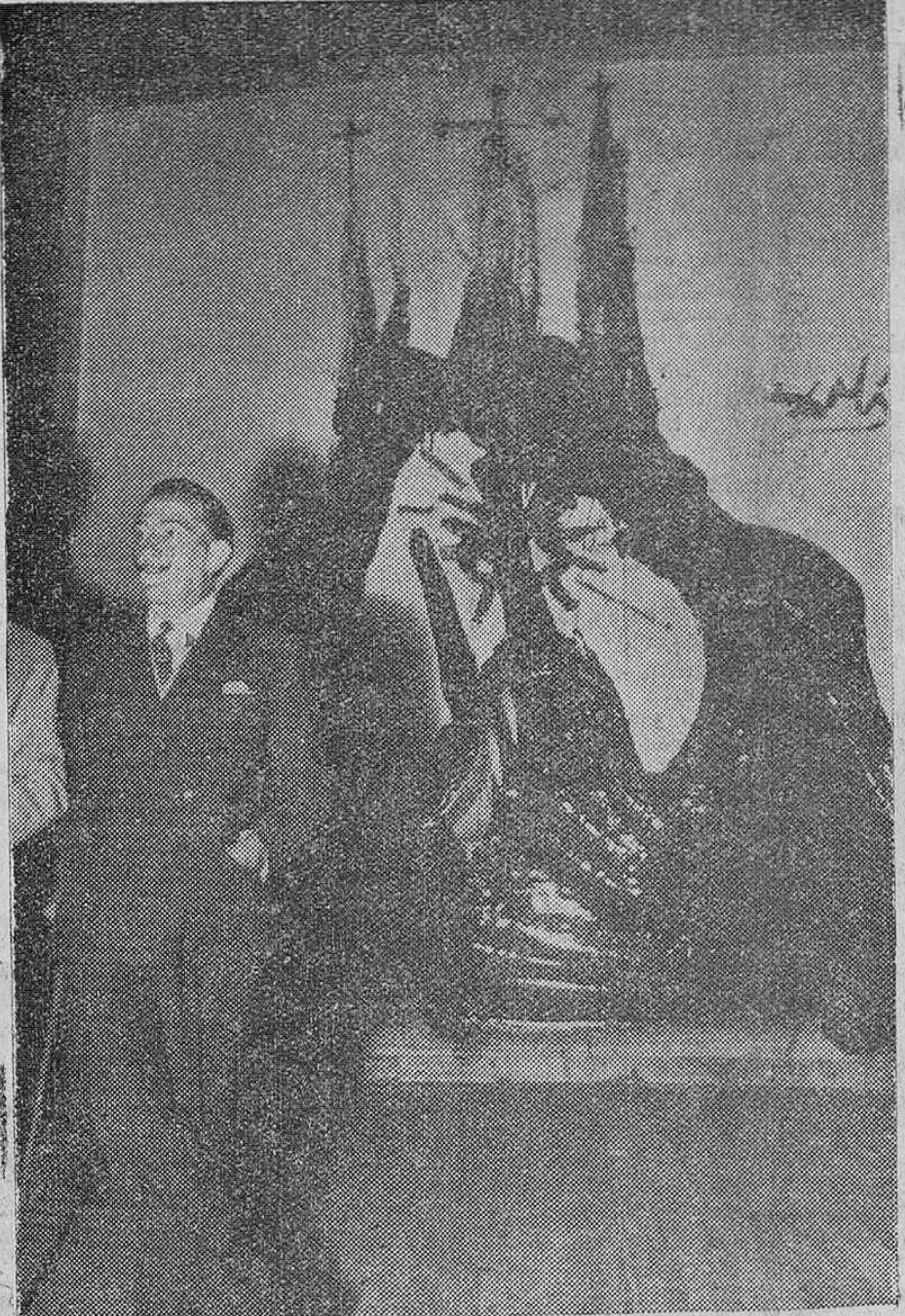
Barcelona. — Salvador Dalí después de terminar el cuadro que aparece al fondo y que realizó ante los tres mil oyentes de su conferencia sobre "el alquitrán y su influencia en la pintura del porvenir". El cuadro lo pintó con alquitrán y quiere representar la obra del arquitecte Gaudí, la iglesia de la Sagrada Familia de Barcelona.