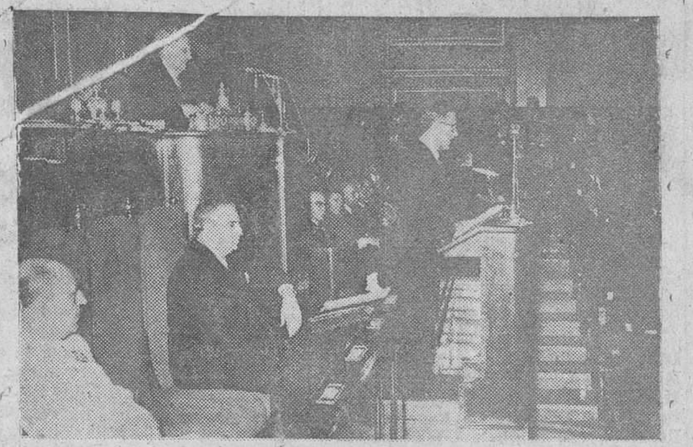
Madrid.—Un momento del pleno de las Cortes Españolas, celebrado en la mañana del sábado.