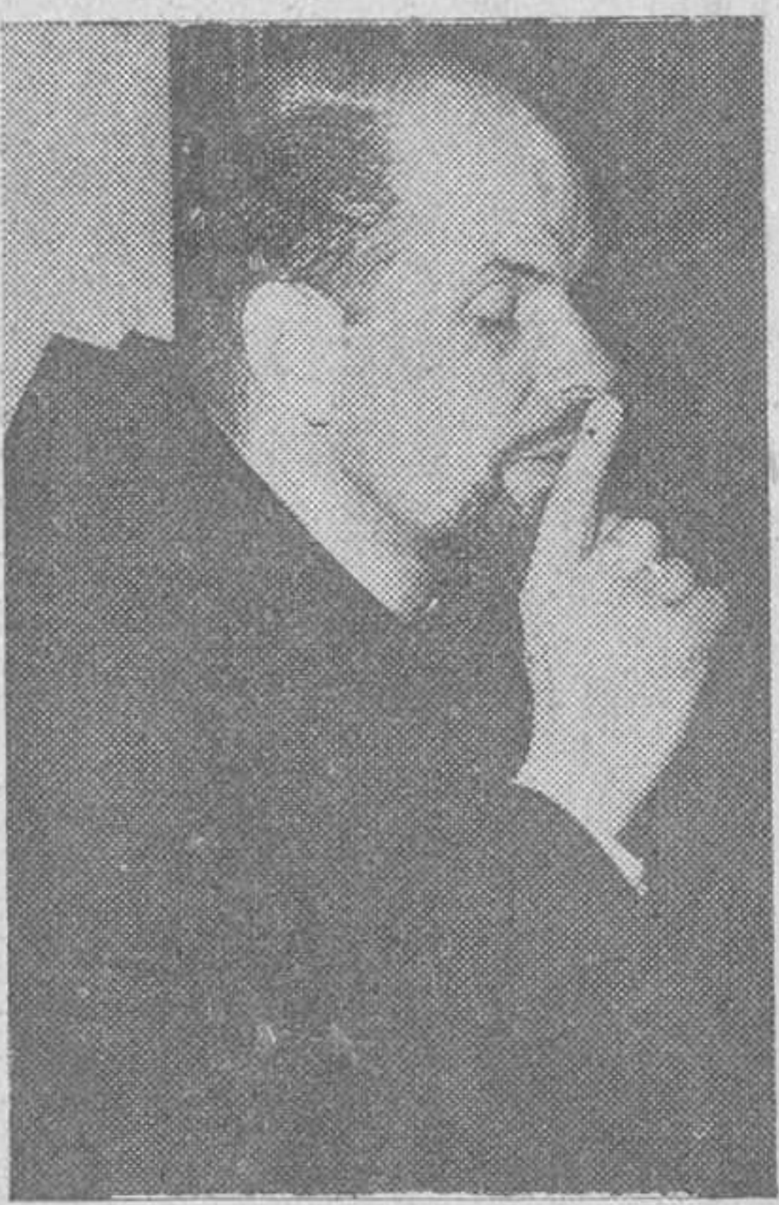
Padre Eugenio Stasse, misionero benedictino belga, en un momento de su estancia en España.

Le ha admirado, especialmente, en España, la intensidad con que se valora la institución familiar, como quizá en ningún otro país del Mundo y el temple y espíritu de las muchachas y las mujeres españolas, de acendrados sentimientos religiosos. Es decir, que en nuestra Patria encuentra una juventud ideal para la realización de esa labor misionera seglar, que él aspira a intensificar en el Congo Belga. Afirma que el espíritu que ha observado en el campamento de Rande, por ejemplo, demuestra lo lejos que puede llegar nues-