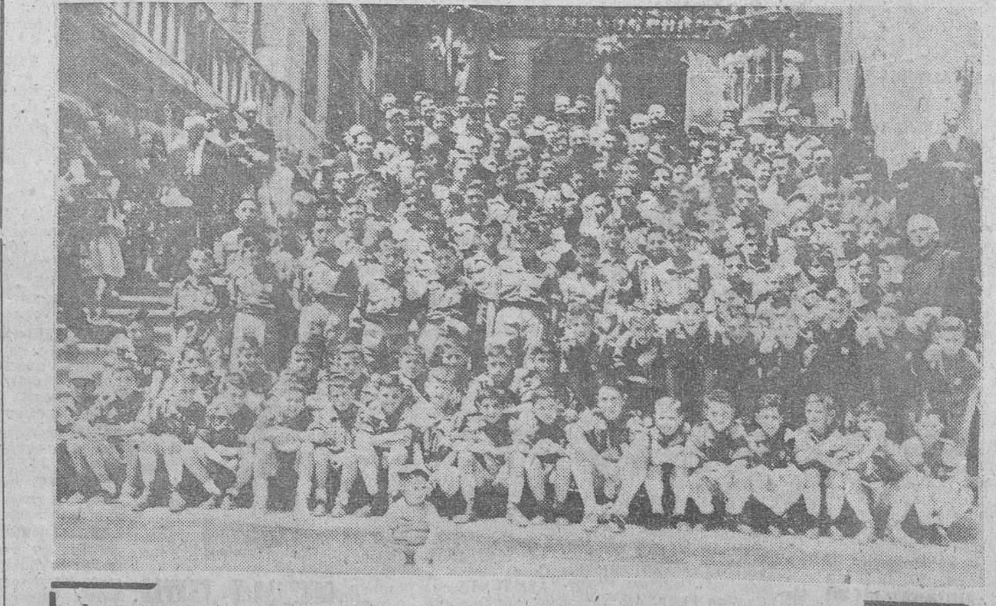
Los componentes del IV Campamento "Santa María la Mayor" momentos antes de su partida para Regumiel, con el Obispo de Orense y el Vicario general del Arzobispado.