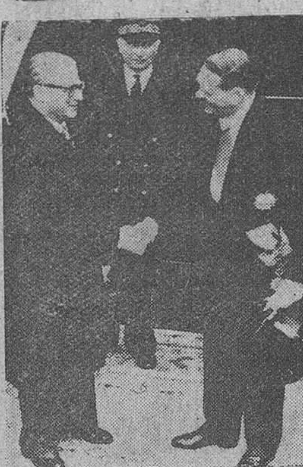
El señor Giovanni Gronchi, presidente de la República italiana, ha llegado a París por la estación del Bosque de Bolonia. Acudieron a recibirle el presidente Mr. Coty y miembros del Gobierno. Los dos presidentes se estrechan la mano.