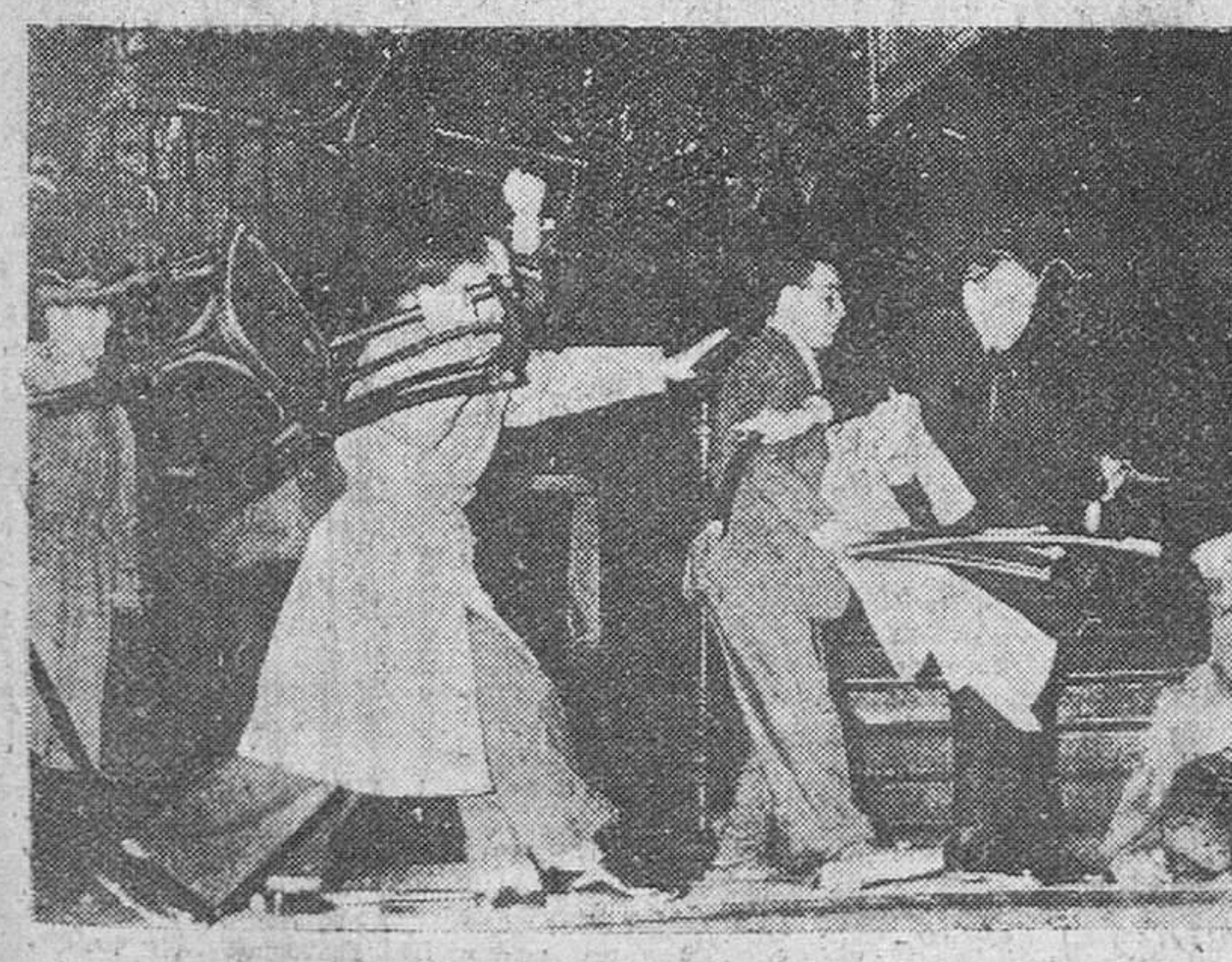
París. — «El comité de lucha contra la represión en África del Norte», ha celebrado un mitin en la Sala Wagram, durante el cual, partidarios y adversarios del citado Comité, se fueron a las manos, utilizando como armas ofensivas las sillas. Los dos que han tumbado a un adversario a silletazos, también van a recibir lo suyo. «Con la medida que midieres te medirán.»