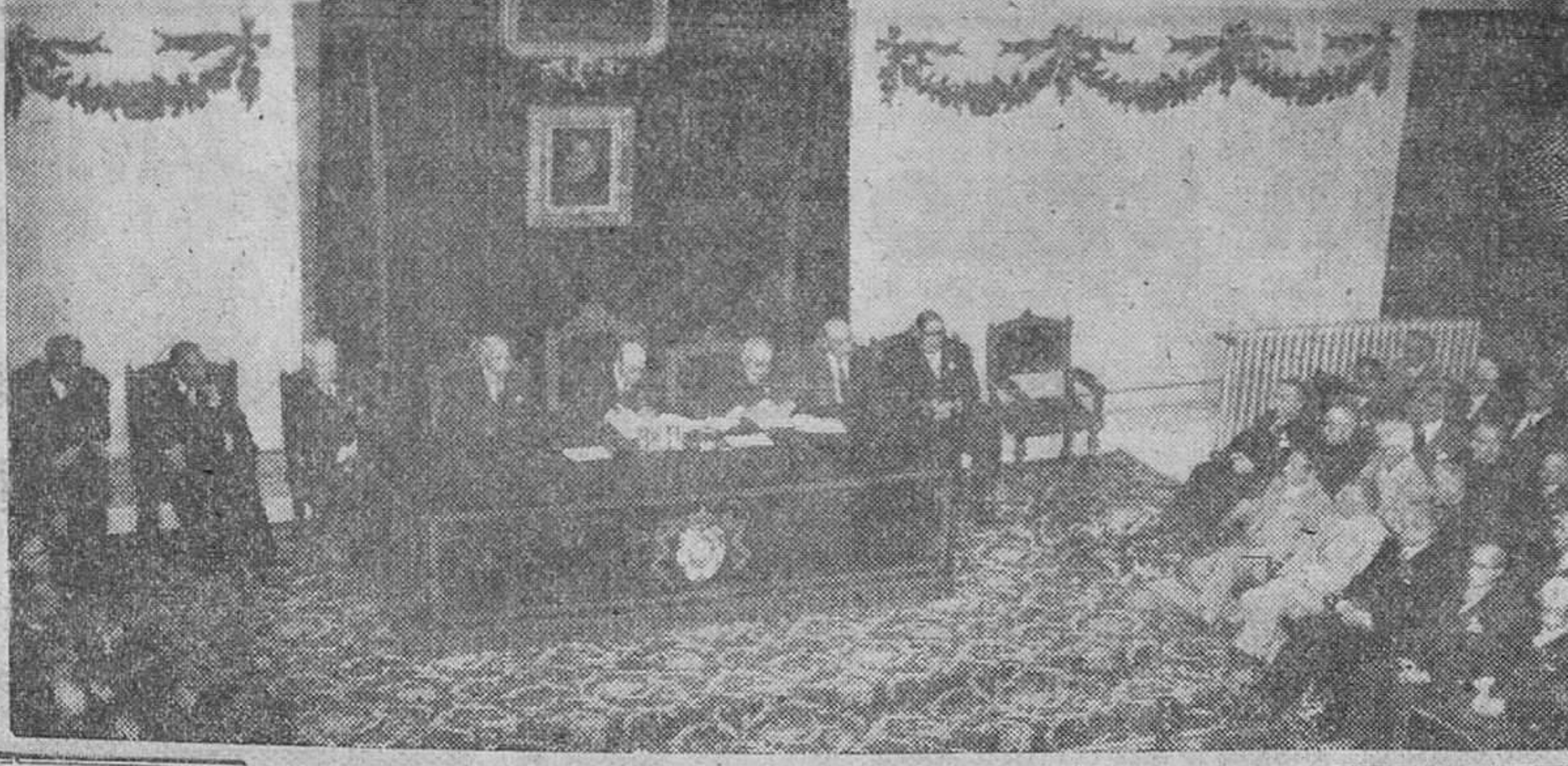
Madrid. — Un momento de la presentación de delegados y lectura del reglamento del Congreso, en la sesión preparatoria del Congreso de Academias de la Lengua celebrada en la mañana del domingo en la Real Academia Española.