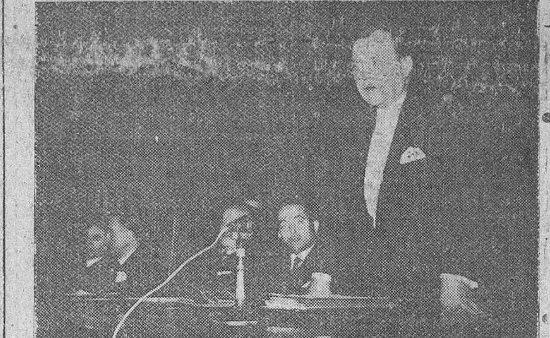
Madrid.— Bajo la presidencia del ministro de Educación Nacional, don Jesús Rubio, se ha celebrado en el aula magna del Consejo Superior de Investigaciones Científicas, la sesión de apertura de la XLIII reunión del Consejo Ejecutivo de la Unesco.—(Foto Cifra)