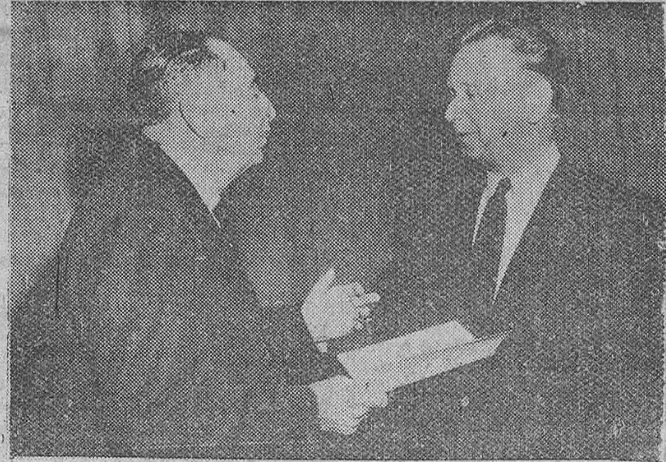
Nueva York.— Don José Félix de Lequerica, delegado permanente de España en la ONU, durante el acto de la presentación de sus credenciales al secretario general de dicho Organismo, señor Hammaskjöld.