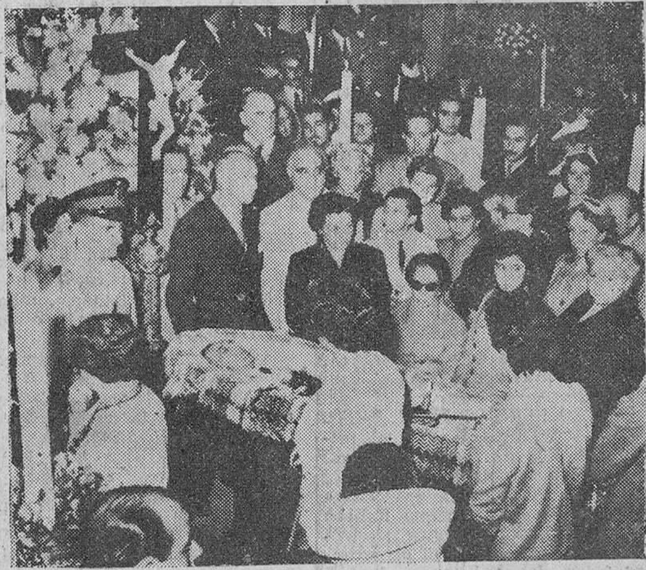
Buenos Aires. — Numerosísimas personas desfilan por la capilla ardiente donde se halla instalado el cadáver del general Lonardi.