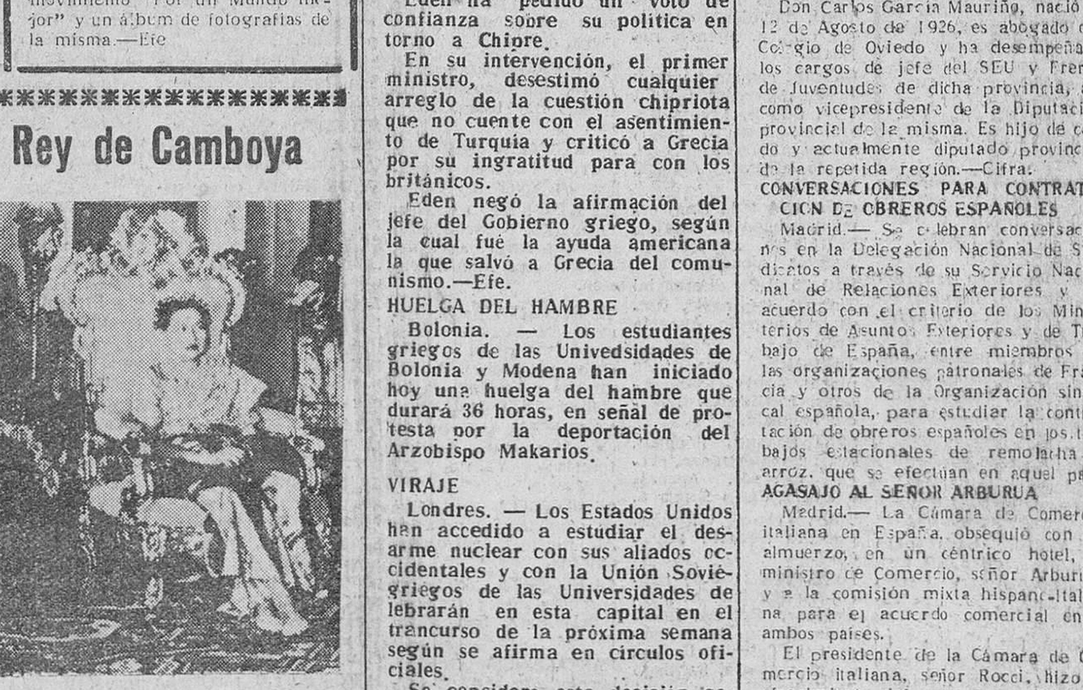
Las fiestas de la coronación del Rey y de la Reina de Camboya, que comenzaron el 2 de Marzo, continúan con gran esplendor. Numerosas ceremonias y recepciones se celebran en honor de los soberanos Kmers. En la fotografía, el Rey y la Reina, en la Sala del Trono.

Eden negó la afirmación del jefe del Gobierno griego, según la cual fue la ayuda americana la que salvó a Grecia del comunismo.—Efe. HUELGA DEL HAMBRE Bolonia. — Los estudiantes griegos de las Universidades de Bolonia y Modena han iniciado hoy una huelga del hambre que durará 36 horas, en señal de protesta por la deportación del Arzobispo Makarios. VIRAJE Londres. — Los Estados Unidos han accedido a estudiar el desarme nuclear con sus aliados occidentales y con la Unión Soviética, según se ha anunciado por el secretario de las Universidades de América en esta capital en el transcurso de la próxima semana según se afirma en círculos oficiales. Se considera esta decisión como un importante cambio de política por parte del Gobierno norteamericano, que hasta ahora se había negado a discutir la cuestión con los rusos mientras no se hubiera resuelto el problema de la inspección y el control.—Efe.