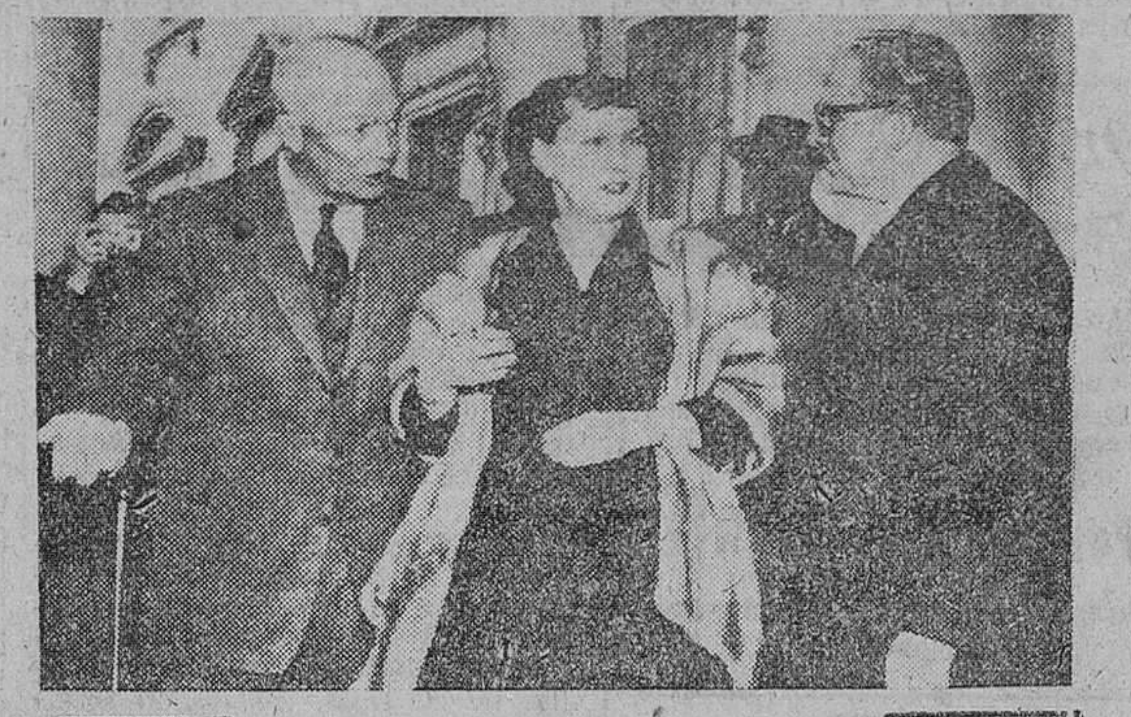
Washington. — El Presidente Eisenhower y su esposa, dan la bienvenida al Presidente italiano Giovanni Gronchi, a su llegada a la Casa Blanca. Es la primera vez en la Historia que un Presidente o jefe de Estado italiano visita los Estados Unidos.—(Foto Cifra).