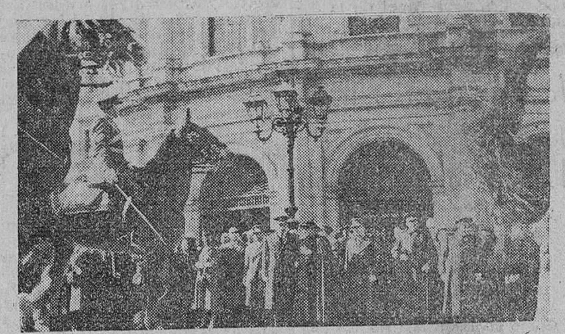
Madrid.—El ministro de la Gobernación con el director general de Seguridad y otras personalidades, presidió la solemne función religiosa celebrada con motivo de la festividad del Santo Ángel de la Guardia, en el Templo de San Francisco el Grande.