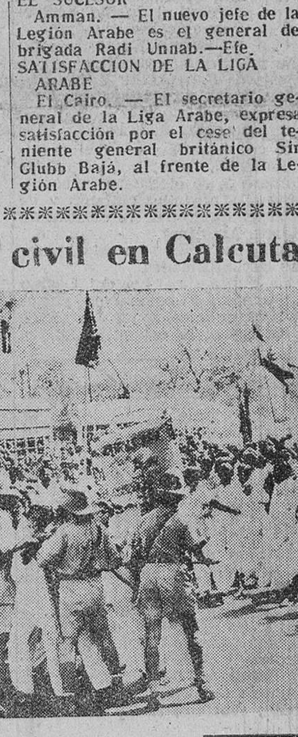
La decisión del Gobierno indio de unir Bengala del Oeste y el Estado de Bihar en una sola unidad administrativa, ha sido mal acogida en Calcuta, donde numerosos manifestantes chocaron con la Policía que les impidió penetrar en el inmueble del Gobierno. Los bengaleses estiman que tal unión significaría la dominación política, económica y cultural por parte de la población de Bihar, que dobla en número a la de Bengala.