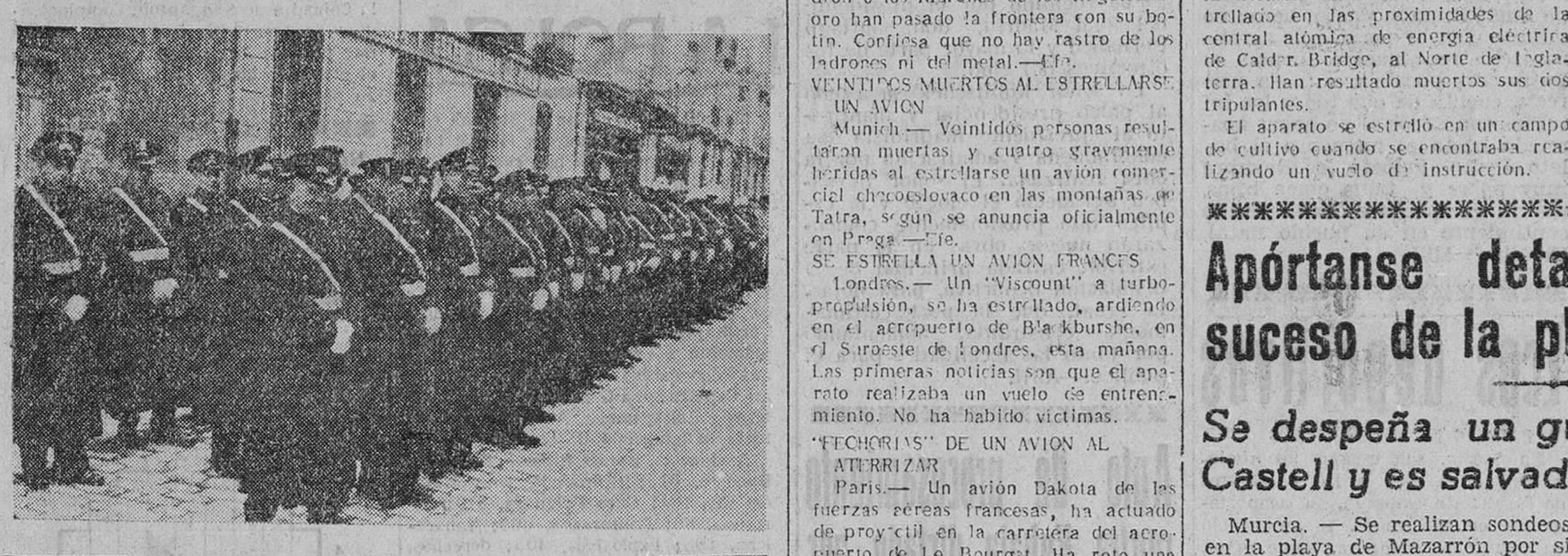
Los agentes de la Policía Municipal, forman ante la iglesia de San Lorenzo el Real, momentos antes de empezar la solemnidad religiosa en dicho templo.