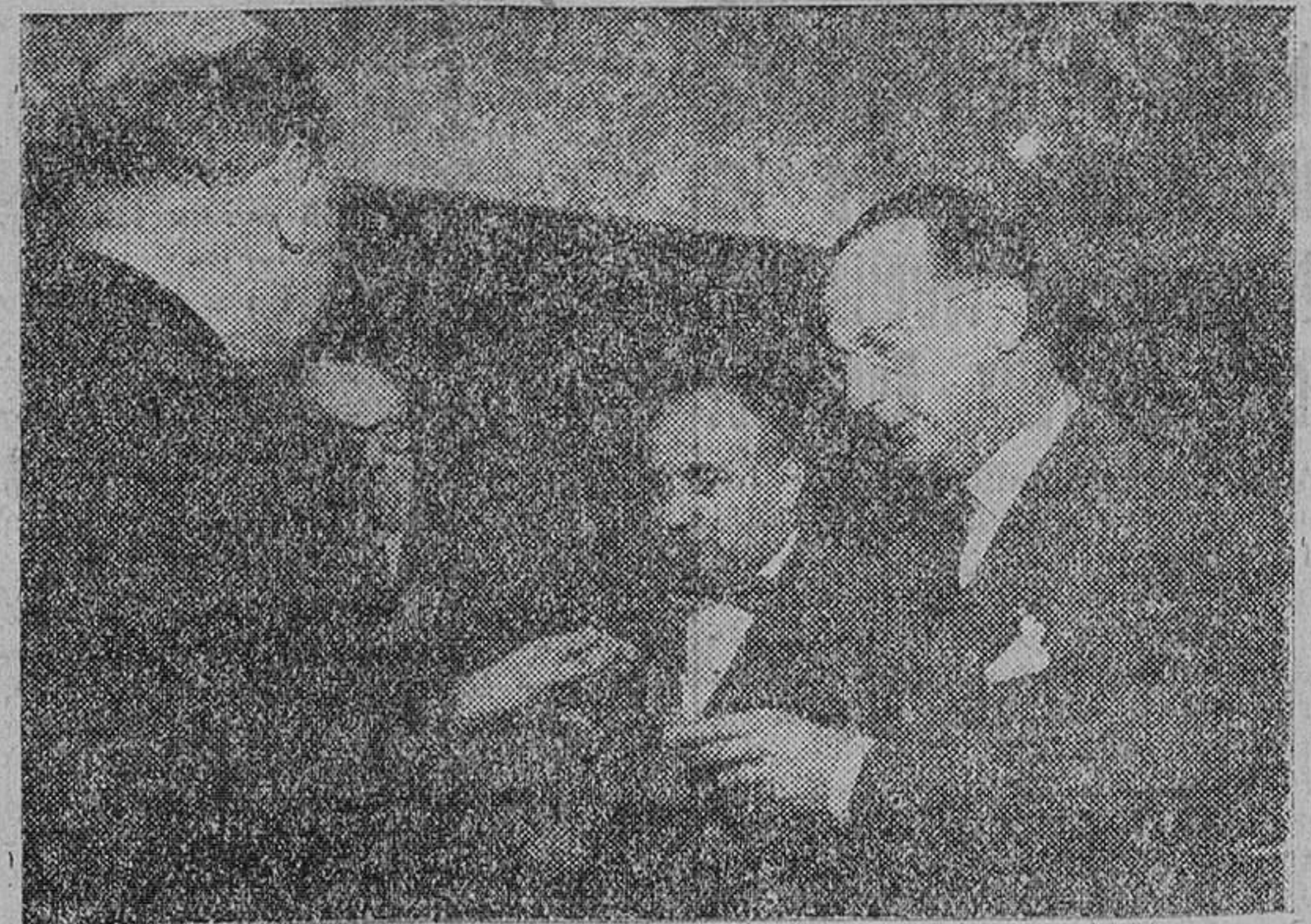
Madrid. — Los señores Arias Salgado y Aparicio reciben las insignias y los títulos de honor de la Asociación de la Prensa de Barcelona, que les fueron entregados por una comisión de la Junta Directiva de la citada entidad.

Homenaje al ministro de Información y Turismo y al director general de Prensa