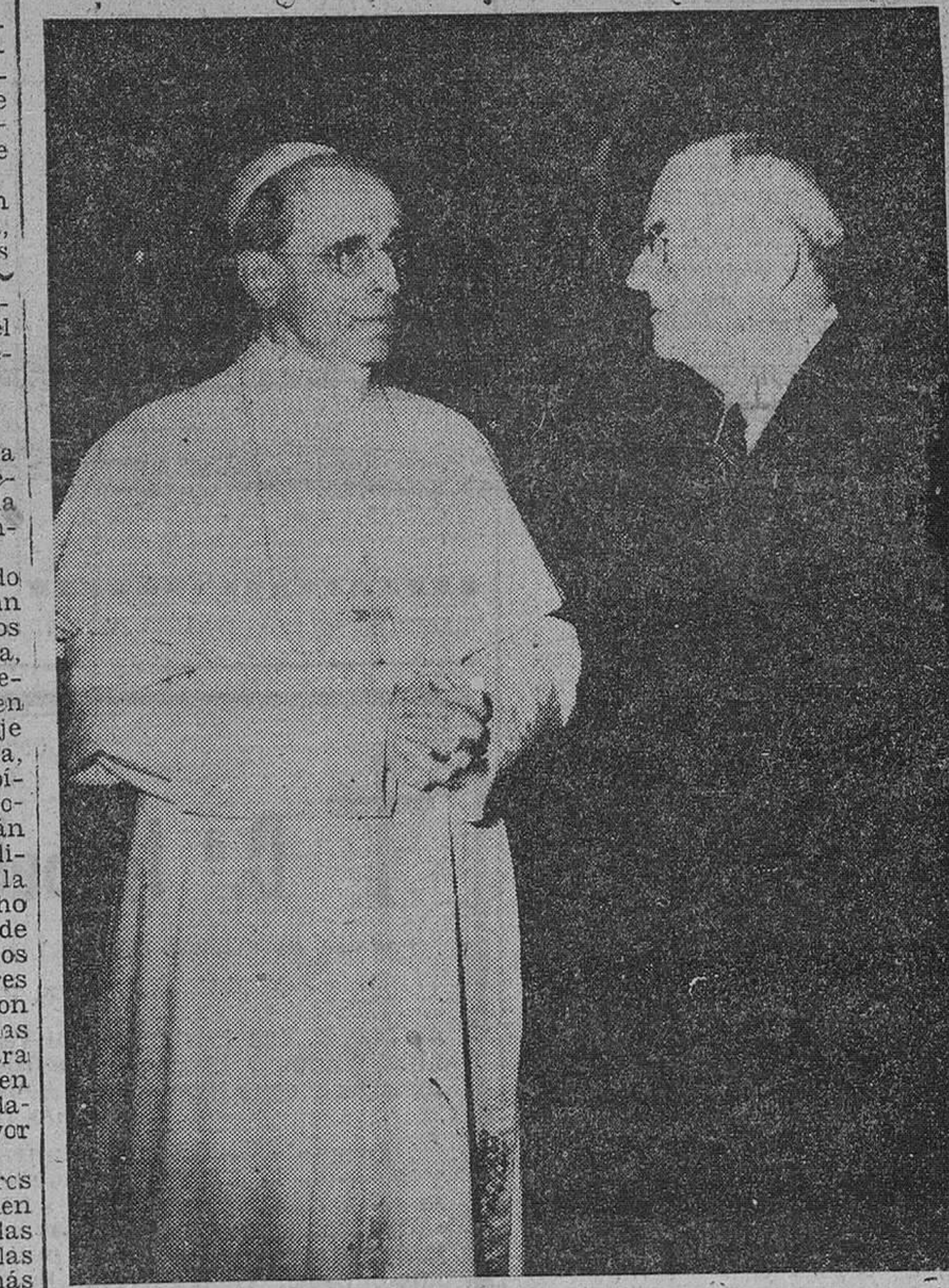
Roma. — S. S. Pio XII acompañado de Mr. Foster Dulles, secretario de Estado norteamericano, durante la audiencia especial celebrada en Castelgandolfo.