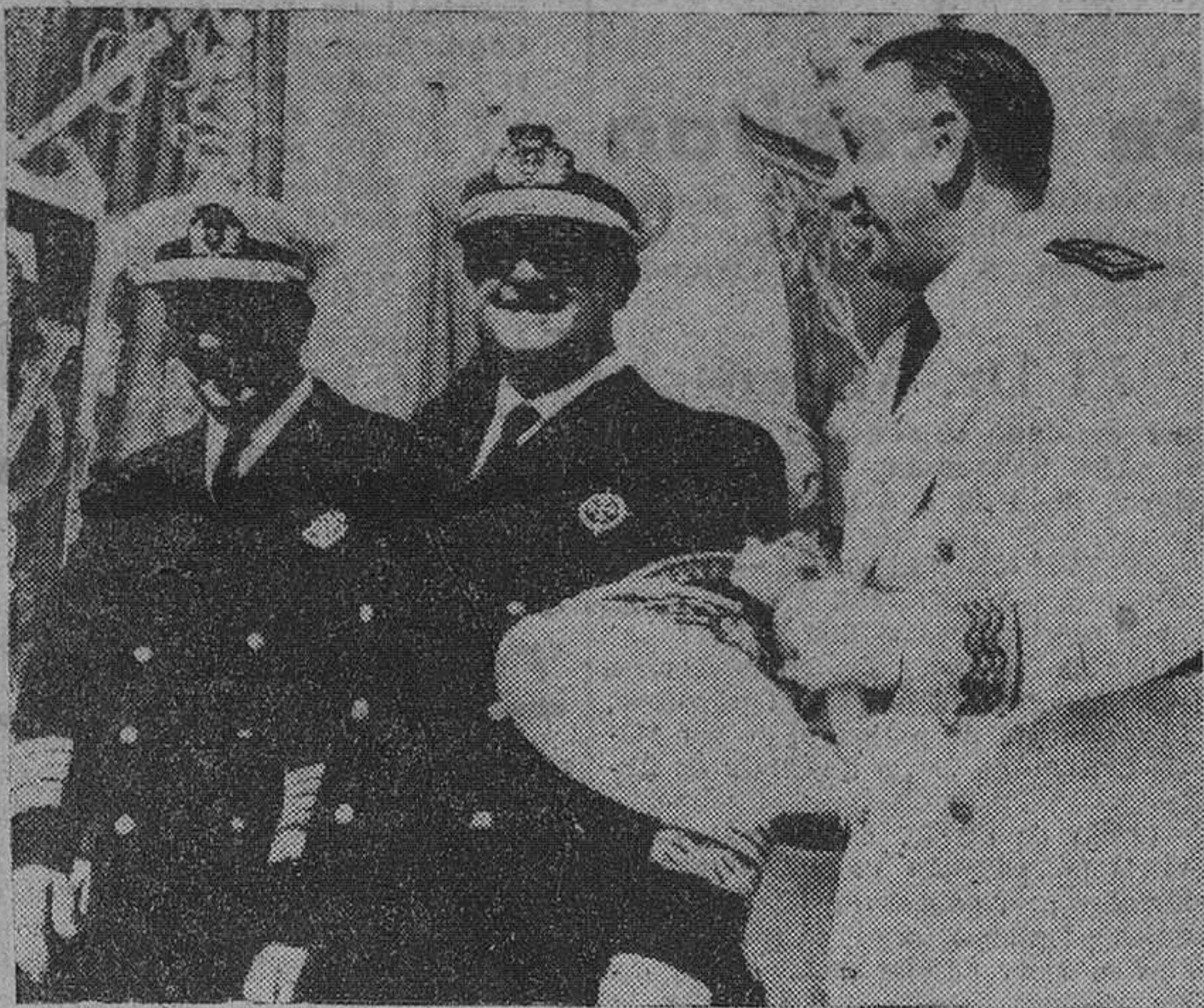
Ibiza. — S. E. el Jefe del Estado, con los ministros de Marina y Justicia, durante el acto de entrega de las llaves a los beneficiarios del grupo de viviendas "Santa Margarita". — (Foto Cifra).

Representantes de todos los pueblos hispánicos y E. U. efectuaron una ofrenda de flores ante la estatua de Colón