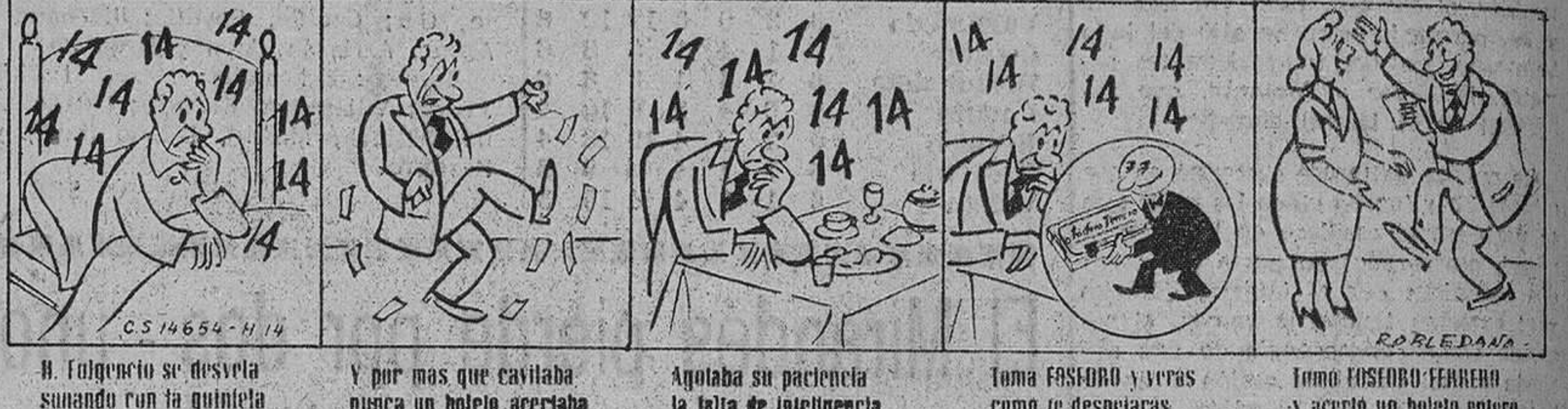
Al fulgencio se desvela sonando con la guitarra. Y por más que cavilaba nunca un boleto acertaba. Ajustaba su paciencia la falta de inteligencia. Toma FERRERO y vivras como te despejaras. Toma FERRERO FERRERO y acorta un boleto enterito.