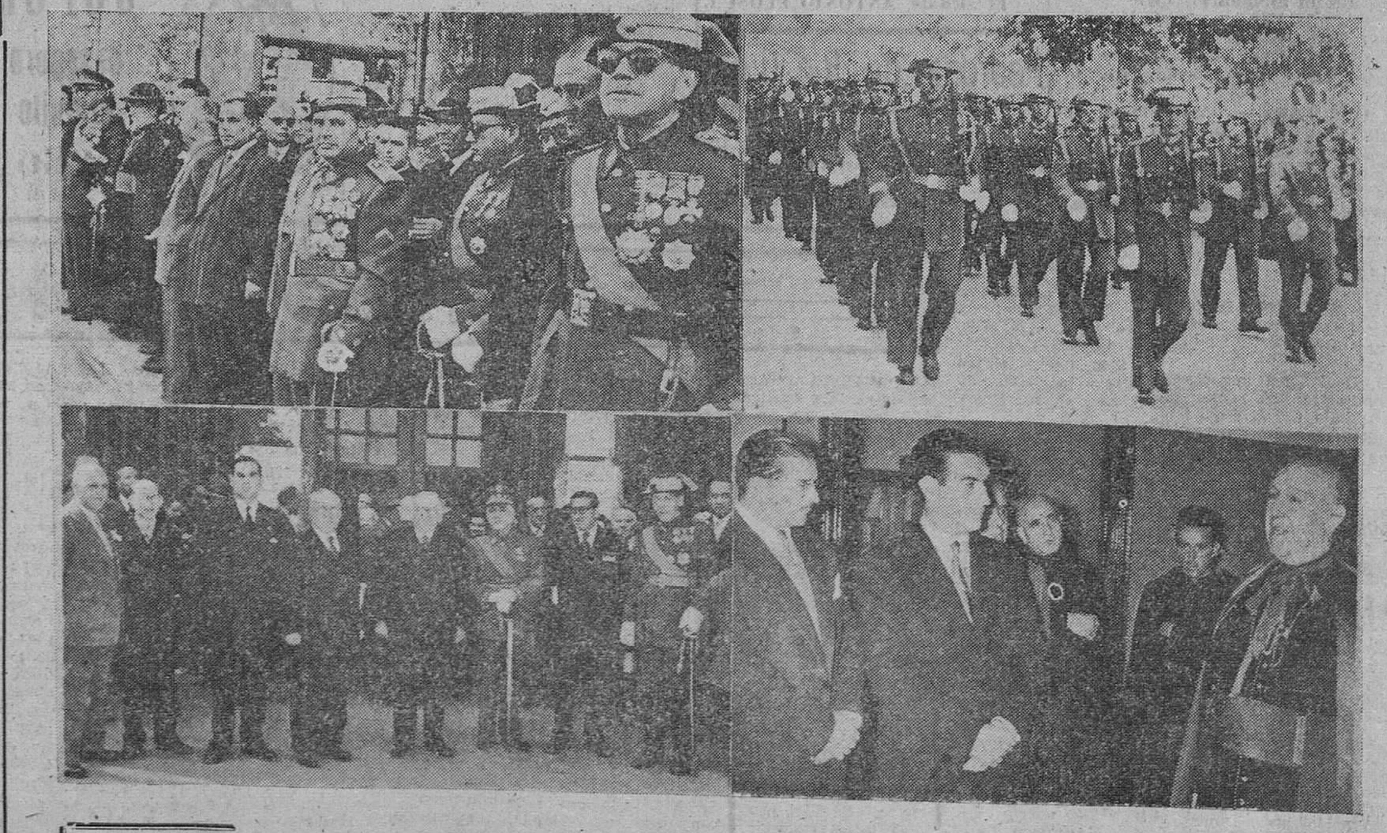
Cuatro documentos gráficos de los solemnes actos celebrados ayer en nuestra ciudad, en conmemoración de la fiesta del 12 de Octubre. Arriba, las autoridades que asistieron a la misa, organizada por el benemérito Instituto de la Guardia Civil, en honor de su Patrona, la Santísima Virgen del Pilar y las fuerzas del Cuerpo que asistieron al acto, desfilando al concluir el acto religioso. En la parte inferior, a la izquierda, autoridades y personalidades que presidieron la misa con el obispo, pronunciando unas palabras, tras bendecir el nuevo domicilio social de la Asociación Cultural Ibero-americana, que fue inaugurado ayer.