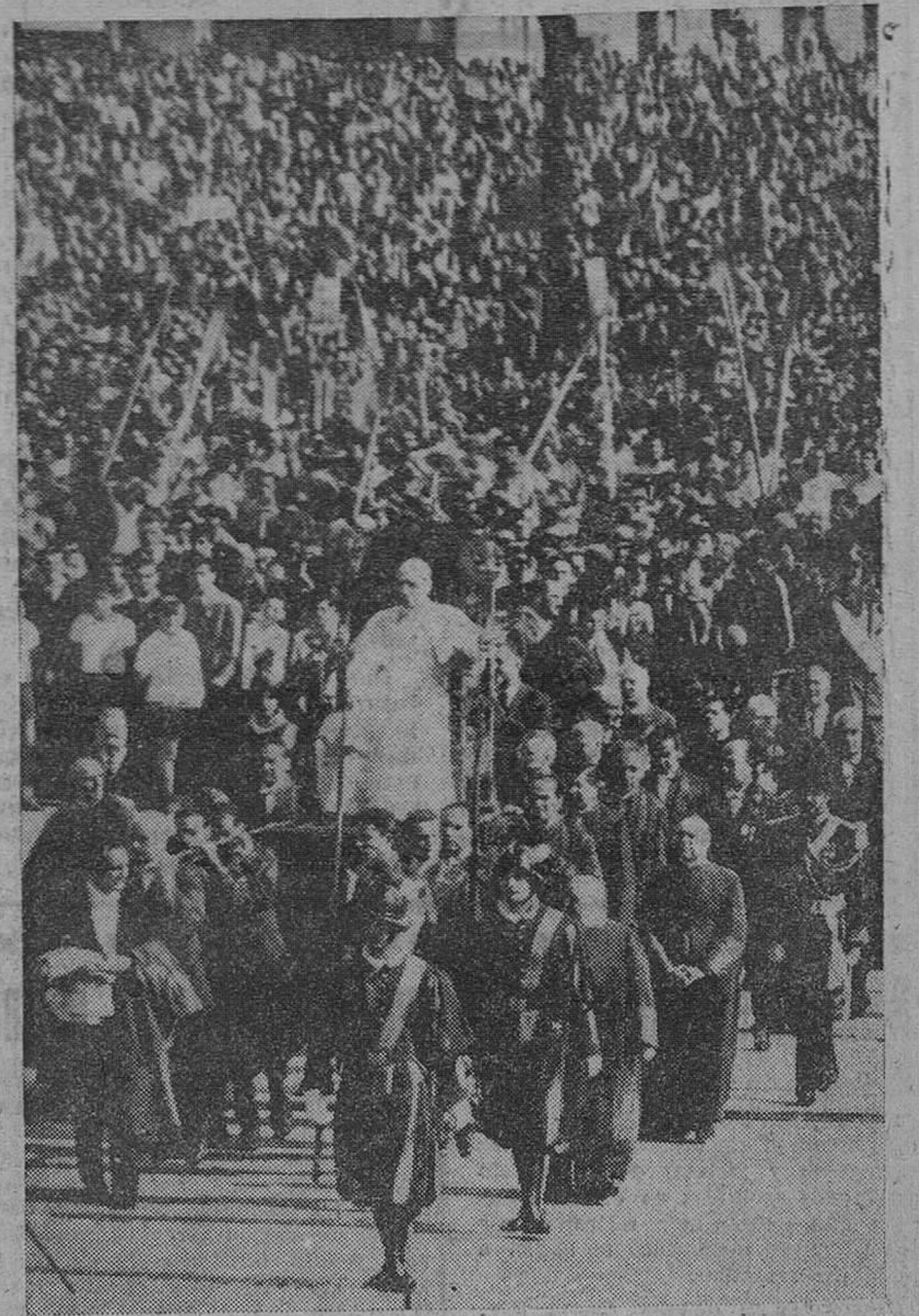
Roma. — El Santo Padre en su silla gestatoria, atraviesa la Plaza de San Pedro, durante la audiencia concedida a los deportistas, con motivo de cumplirse el X aniversario del Centro Sportivo Italiano. — (Foto Cifra)