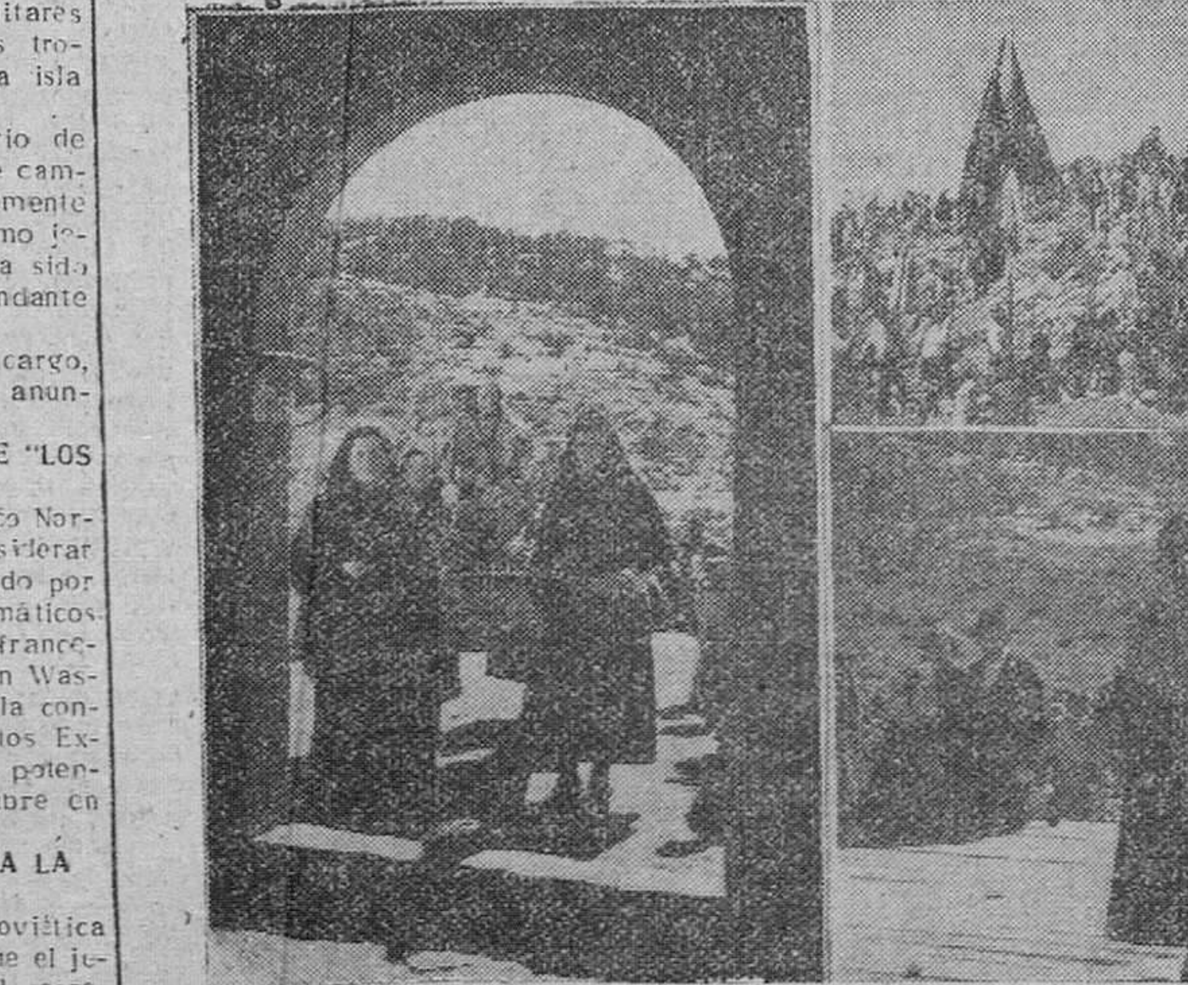
El Orfeón Burgalés celebró el pasado domingo, en los pintorescos parajes del Valle de Valdelaguna, su anual romería típica castellana. En nuestro grabado reproducimos tres momentos de esta brillante fiesta, que estuvo presidida por las primeras autoridades provinciales.

el coronel don Francisco Goicorrotea Valdés; el coronel don Juan Domínguez Catalán y el comandante don Enrique Montañez. Eran esperados en la estación por representantes del Ministerio de Defensa Nacional, Estado Mayor portugués y Gobierno Militar de Lisboa.