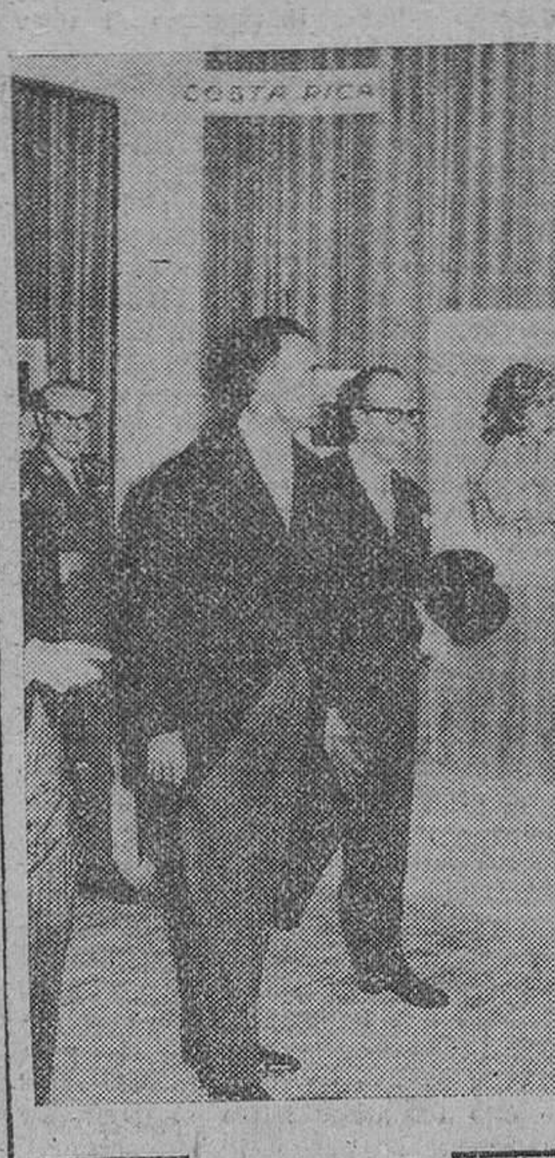
Barcelona.— El señor Ruiz Giménez, acompañado del director del Instituto de Cultura Hispanica y de las autoridades de esta capital, durante su visita a la III Bienal de Arte Hispano-Americano, con motivo de su inauguración.