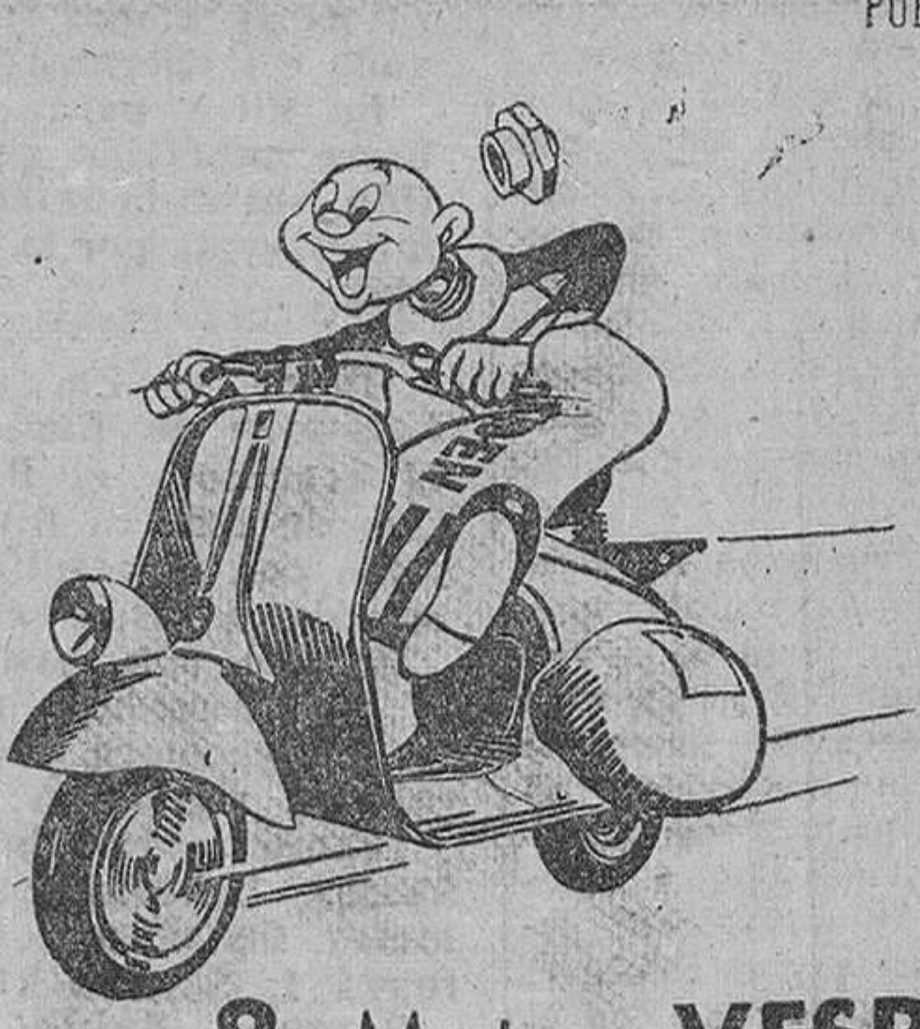
8 Motos VESPA