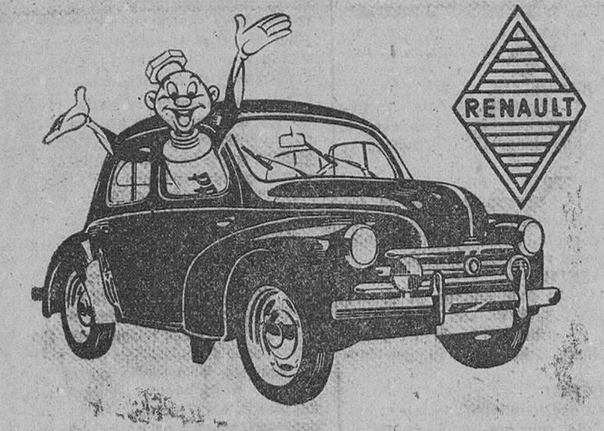
8 Coches RENAULT 4 C.V.

Ferias en Montorio Los días 2 y 3 de Octubre, se celebrarán por traslado, sus tradicionales ferias de toda clase de ganado.