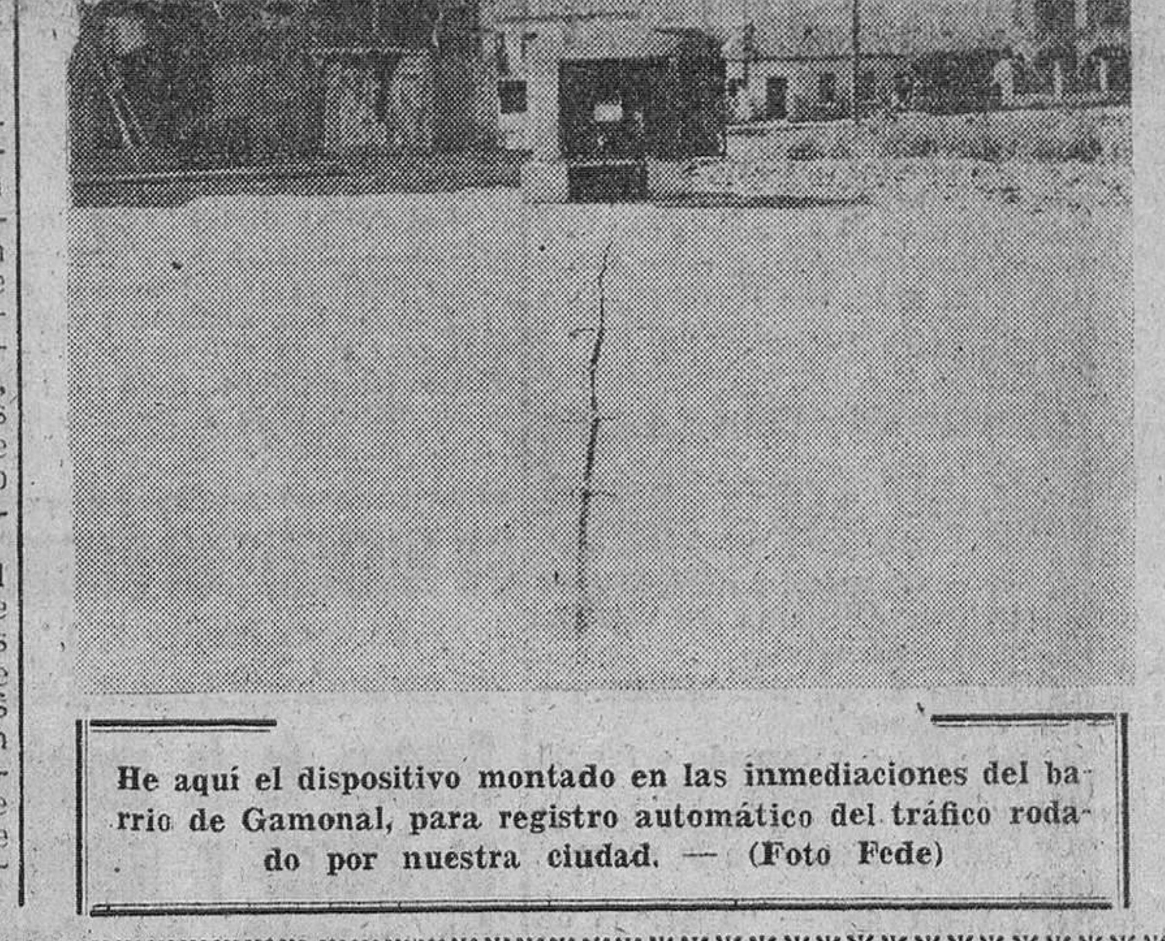
He aquí el dispositivo montado en las inmediaciones del barrio de Gamonal, para registro automático del tráfico rodado por nuestra ciudad.