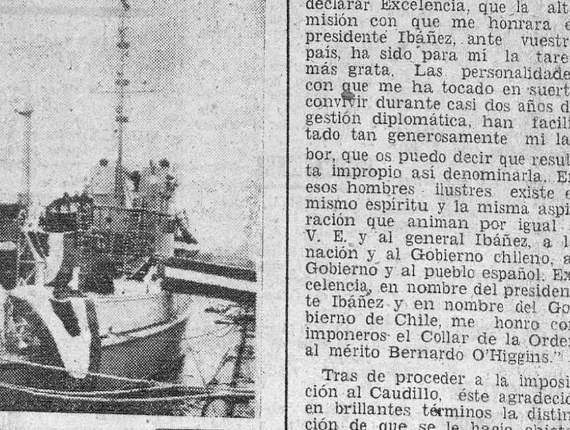
Nueva York. — El dragaminas de la Marina norteamericana MSC-130 que ha sido entregado al Gobierno español. Será bautizado con el nombre de "Turia". La ceremonia de entrega se celebró el día 1.º de Junio pasado, en el puerto de Nueva York.