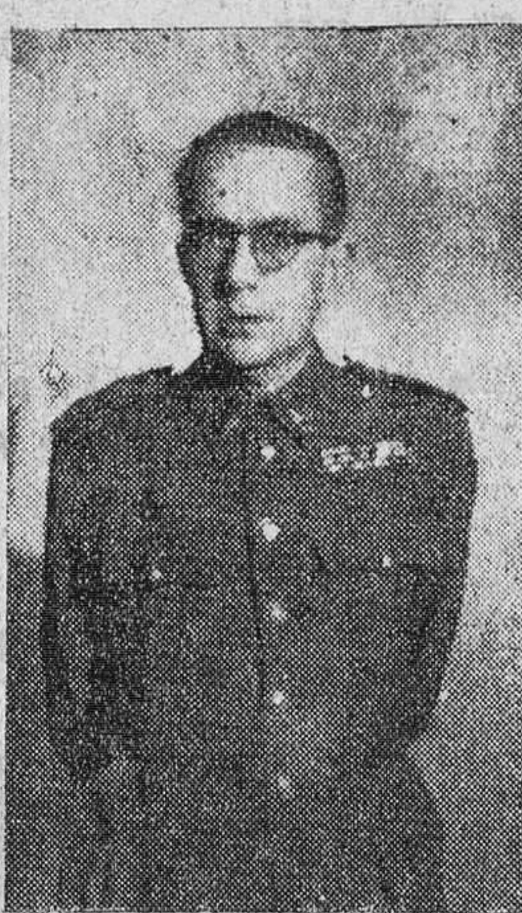
EL GENERAL IGLESIAS ASPIROZ

El actual, general Ysasi-Yasmendi, ha sido nombrado jefe de Instrucción del Estado Mayor Central del Ejército