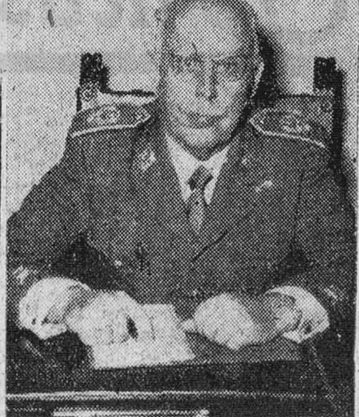
EL GENERAL YSASI-YASMENDI

Pero el triunfo más justo y el que proporcione a Geza Von Bolvary el orgullo del mejor título de su carrera, es "El último vals de Chopin". Bolvary, gracias a los sensiblemente los detalles, extrayendo tanto partido expresivo de la situación que la película alcanza un conjunto de sobresaliente calidad. En la escuela vienesa, corresponde a este film un lugar inmediato a las realizaciones de Charrell y Forst.