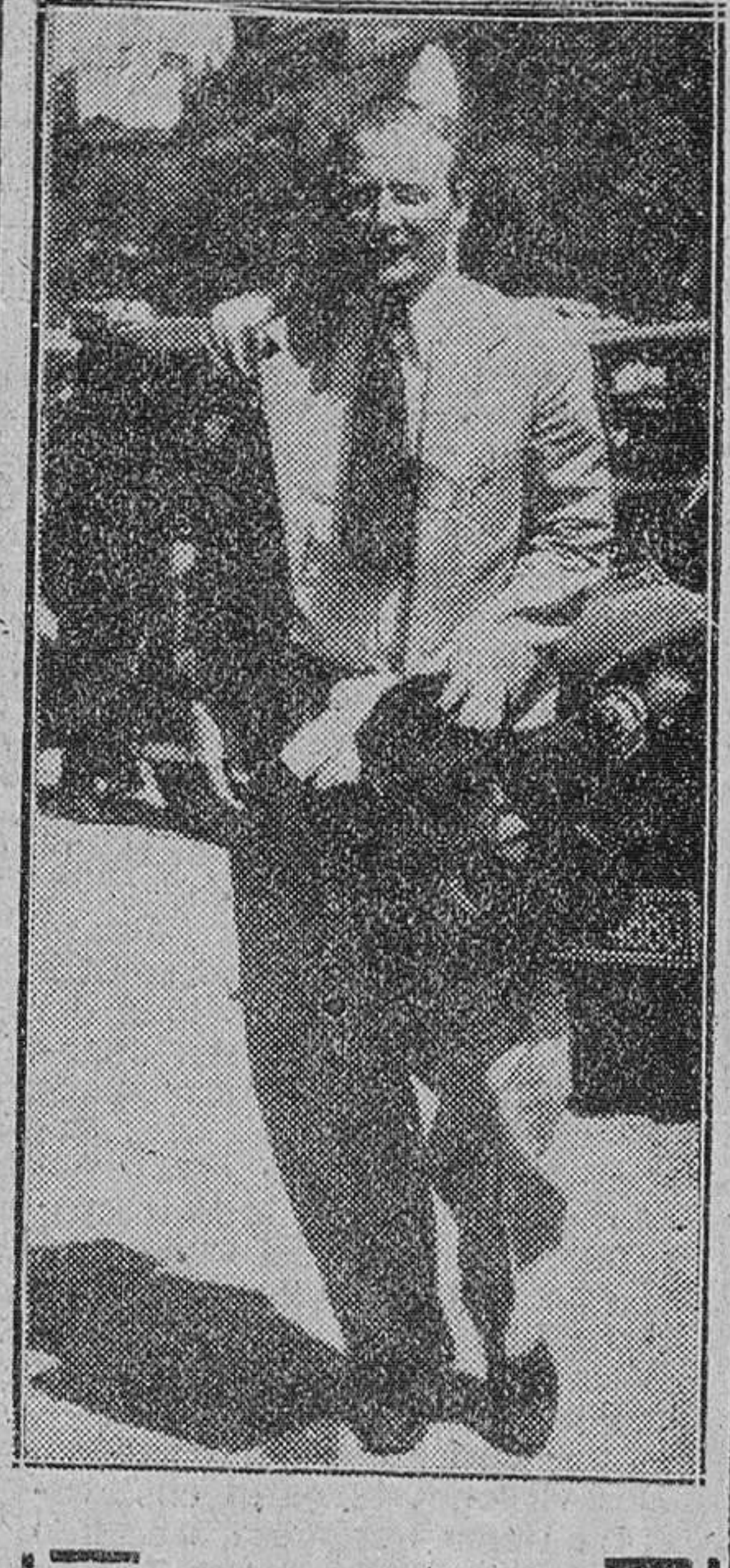
Selwyn Lloyd, nuevo ministro de Defensa en el Gabinete británico.

Millón y medio de norteamericanos poseen ya su magnetofón y los vendedores de este aparato se ven todos los días perseguidos por los compradores. Hay una tienda modesta en Nueva York que un día, por la mañana, recibió noventa aparatos y a la hora y media ya los habían vendido todos. Todas las firmas de discos han reeditado sus mejores obras en cinta magnetofónica. La última maravilla es el llamado "Video", que la compañía de que es presidente Bing Crosby ha lanzado al mercado. El "Video" es una cámara de televisión que registra a la vez las imágenes en colores y los sonidos y los difunde en una misma banda. Ganancia prodigiosa de tiempo y de dinero, ante la cual se halla un esplendor porvenir para esta industria. Y, a pesar de todo, la ciencia del magnetofón y su industria se hallan todavía en la infancia. Esta es la declaración que acaba de hacer David Sarnoff, el más calificado hombre de negocios de radio, de televisión y de magnetofón. Según Sarnoff llegará un día en que todo americano tenga su aparato de cinta magnetofónica, como tiene su aparato de retratar.—ALBERT CHAVES.