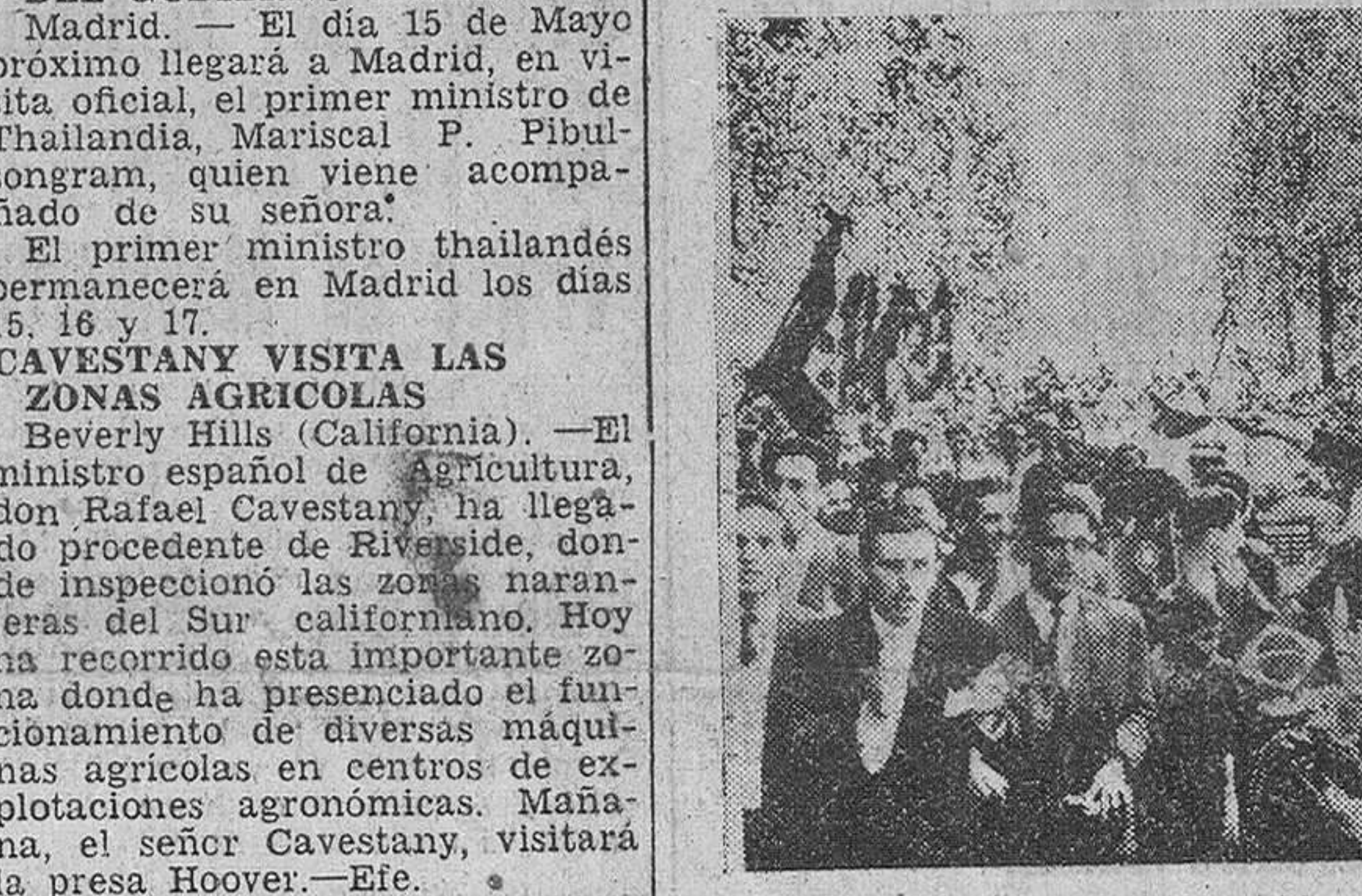
Lisboa. — El presidente del Brasil, Dr. Café Filho, agitando dos banderas portuguesas y en medio de una lluvia de papavillos blancos, durante su entrada triunfal en esta capital, con motivo de su viaje oficial a Portugal.