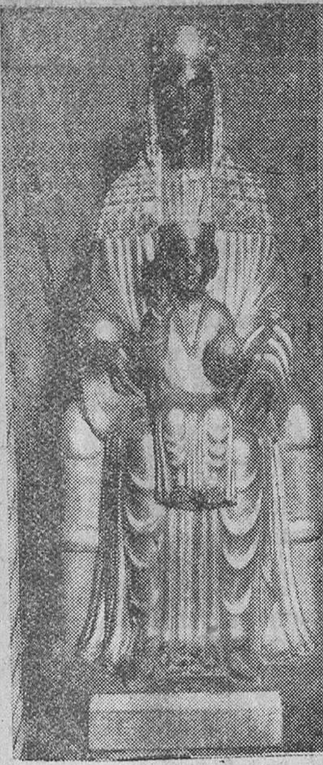
Imagen de Nuestra Señora de Montserrat, regalada por un catalán acaudalado en Burgos al Centro regional recientemente constituido en nuestra ciudad, cuya entidad celebra hoy solemne su fiesta patronal.