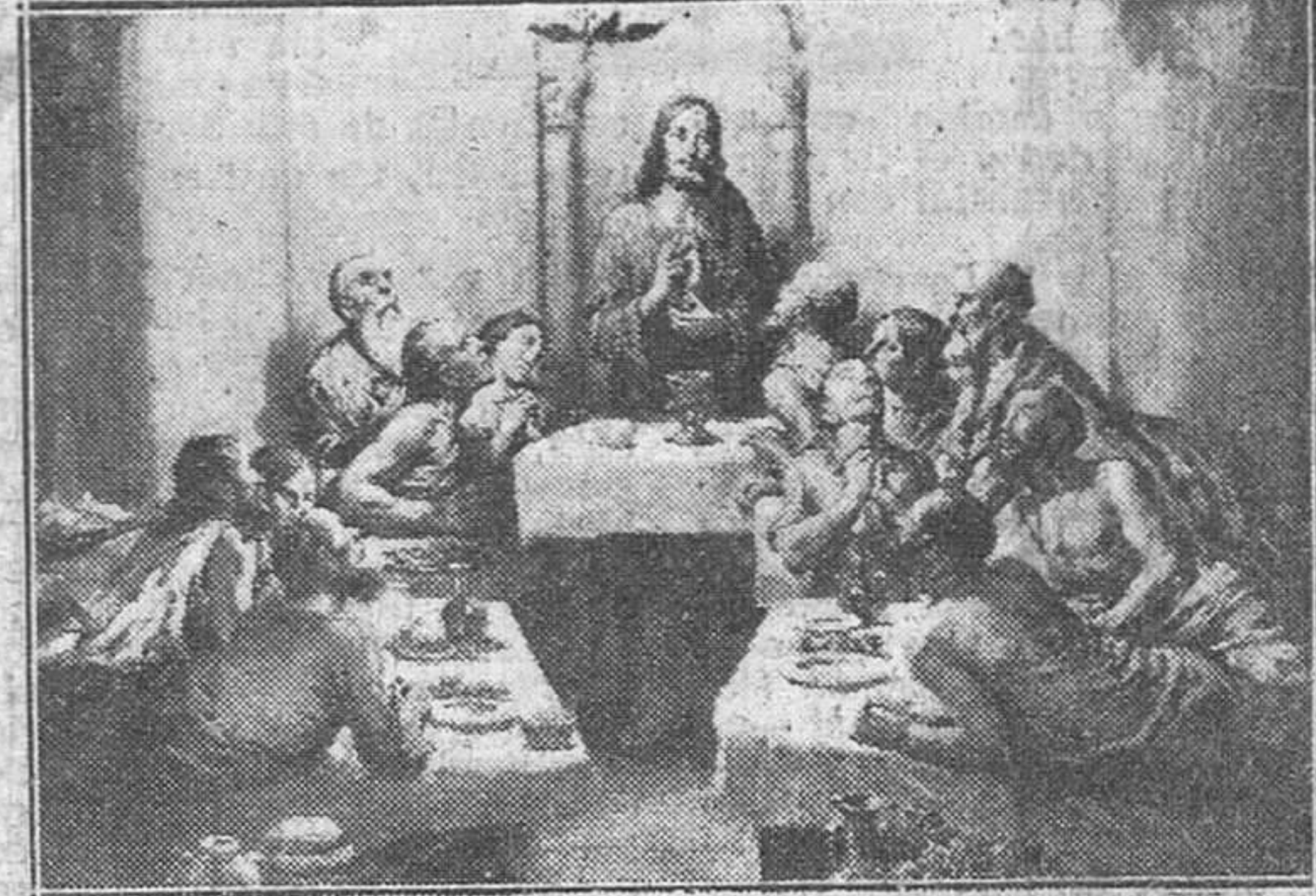
Cuadro de "La Cena", una de las últimas obras del finado pintor burgalés, Don Marceliano Santa María.

A MOR! He aquí la palabra que resume bien elocuentemente, los sentimientos de Jesús hacia la Humanidad. Y, porque la amaba, se sacrificó por ella quedándose en el Sagrario. Y, porque la amaba, uniendo la sabiduría y la omnipotencia, Cristo buscó un medio de volver al Padre y quedarse con los hombres. Y este medio es la Eucaristía, misterio insondable de amor, expresión la más acabada de ese amor de Quien no contento con quedarse entre nosotros, quiso unirse a nosotros lo más íntimamente, convirtiéndose en alimento de nuestras almas. Con razón Santo Tomás, aquel enamorado de la Eucaristía, que la cantó cual nadie en el admirable Oficio dedicado al "Corpus Christi", afirma: "La suma liberalidad de Dios es la Eucaristía, porque es lo más que pudo darnos, a Sí mismo" y San Buenaventura, abundando en este mismo pensamiento, dice: "El último grado de amor nos lo dio Cristo al darse a nosotros en alimento" ¡Y cómo nos une a Él este misterio de amor!