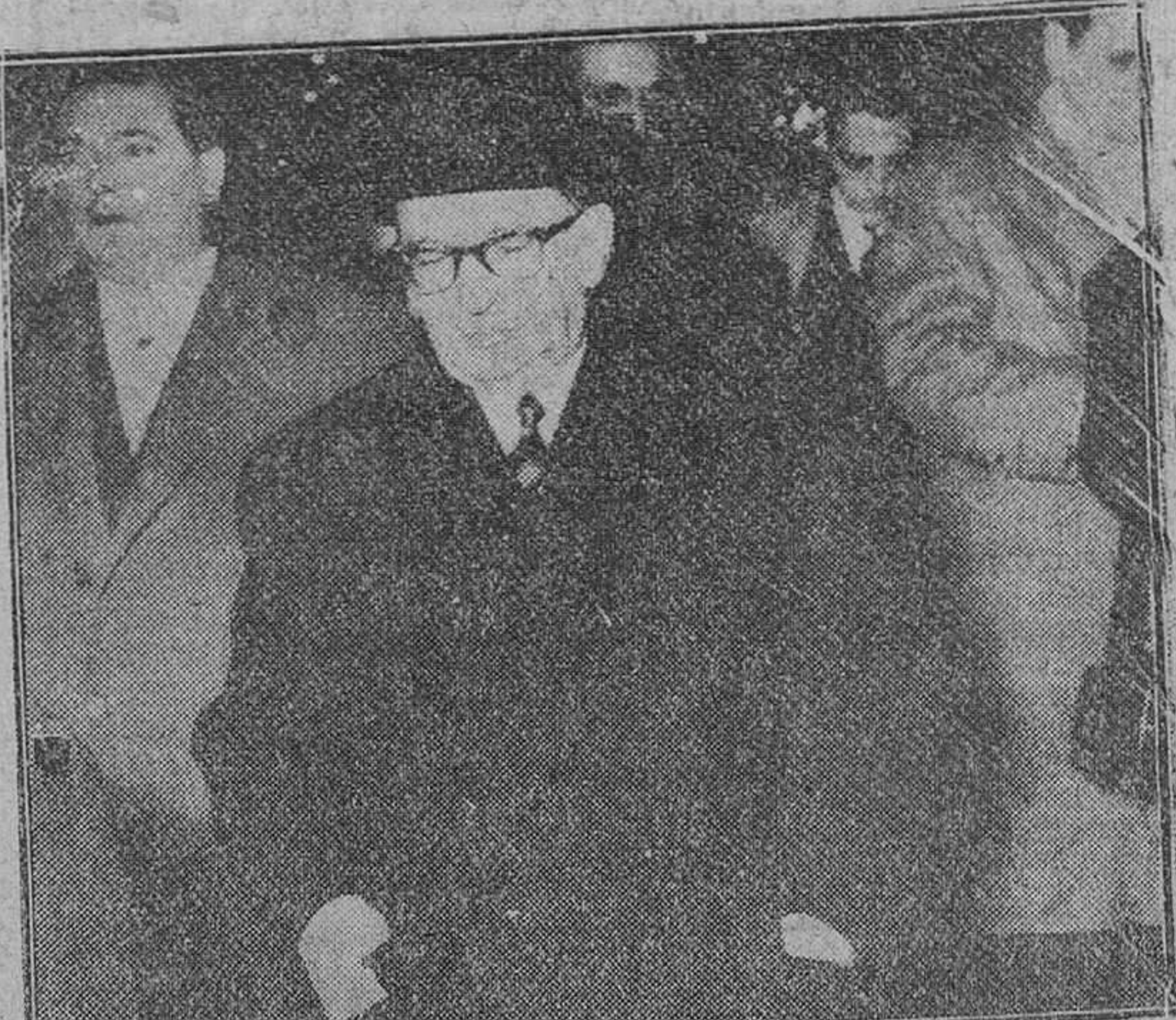
Paris. — Edgar Faure, nuevo jefe del Gobierno francés, fotografiado al salir del palacio del Eliseo, después de entrevistarse con el presidente Coty.

Alcanzó la aprobación de la Cámara, por 369 votos contra 210