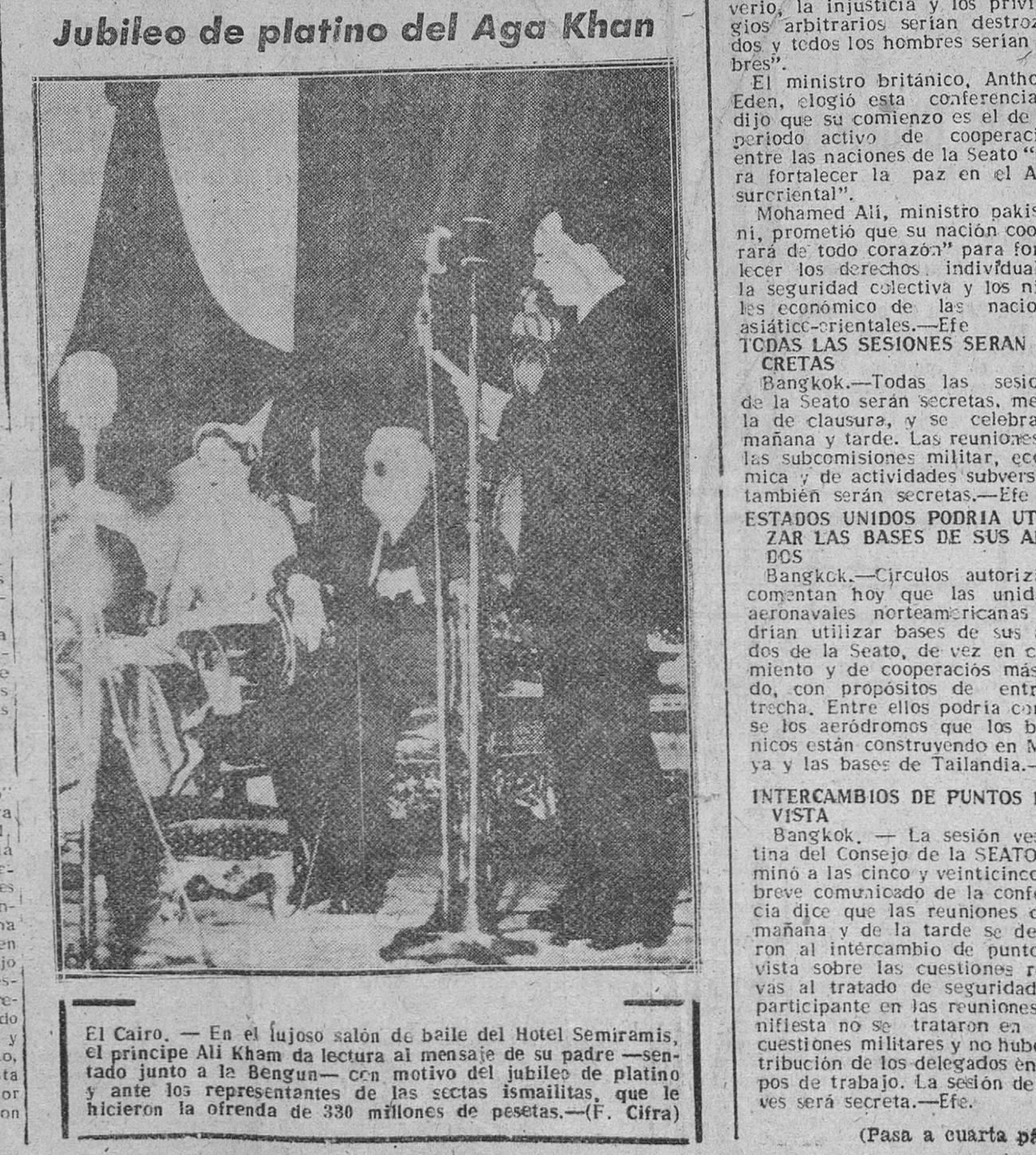
El Cairo. — En el lujoso salón de baile del Hotel Semiramis, el príncipe Ali Khan da lectura al mensaje de su padre —sentado junto a la Bengum— con motivo del jubileo de platino y ante los representantes de las sectas ismailitas, que le hicieron la ofrenda de 330 millones de pesetas.—(F. Cifra)

Bangkok. — La sesión vespertina del Consejo de la SEATO terminó a las cinco y veinticinco. Un breve comunicado de la conferencia dice que las reuniones de la mañana y de la tarde se dedicaron al intercambio de puntos de vista sobre las cuestiones relativas al tratado de seguridad. Un participante en las reuniones manifestó no se trataron en ellas cuestiones militares y no hubo distribución de los delegados en grupos de trabajo. La sesión del jueves será secreta.—Efe.