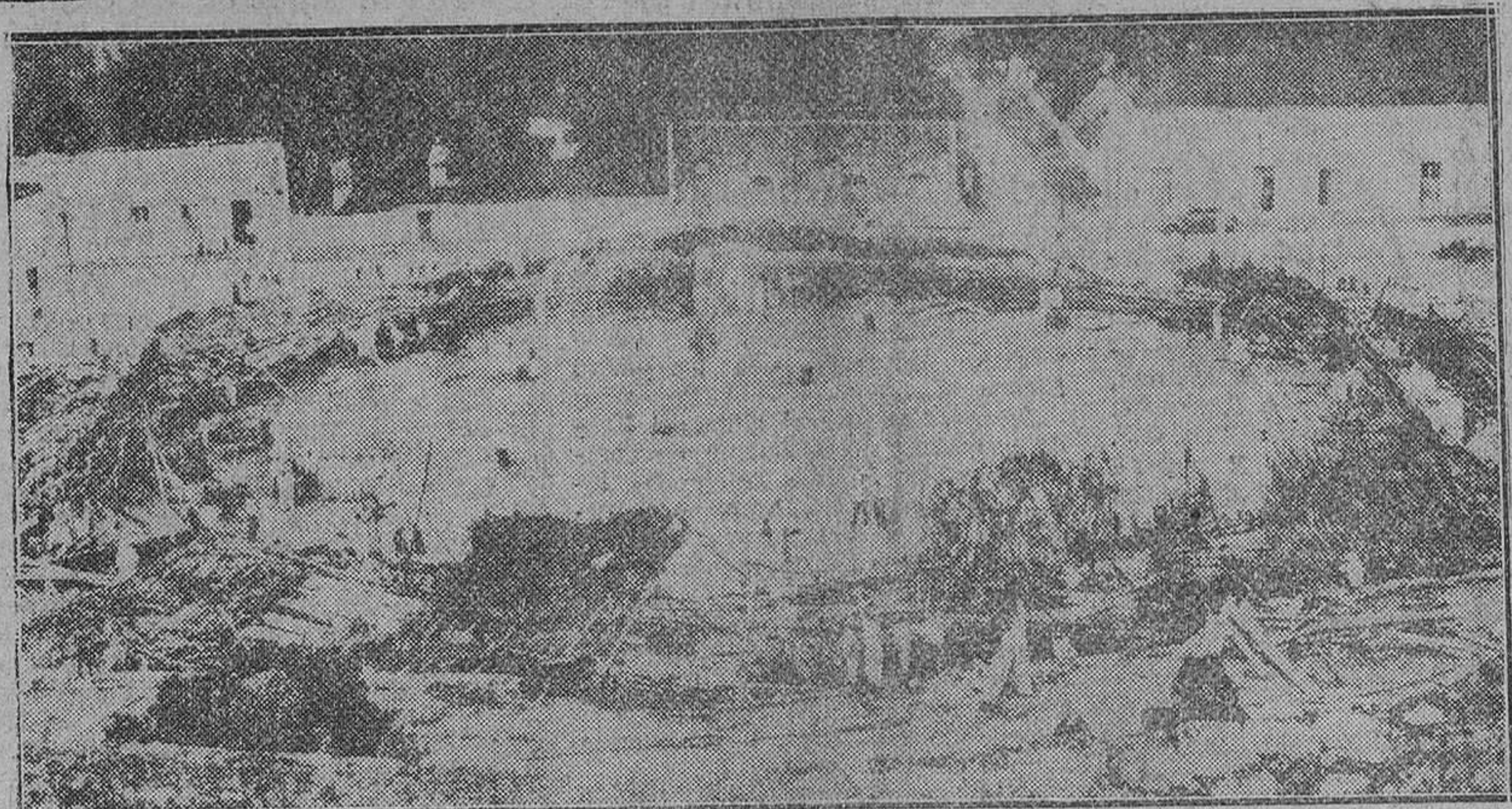
Villa Humucma (Yucatán, Méjico). — Fotografía tomada después del derrumbamiento de la plaza de toros de madera, montada de manera improvisada en esta localidad. Hubo que lamentar 16 muertos y 186 heridos.

Los siguientes resultados antes del 30 de Junio de 1955: 1.—Aumento de la producción industrial, del nivel actual de 153, a 180. 2.—Aumento general del nivel de vida, que deberá llegar por lo menos al siete por ciento en la misma fecha. 3.—Los ingresos generales agrícolas deberán aumentar en la misma proporción. 4.—La balanza de cambios extranjeros se nivelará sin ninguna ayuda extranjera y el Gobierno francés renunciará de ahora en adelante a toda ayuda de esta clase.—Efe.