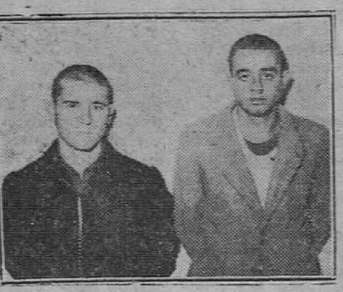
La pareja de malhechores que ha caído en manos de la Policía tras la comisión de una serie de importantes delitos contra la propiedad

Desde hace unos meses se venían cometiendo en esta capital robos de maletas, ropas y otros enseres que despreciaban a España y a esta ciudad por ser las víctimas en su mayoría turistas extranjeros, entre cuyos hechos figura el realizado en la tarde del día 23 de Diciembre pasado en un coche aparcado frente al Hotel Condestable, de donde, tras romper con una piedra de regular tamaño el cristal de la puerta se llevaron dos maletas conteniendo infinidad de prendas y objetos propiedad del subdito francés M. Pierre Louise Tessier, de 28 años, natural de Cognac (Francia) y domiciliado en dicha localidad, quien valoró lo sustraído en unas 30.000 pesetas.