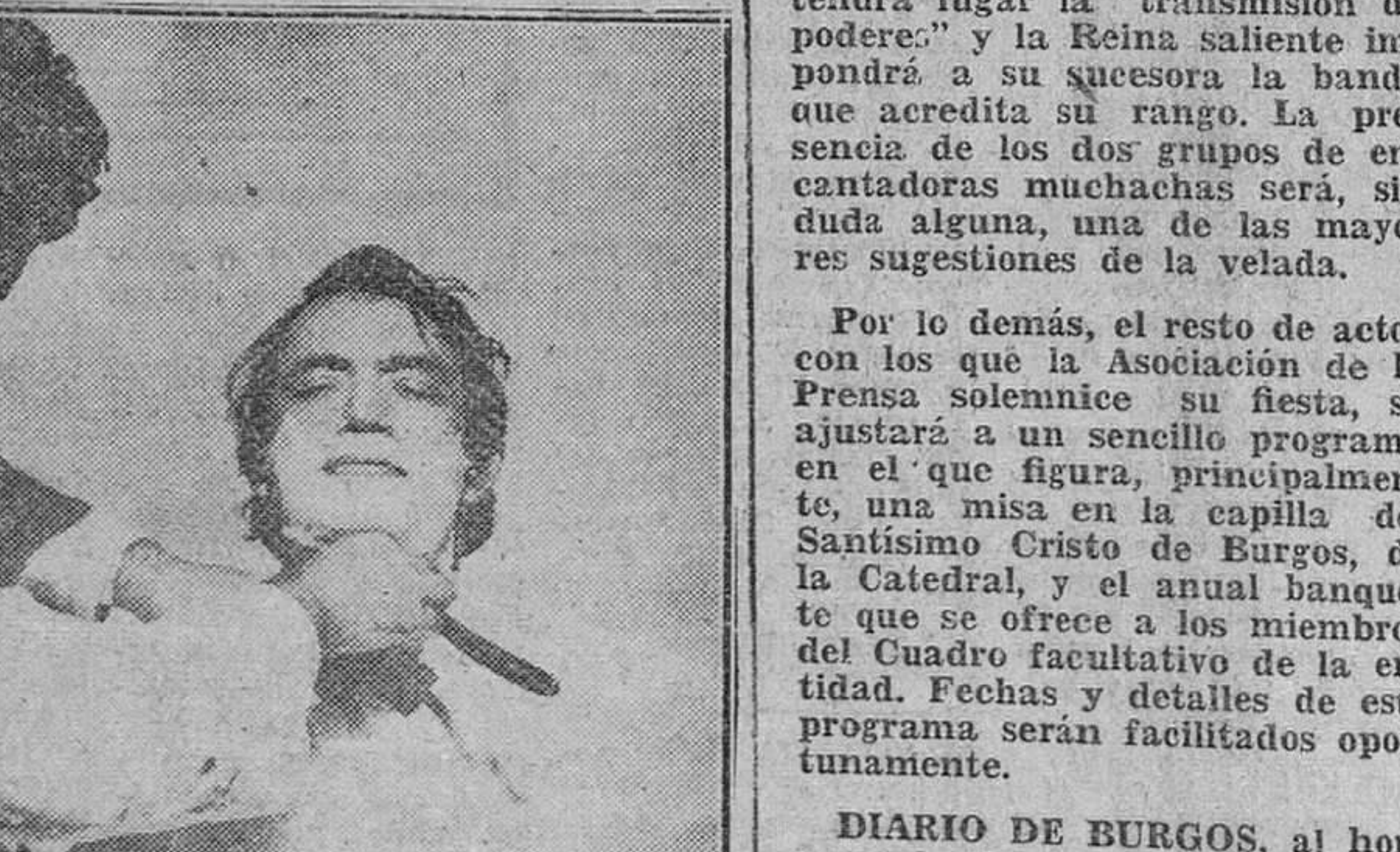
Las Palmas. — Después de dar por terminada su intervención en la película “Moby Dick”, algunas de cuyas escenas se han rodado en esta isla, el popular actor norteamericano Gregory Peck, decidió cortarse su gran barba y su espesa melena, que por necesidades de su papel había tenido que dejarse. En la foto, un peluquero de esta capital procede a afeitar al actor.