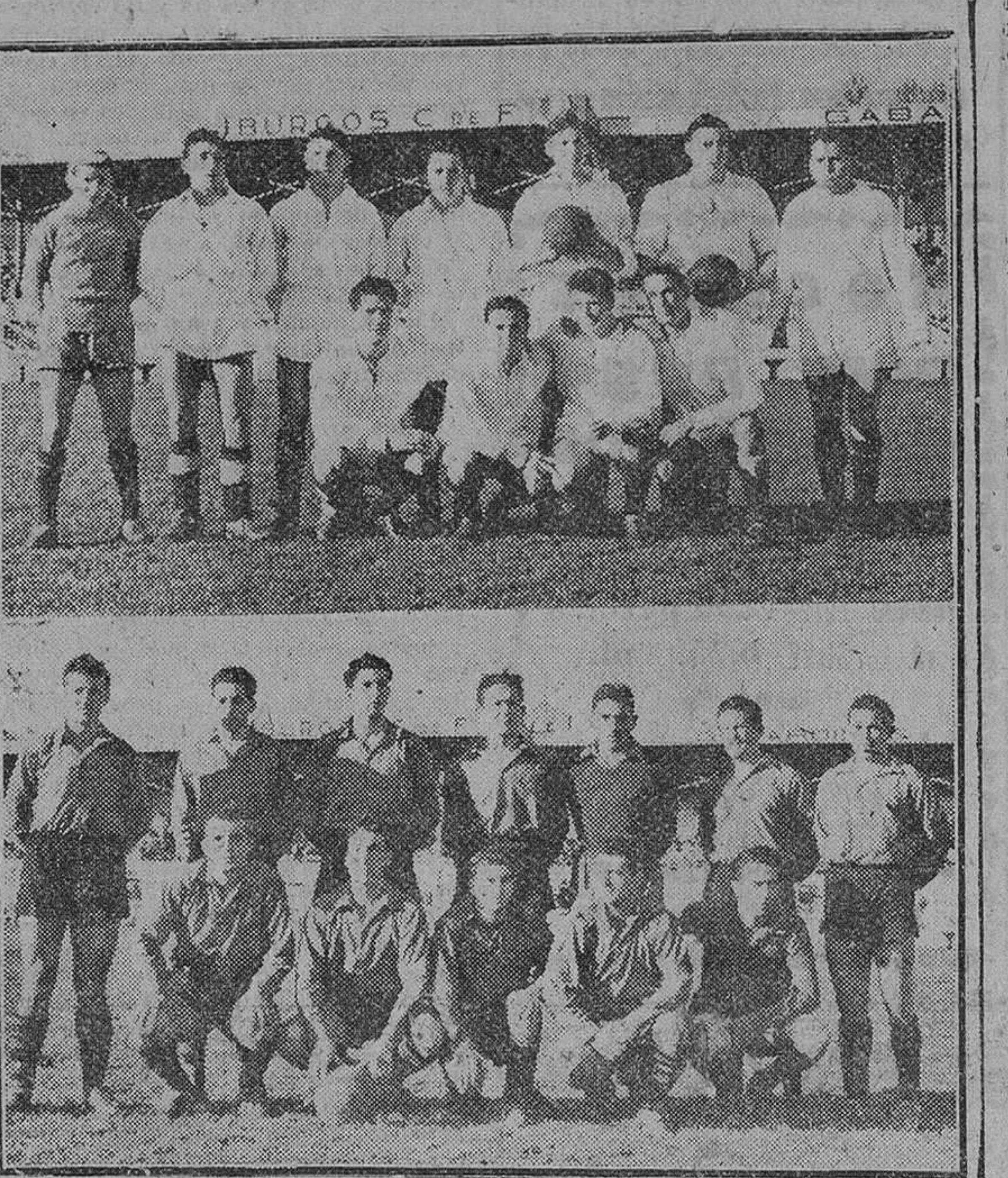
Equipos del Deportivo Juventud y Deportivo Mirandés, que contendieron el domingo último en Zatorre, en partido amistoso, venciendo los mirandeses por 4-2.

Un primer tiempo favorable a los locales y un segundo de superioridad mirandesa