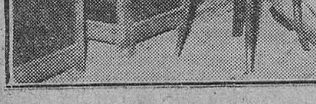
He aquí parte de los efectos sustraídos por los delincuentes a que se hace referencia en esta información

Solicite catálogo ilustrado a VIVEROS PROVEDO LOGRONO