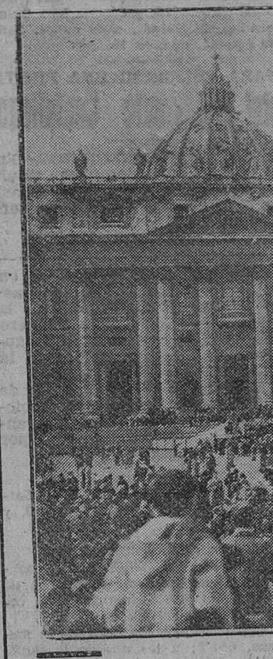
Ciudad del Vaticano. — La muchedumbre asiste en la Plaza de San Pedro a la suelta de palomas, que fueron a posarse en las ventanas del Palacio Apostólico, como homenaje a Su Santidad. El acto fué organizado por la Asociación de Posedores de Palomas, en la clausura del Año Mariano. — (Foto Cifra)