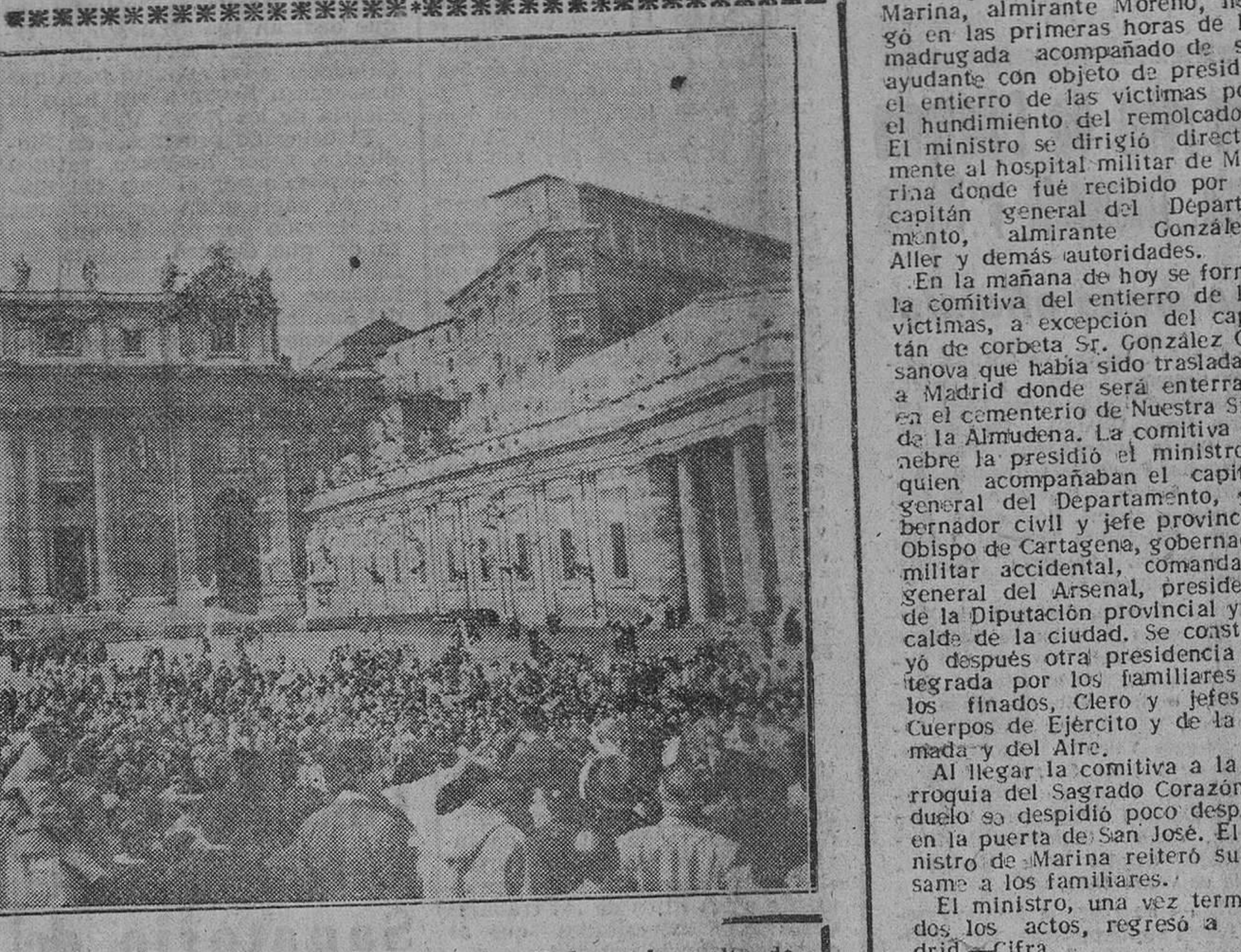
Ciudad del Vaticano. — La muchedumbre asiste en la Plaza de San Pedro a la suelta de palomas, que fueron a posarse en las ventanas del Palacio Apostólico, como homenaje a Su Santidad. El acto fué organizado por la Asociación de Posedores de Palomas, en la clausura del Año Mariano.

Ha sido probado y entregado en El Ferrol del Caudillo un nuevo petrolero