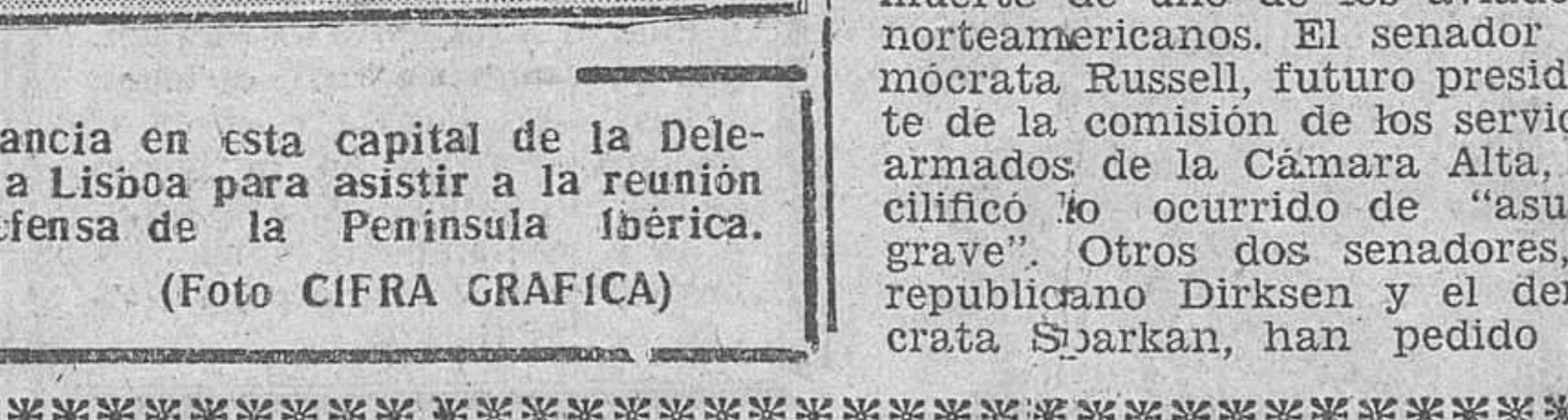
Lisboa.—Un momento de la estancia en esta capital de la Delegación militar española llegada a Lisboa para asistir a la reunión de Estados Mayores para la defensa de la Península Ibérica.

EN LO ALTO DE LA SIERRA DE LA DEMANDA, HA SIDO COLOCADA UNA IMAGEN DE LA VIRGEN DE LAS NIEVES