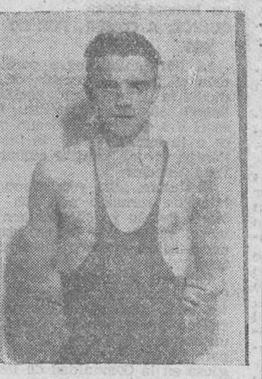
Anche, en el restaurante "Eladio", la Federación Norte de Lucha celebró su habitual reunión de confraternidad de fin de año.