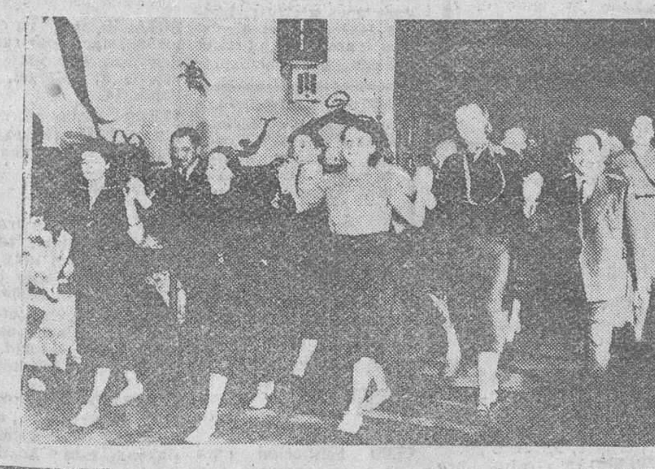
En Edimburgo (Escocia) funciona desde el año 1945, un Hogar Internacional, que tiene socios de todos los países del globo. En la fotografía aparecen muchachos de diferentes naciones, celebrando alegremente una fiesta.