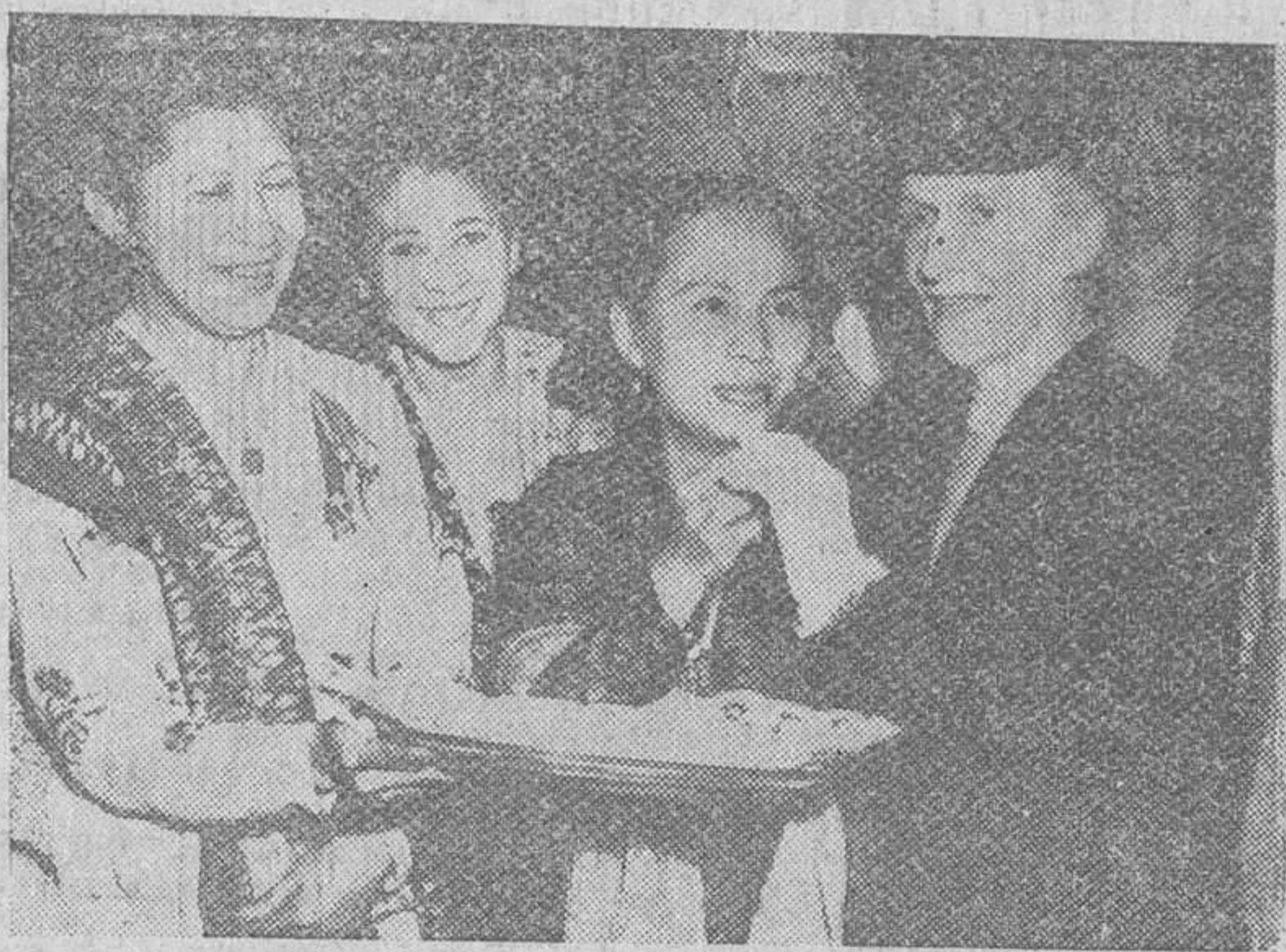
La esposa del embajador de Indonesia en Londres, ofrece un pedazo de getuk a Lady Astor, la primera mujer que ha sido miembro del Parlamento de Inglaterra, en el curso de una fiesta de Navidad. El getuk es un pastel de patata, plato típico de Indonesia.