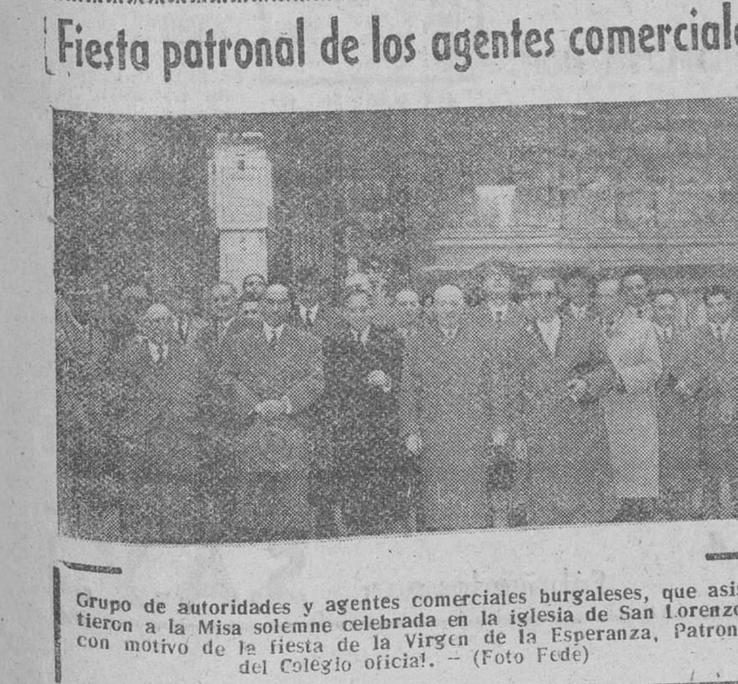
Grupo de autoridades y agentes comerciales burgaleses, que asistieron a la Misa solemne celebrada en la iglesia de San Lorenzo, con motivo de la fiesta de la Virgen de la Esperanza, Patrona del Colegio oficial.

El martes, monseñor Antoniutti presentarán sus credenciales