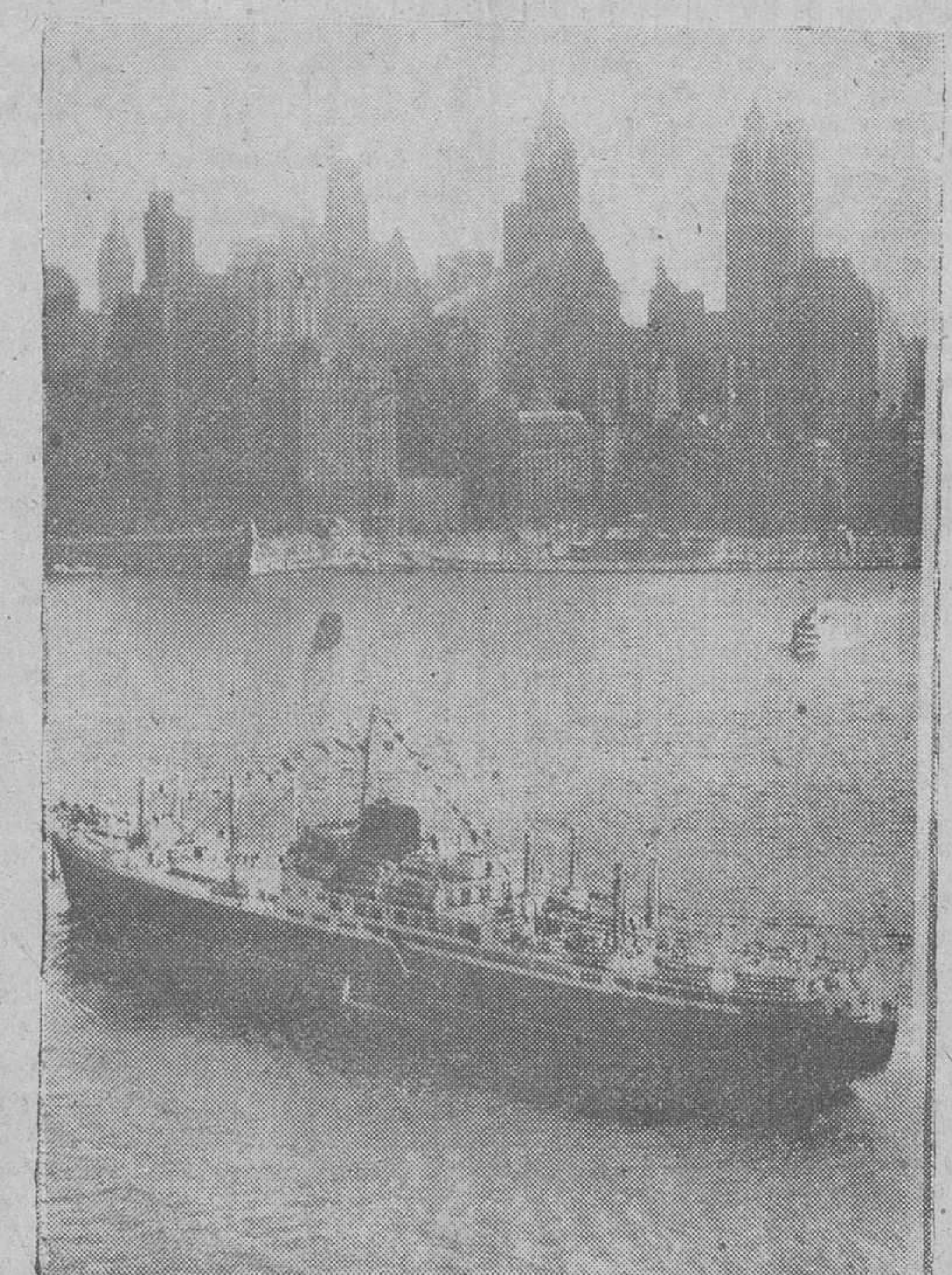
Nueva York. — Teniendo como fondo los rascacielos, la nueva motonave española "Covadonga" nos ofrece esta bella fotografía, a su llegada al puerto de Nueva York, al término de su primer viaje trasatlántico, desde Bilbao.