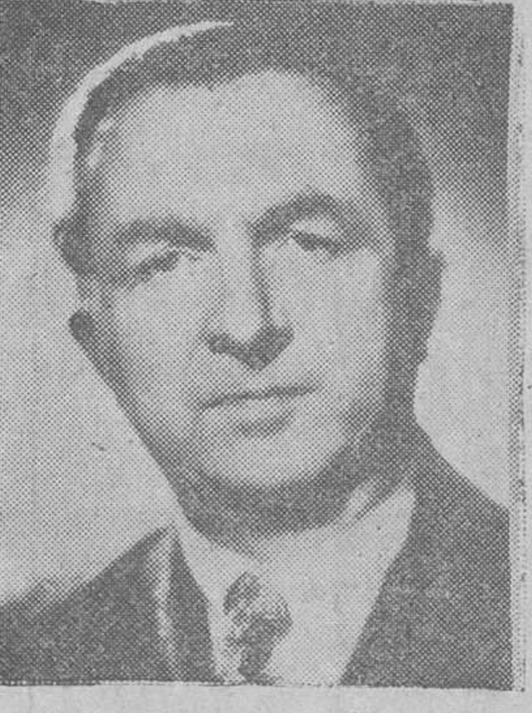
Giuseppe Pella, jefe del Gobierno italiano, que ha propuesto un plebiscito para la solución del problema de Trieste.