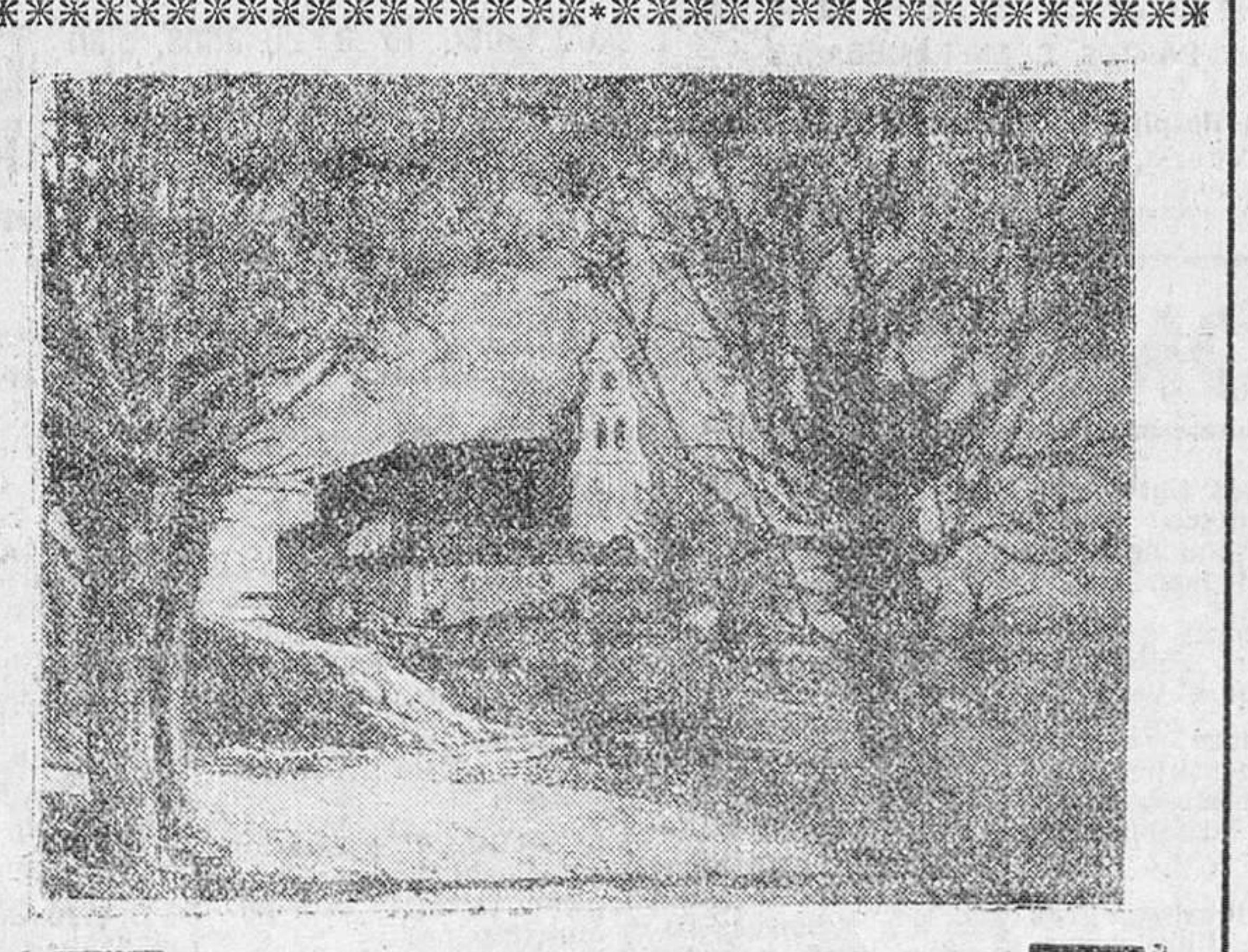
Exposición pictórica. Mañana jueves y en la sala de arte del Teatro Principal, inaugurará una interesante exposición pictórica el artista local Mariano P. Navarro, que después de varios años en que no lo ha hecho, presentará una variada colección de óleos. Uno de éstos es el que reproducimos en nuestro grabado.

Por cuarta vez comparece ante un tribunal el autor del robo en la Catedral hispalense.