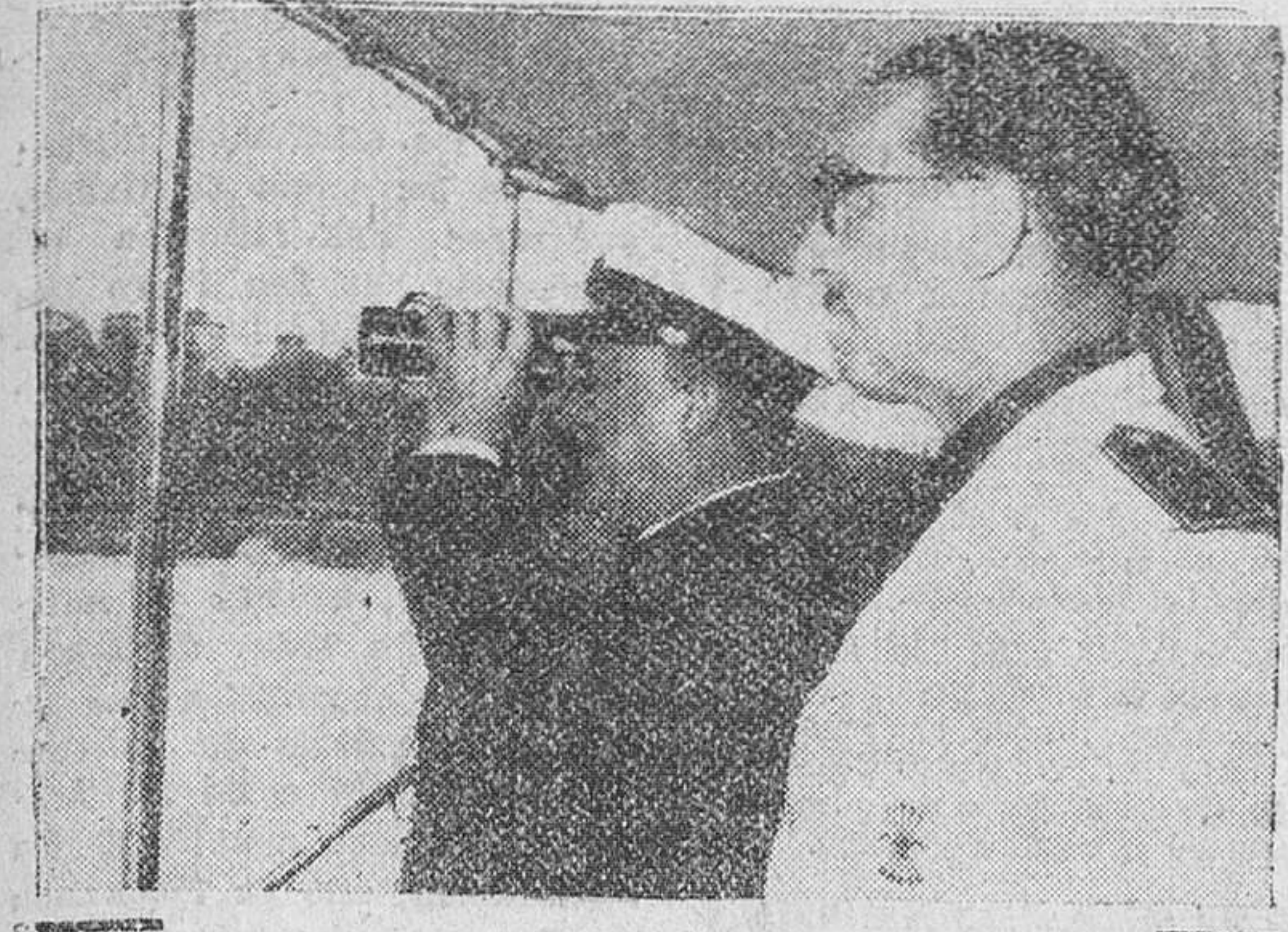
San Sebastián. — S. E. el Jefe del Estado, acompañado del gobernador civil de Guipúzcoa, sigue a través de los prismáticos, desde el yate "Azor", el desarrollo de las regatas de bateles celebradas en esta bahía y en la que resultó vencedora la tripulación de la Babcock Wilcox, de Bilbao.