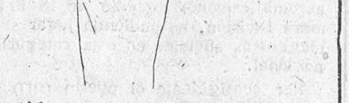
Vestido de gasa aleutiana con detalle inédito. Creación Nina Ricci. Diseño de José Zamora.