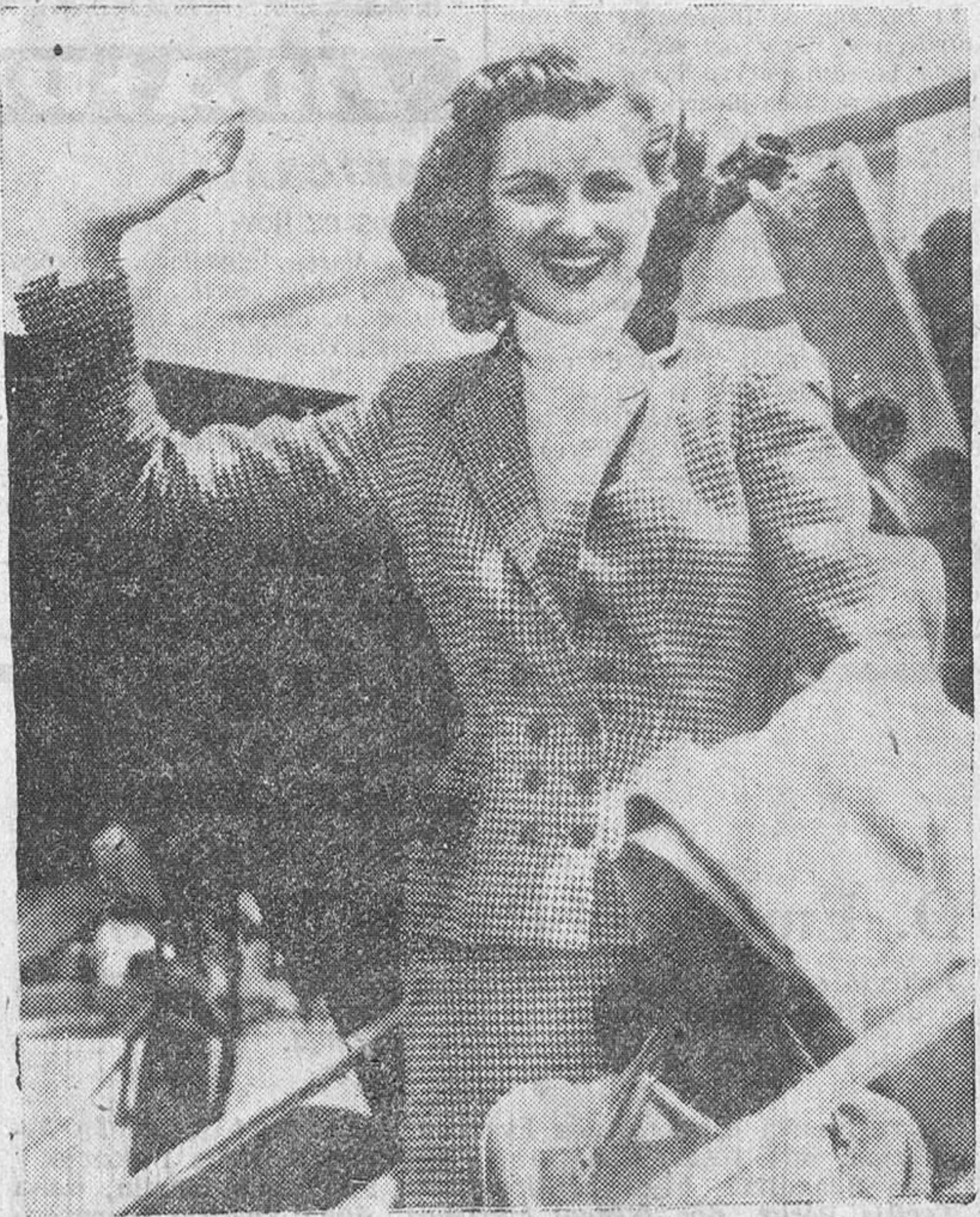
Esta es Cristina Martel, la francesita proclamada "Mis Universo", que con el título de la mujer más bonita del Mundo ha ganado un contrato cinematográfico a largo plazo con la productora "Universal Internacional", un automóvil, 5.200 dólares y un reloj de pulsera, con brillantes, valorado en 2.500 dólares. Cristina trabajaba como modelo en una casa de modas de París.