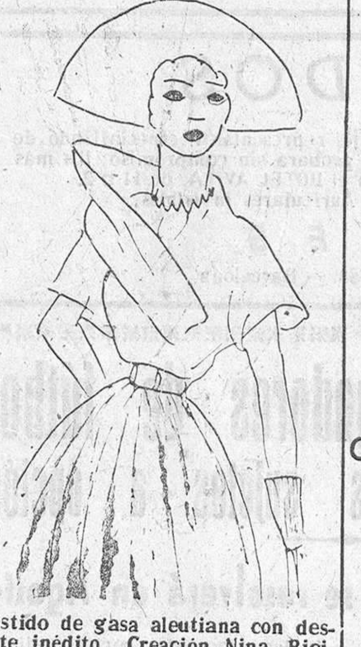
Vestido de gasa aleutiana con detalle inédito. Creación Nina Ricci. Diseño de José Zamora.

CINE GORDON MAÑANA JUEVES GRAN ESTRENO CORONACION en tecnicolor