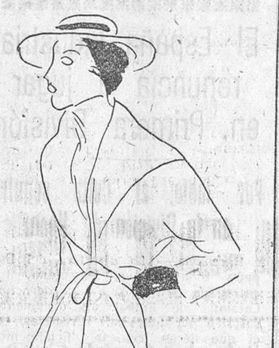
Vestido sastré de tweed de algodón. Creación Maggy Rouff. Corquis inédito de José de Zamora