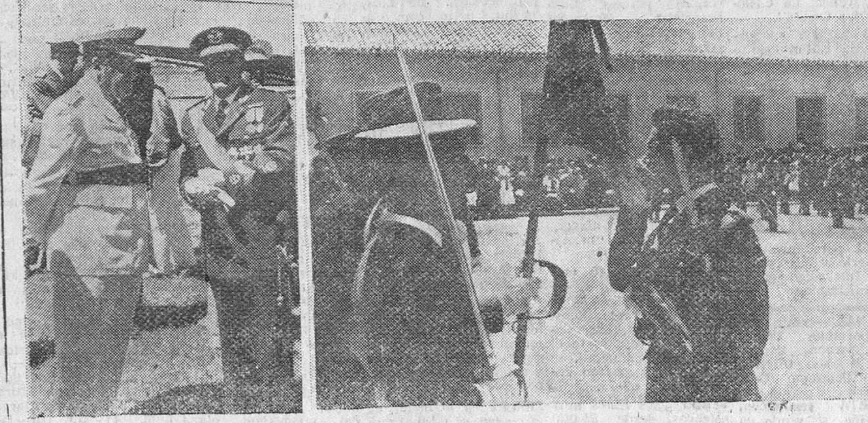
(Información en tercera página)