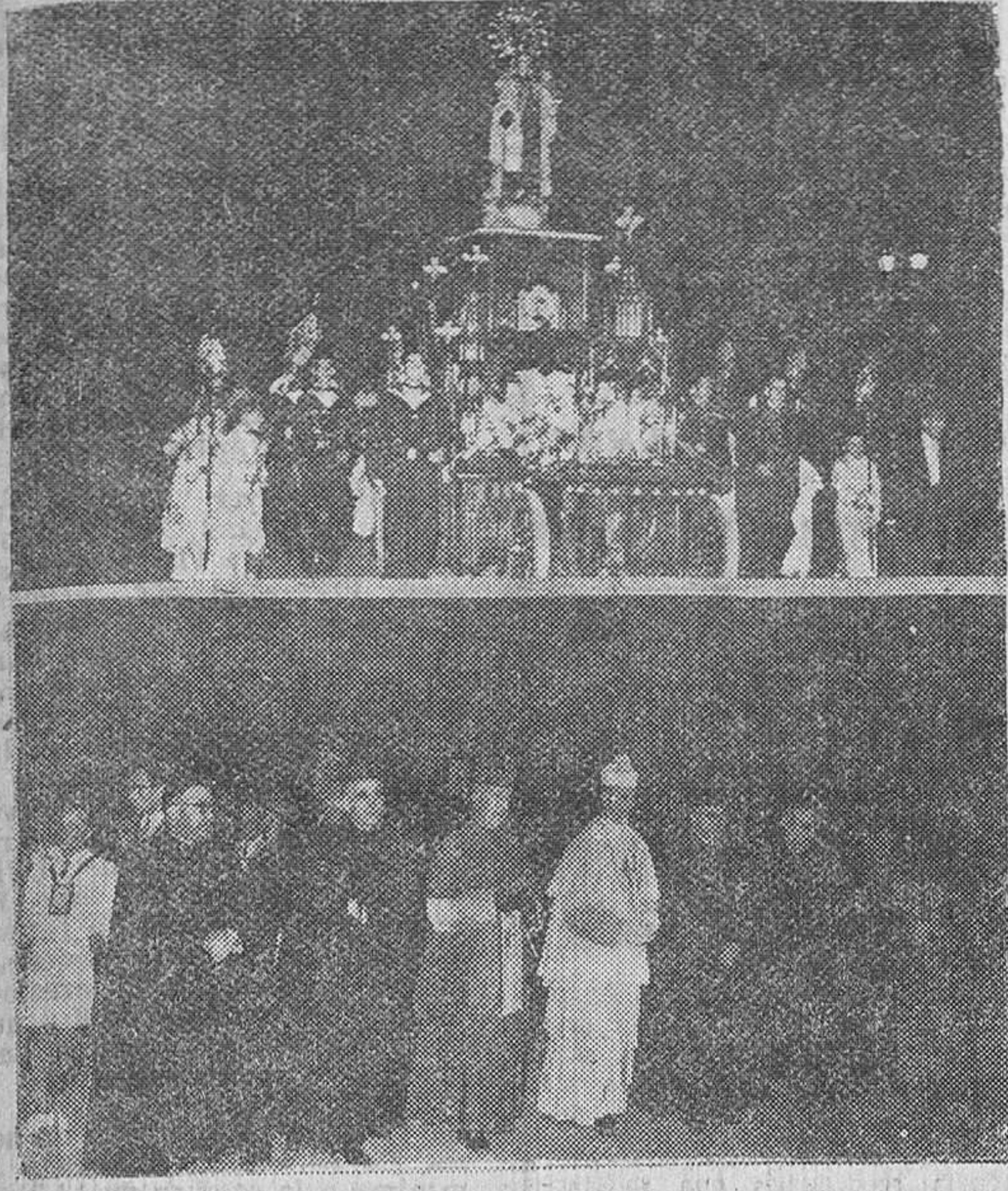
Como brillantísimo colofón de los solemnes actos celebrados ayer en Burgos con motivo de la festividad de Nuestra Señora del Carmen recorrió las calles abarrotadas de fervoroso gentío, la tradicional procesión con la Virgen del Carmelo. En nuestras fotos aparece en primer término la carroza con la excelsa Madre del Redentor y, en el segundo grabado, el excelentísimo señor Arzobispo de la diócesis, con el abad mitrado de San Pedro de Cardena, en la presidencia del cortejo.