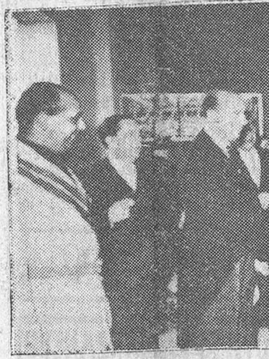
Valencia.—El ministro de Comercio señor Arburúa, durante su visita al pabellón norteamericano, instalado en el recinto de la Feria de Muestras, saluda al cónsul de dicho país.