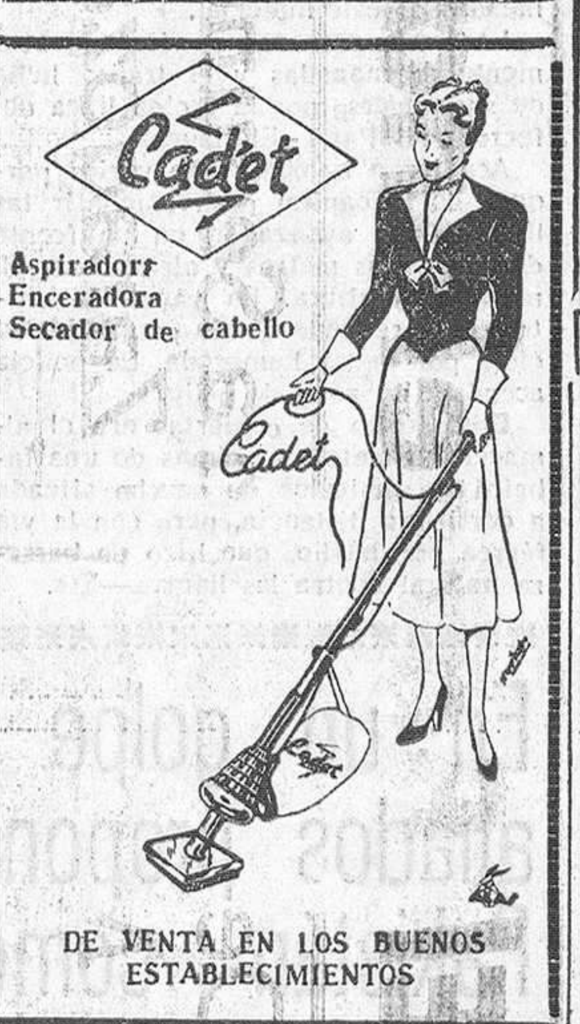
DE VENTA EN LOS BUENOS ESTABLECIMIENTOS

podemos comprender lo mucho que ha conseguido y que pretende Modesto Ciruelos tan auténticamente preocupado y tan notablemente enamorado de la verdad.