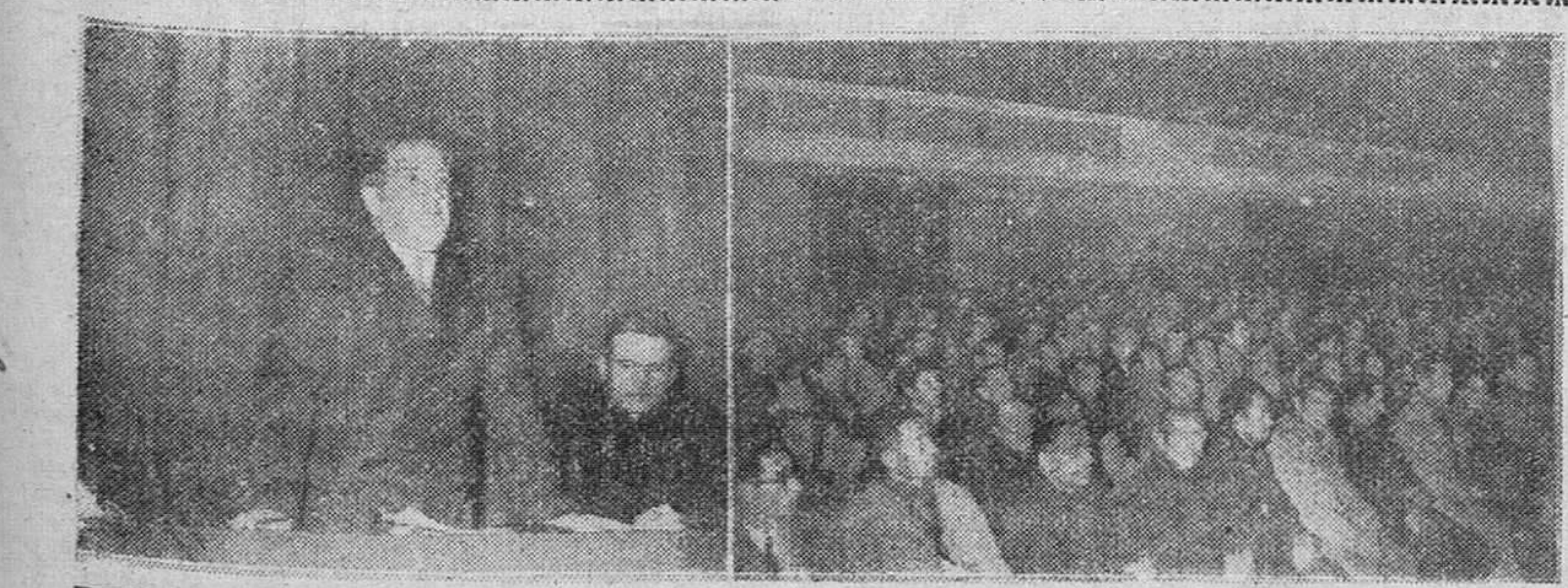
El capitán general habla a los obreros del C. C. O. A la izquierda, el teniente general Alcubilla, dirigiendo la palabra a los obreros del Círculo Católico, en el acto celebrado ayer tarde en el salón-teatro de dicha entidad. A la derecha, un aspecto del salón, totalmente lleno por los socios del Círculo.

Palencia.—En cerca de cuatrocientos millones de pesetas cifran los técnicos las pérdidas que experimentará el campo palentino si persiste la actual sequía que amenaza a los cultivos en las tierras. La impresión de los técnicos y de los labradores es que, si de aquí a fin de mes no llueve en las tierras palentinas, todo lo que se retrasan las precipitaciones repercutirá en los cultivos. En las labores de barbechar que ce realizan, la tierra sale como "tabaco" y en un punto de treinta centímetros, resbala el arado como sobre una losa. De todas formas, habrá poca paja. Si lloviera aun en esta misma semana, podría esperarse una buena siega.—Cifra