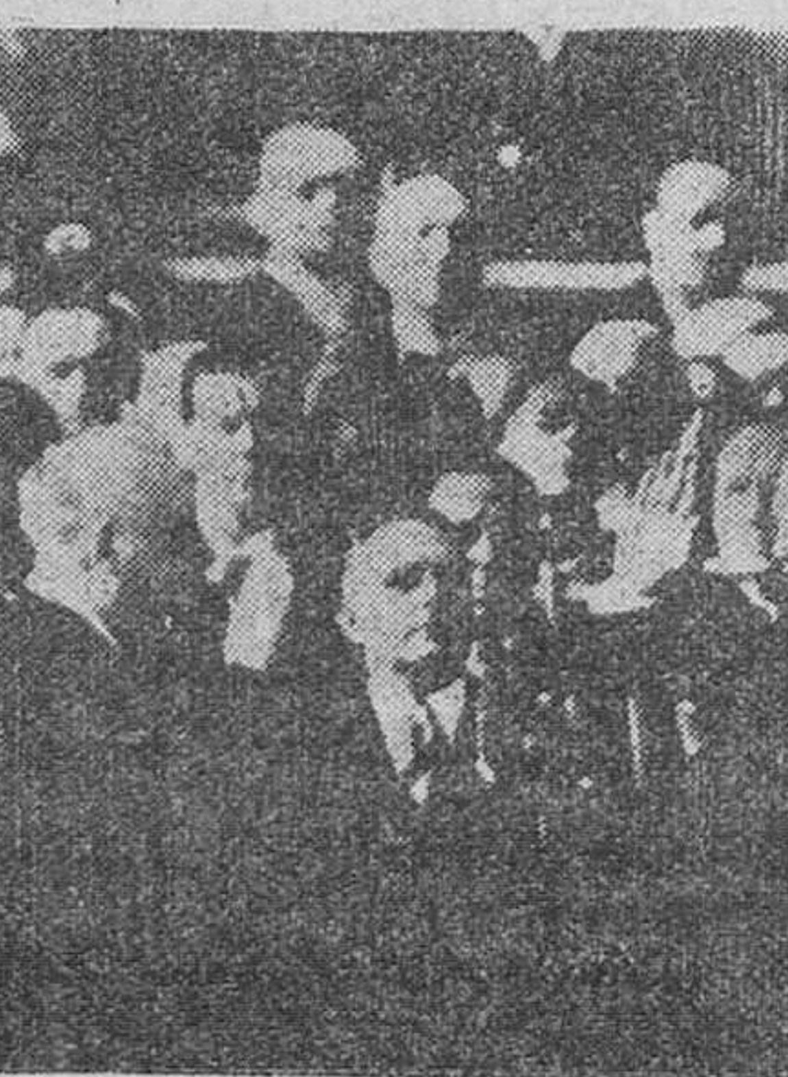
EISENHOWER JURA SU CARGO Washington.—He aquí la primera fotografía de la jura como presidente de los Estados Unidos del general Eisenhower. En los extremos izquierdo y derecho, aparecen el presidente saliente Mr. Truman y el nuevo vicepresidente, Richard Nixon.