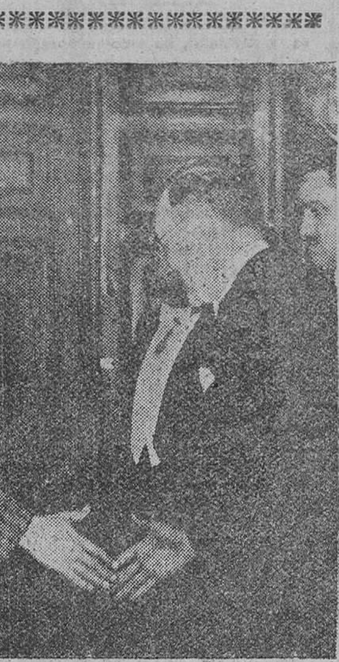
PRESENTACION DE CREDENCIALES Madrid.— Su Excelencia el jefe del Estado, Generalísimo Franco, estrecha la mano del personal de la representación diplomática del Uruguay, con motivo de la presentación de credenciales del nuevo ministro de dicho país en España.

Truman y Stevenson piden a los demócratas que apoyen a Eisenhower en las decisiones que persigan el bien del país