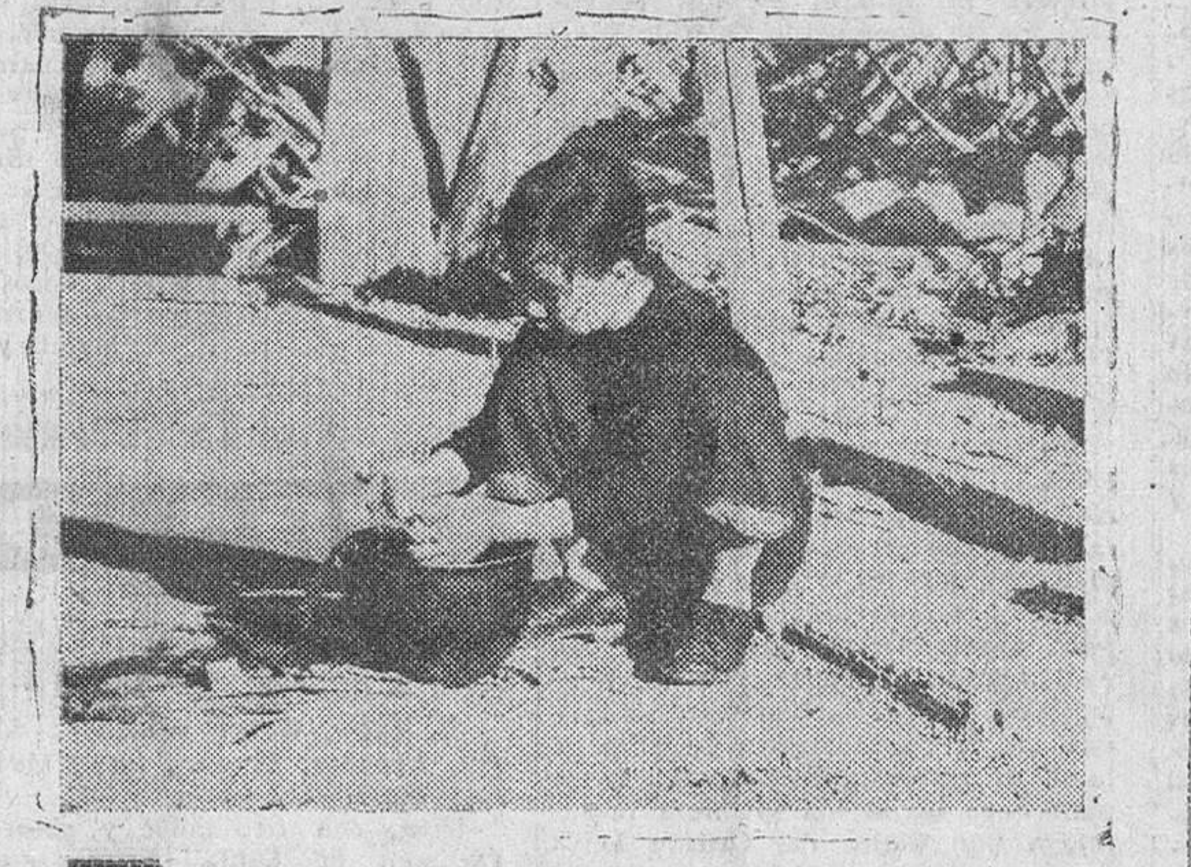
A unos kilómetros de la línea de fuego y en plenas ruinas de Seul, la martirizada capital de Corea, esta niña ha improvisado una palangana, en el caso de un soldado norteamericano, para lavar su muñeca.