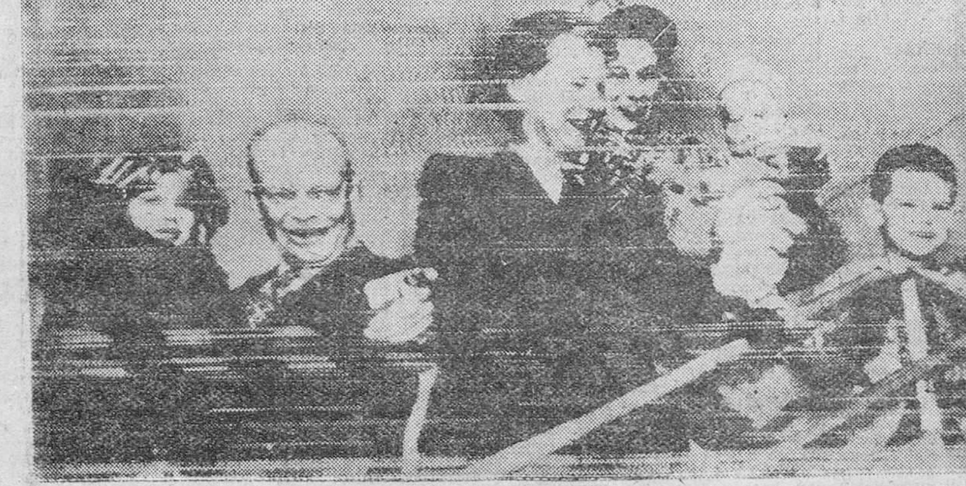
Después de la victoria de "Ike" Nueva York.—Eisenhower, con su esposa y su hija política, y nietos, se dispone a partir en avión hacia Augusta, para descansar diez días, después de su brillante victoria electoral.