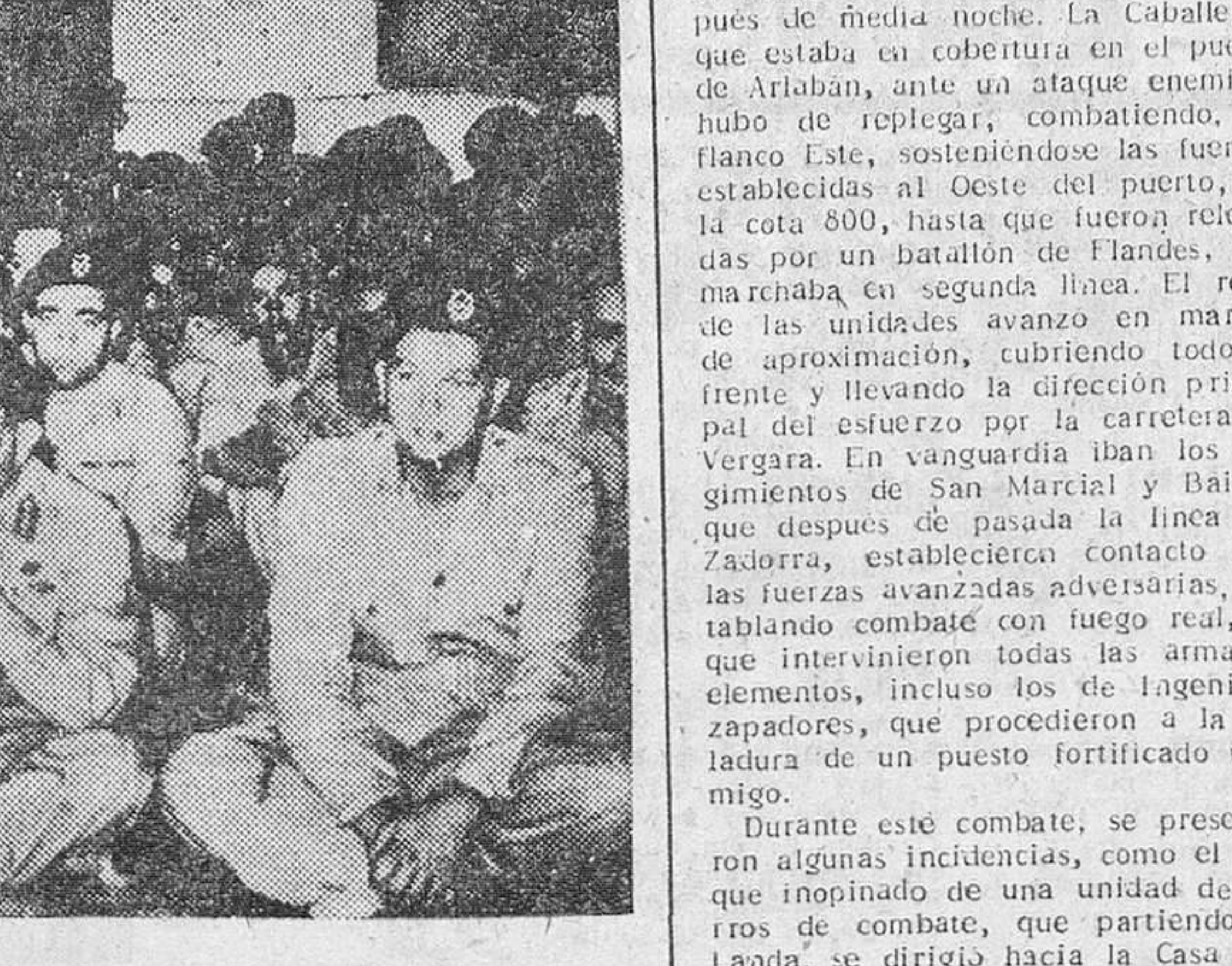
El general Naguib, jefe del Gobierno egipcio, mientras se desarrollaban en Egipto los acontecimientos por todos conocidos, el general Naguib, ferviente musulmán, no ha faltado a sus deberes religiosos en la Mezquita del Cuartel General de Alejandría donde ha instalado su Cuartel General. El general Naguib aparece en el centro, rodeado de sus oficiales, todos descalzos durante una ceremonia religiosa.

Durante este combate, se presentaron algunas incidencias, como el ataque inopinado de una unidad de carros de combate, que partiendo de Landau, se dirigió hacia la Casa Jardín, teniendo que ser rechazada por elementos del batallón contra carros. La Artillería de los tres Regimientos, 25, 46 y 63, batió al enemigo, teniendo necesidad la del 63 de efectuar un tiro de contra batería, contra piezas situadas en la vertiente Norte del monte Isoaitza, que estaban ocultas a la observación terrestre, por lo que hubo de corregirse el tiro con el auxilio de aviones pro-