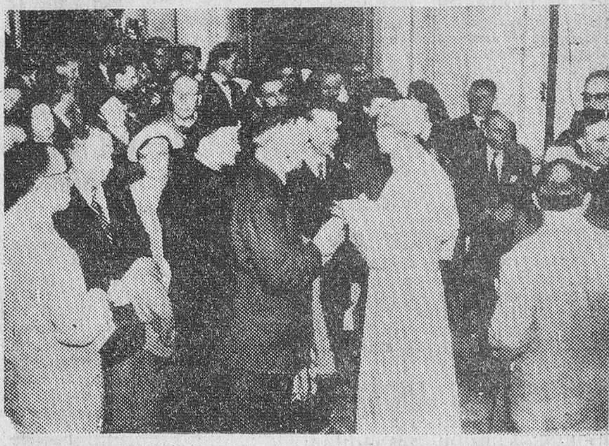
LOS ASTRONOMOS DEL MUNDO, EXCEPTO LOS RUSOS, JUNTO AL PAPA Castelgandolfo. — El Santo Padre conversa con un grupo de astrónomos durante la audiencia concedida a los 650 participantes en la VIII Asamblea General de la Unión Astronómica Internacional. Los representantes de la U. R. S. S. no asistieron a dicha audiencia.

Teherán.—En el curso de luchas sostenidas por tribus rivales en la región central del Irán, han resultado, por lo menos, veinte personas muertas y siete gravemente heridas, según informan esta tarde los periódicos de la capital persa. Por otra parte el órgano del frente nacional dice que un choque registrado cerca de Kermenshah, ha habido un número de muertos que no ha sido revelado. Se indica que por estas fechas, unas cuatrocientas mil personas emigran a las regiones del Sur desde sus residencias en las zonas fronterizas con Turquía y el Irán, en busca de pascos para los ganados.