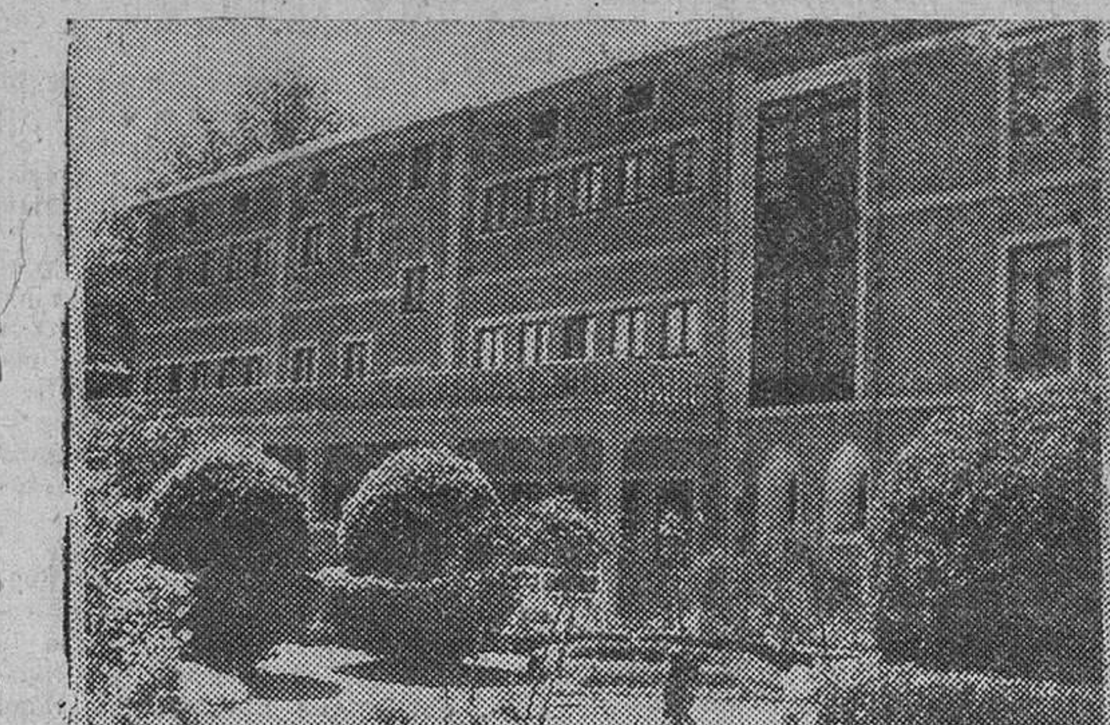
NUEVO PABELLON DEL ASILO DE LAS MERCEDES Perspectiva del nuevo pabellón bendecido e inaugurado ayer en el Asilo de Nuestra Señora de las Mercedes, de nuestra ciudad.

Actualmente se está procediendo en Villarreal a la reconstrucción de la Iglesia y donde se celebrará el último acto oficial del Congreso Eucarístico Internacional de Barcelona.—Cifra.