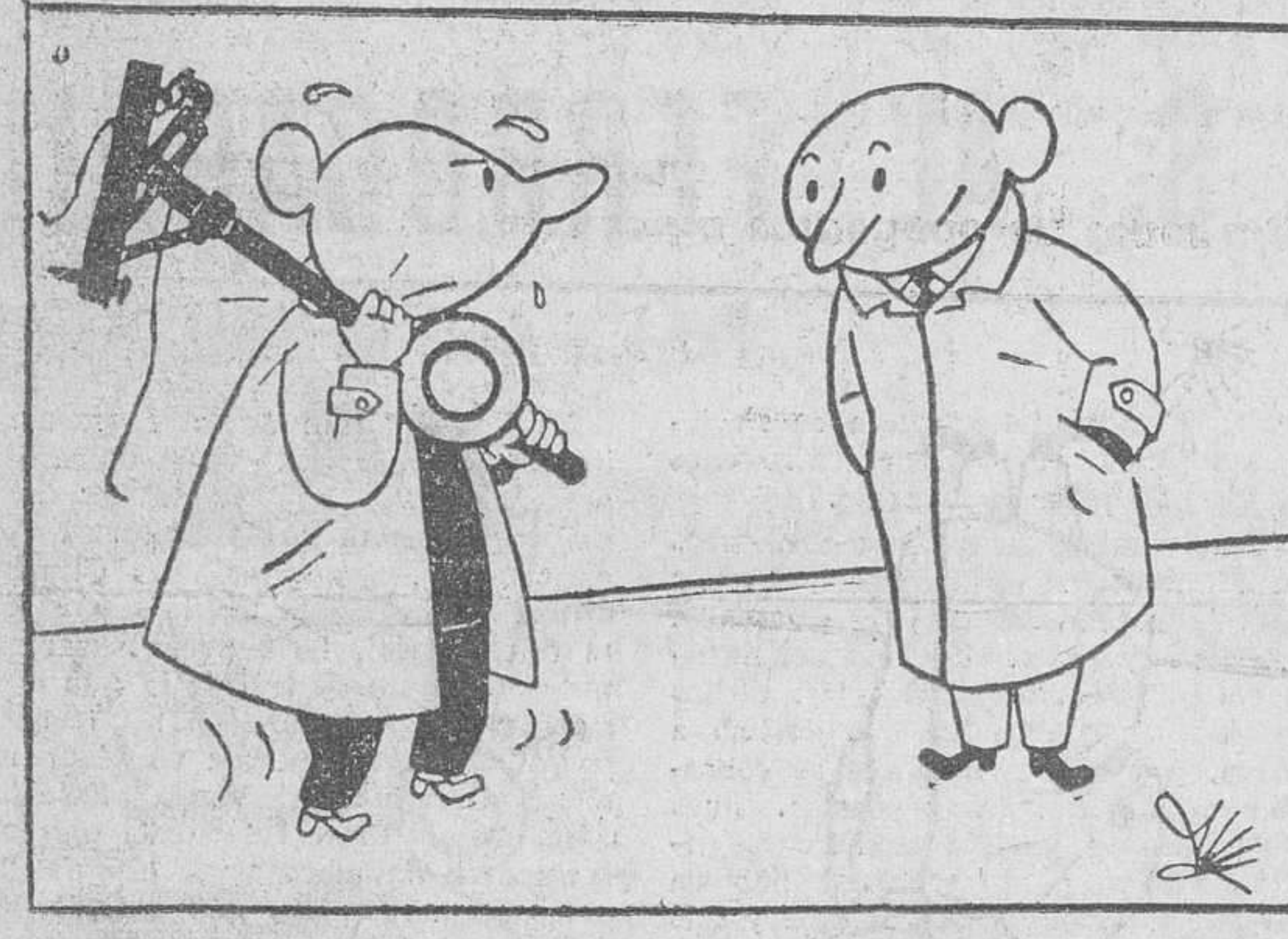
—Es que mi mujer se ha empeñado en tener algo para comienzo de estación...