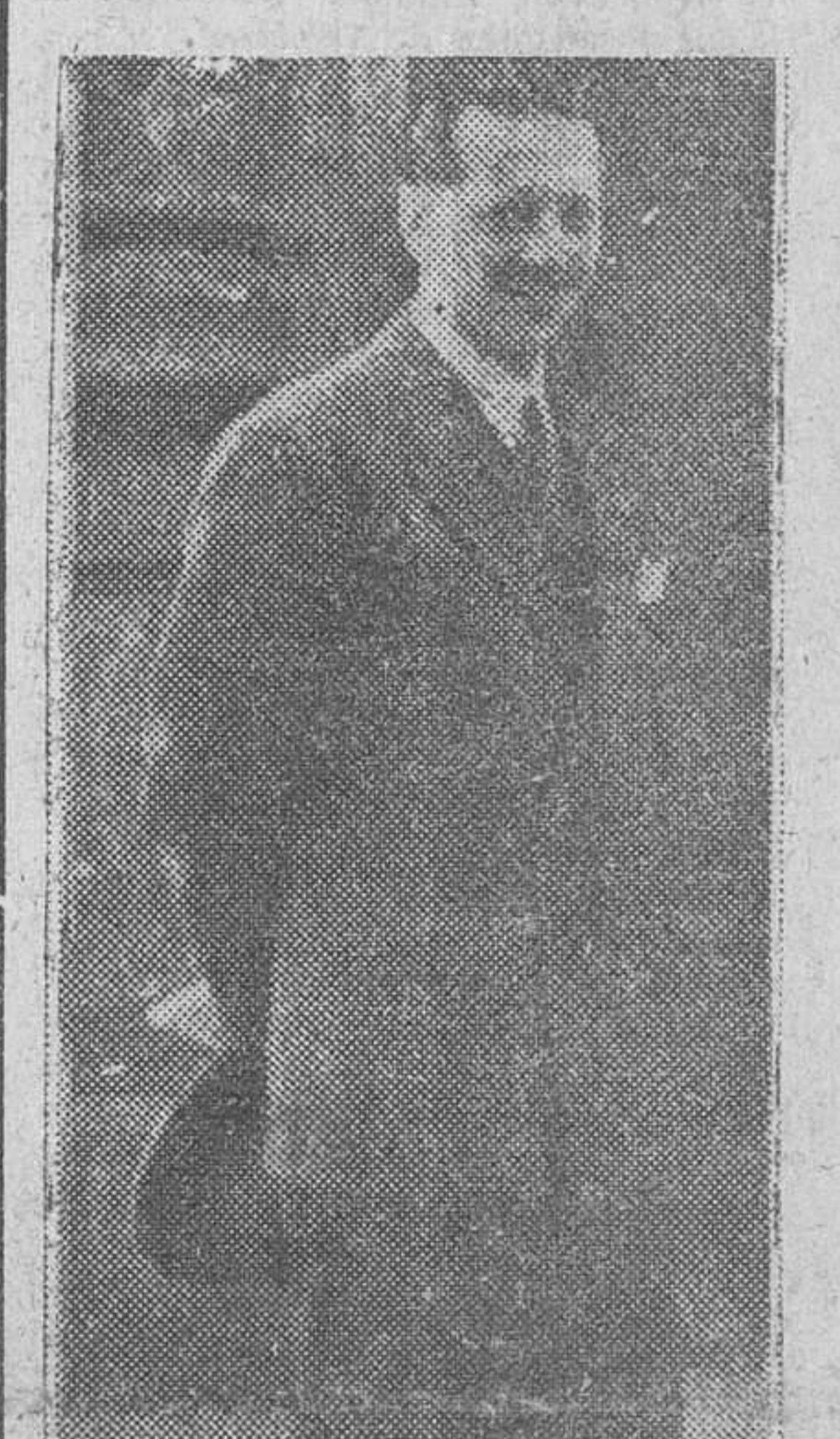
Bilbao.— En esta semana se reunirán en París los Comités directivos de la Federación Internacional de Periodistas Católicos y de directores de periódicos católicos. Estas reuniones revisten especial importancia, porque en ellas se va a decidir la orientación del Secretariado Permanente Internacional de la Prensa Católica, cuya creación se acordó en el Congreso de Roma. A continuación, tendrán lugar en Friburgo (Suiza) las Conferencias de presidentes de Organizaciones Católicas Internacionales.