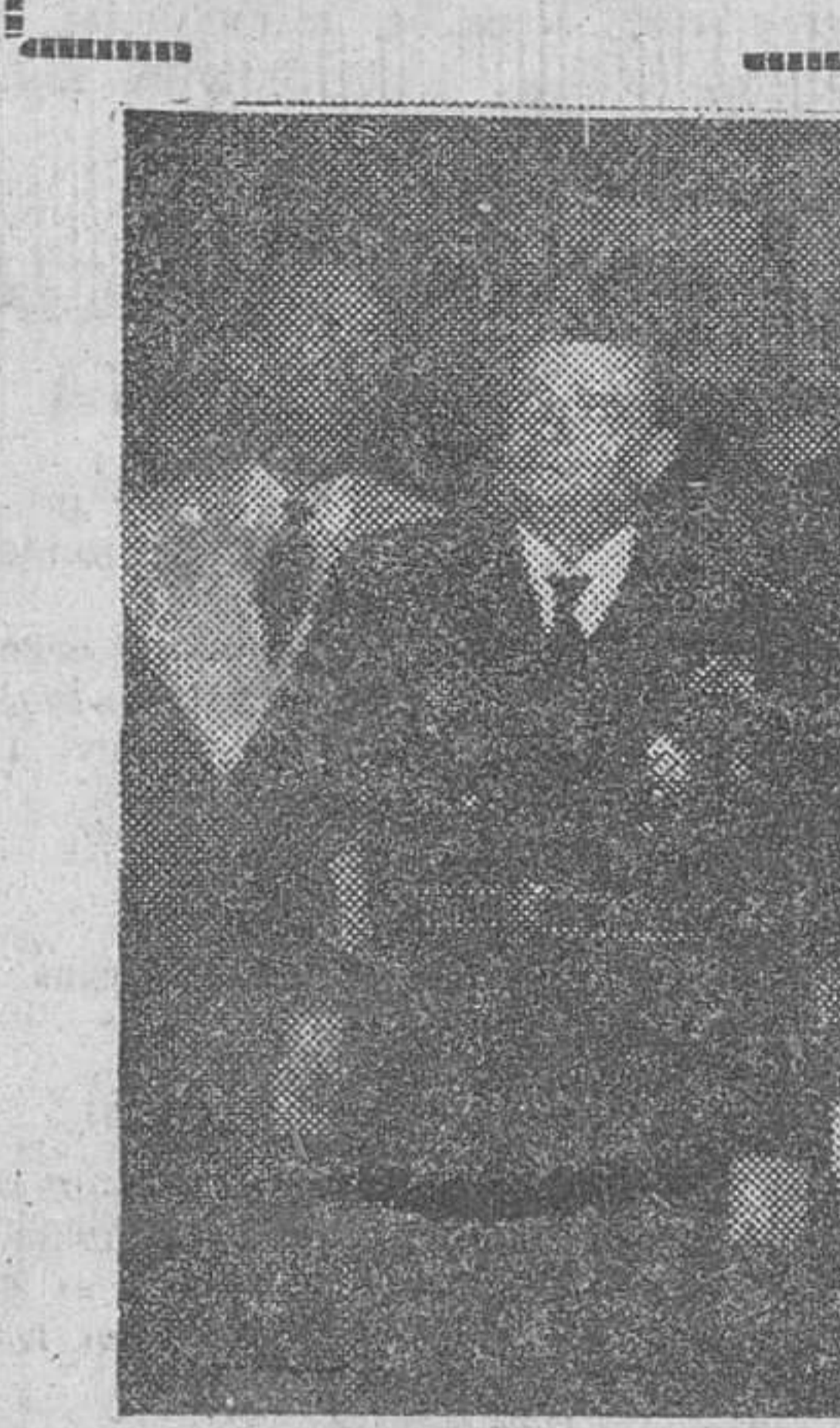
El jefe del Estado, Generalísimo Franco, acompañado de los ministros de su Gobierno y otras altas personalidades durante la visita efectuada a la exposición permanente de las actividades desarrolladas por el Instituto Nacional de Industria.