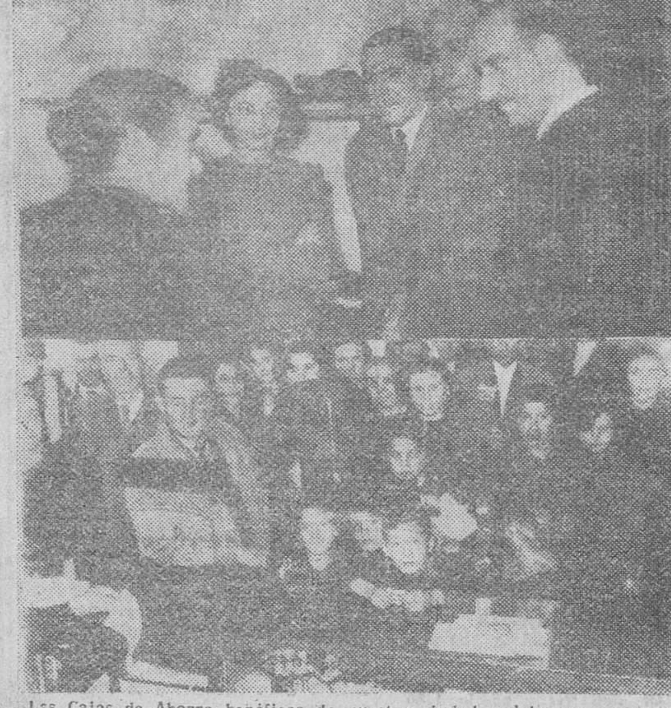
Las Cajas de Ahorro benéficas de nuestra ciudad, celebraron ayer con distintos actos —cuyas reseñas dejamos para la próxima edición, a causa de la abundancia de originales— para conmemorar el "Día Universal del Ahorro". En nuestro grabado de la izquierda, los consejeros y el director gerente de la Caja de Ahorros municipal visitando a los beneficiarios de las 28 viviendas recientemente inauguradas en el barrio de San Esteban. A la derecha, la extraordinaria afluencia de imponentes en aquellos Centros de ahorro, reflejado en el grabado de la derecha y correspondiente a la Caja del Circulo Católico de Obreros.