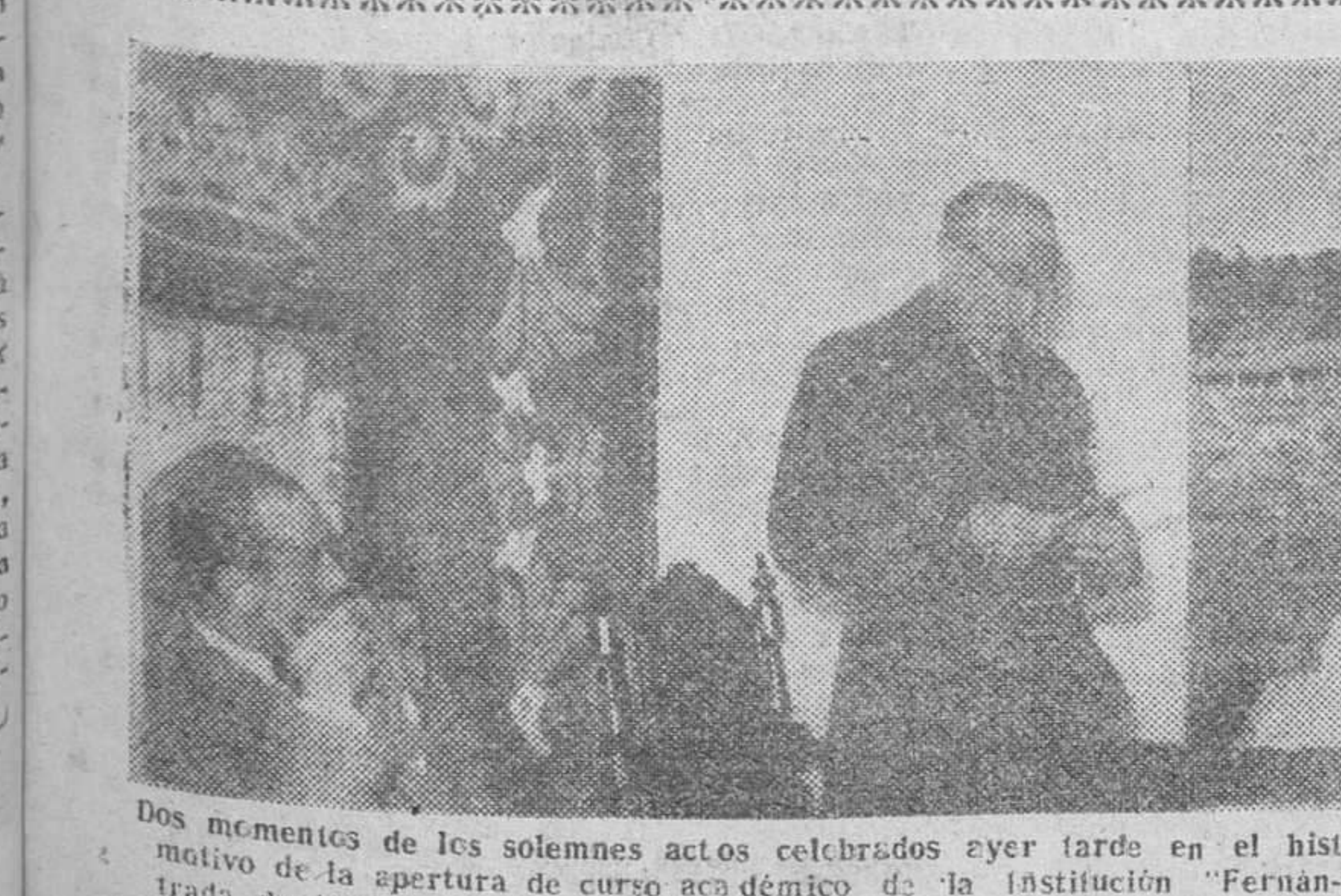
Los momentos de los solemnes actos celebrados ayer tarde en el histórico Monasterio de Cardena, con motivo de la apertura de curso académico de la Institución "Fernán González". El hito inaugurado a la entrada de la Abadía y el señor duque de Alba durante su discurso en la sesión académica.

Madrid. — Con ocasión de la Fiesta Nacional turca, Su Excelencia el Jefe del Estado ha enviado un telegrama de felicitación al presidente de la República de Turquía. Su Excelencia Celal Bayar ha respondido, a su vez, con el siguiente despacho: "Muy agradecido a la amable felicitación que Vuestra Excelencia ha tenido a bien dirigirme con motivo de la Fiesta Nacional turca, ruego reciba, con mi reconocimiento, los votos más sinceros por su felicidad personal y la prosperidad del noble pueblo español". — Cifra.