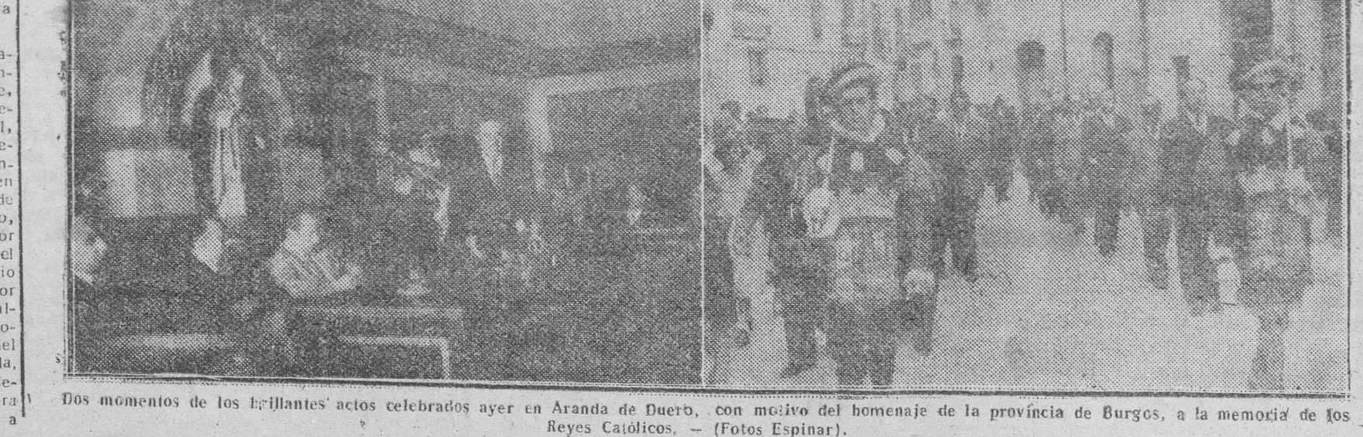
Dos momentos de los brillantes actos celebrados ayer en Aranda de Duero, con motivo del homenaje de la provincia de Burgos, a la memoria de los Reyes Católicos.