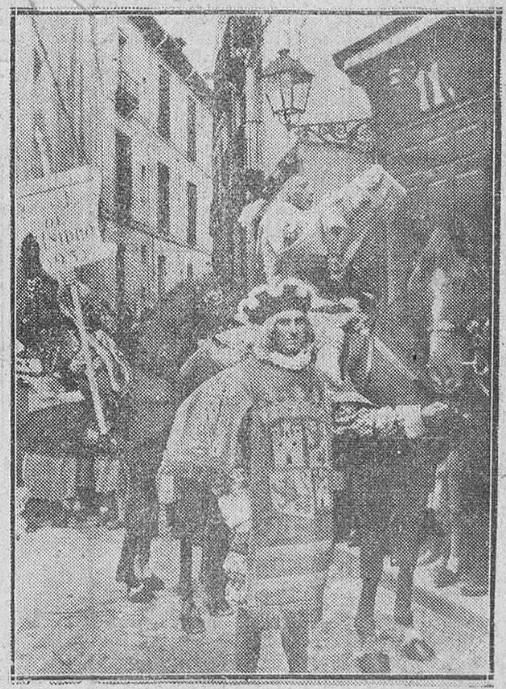
Una cabalgata típica recorre las calles de Madrid antiguo pregando las próximas fiestas de San Isidro.