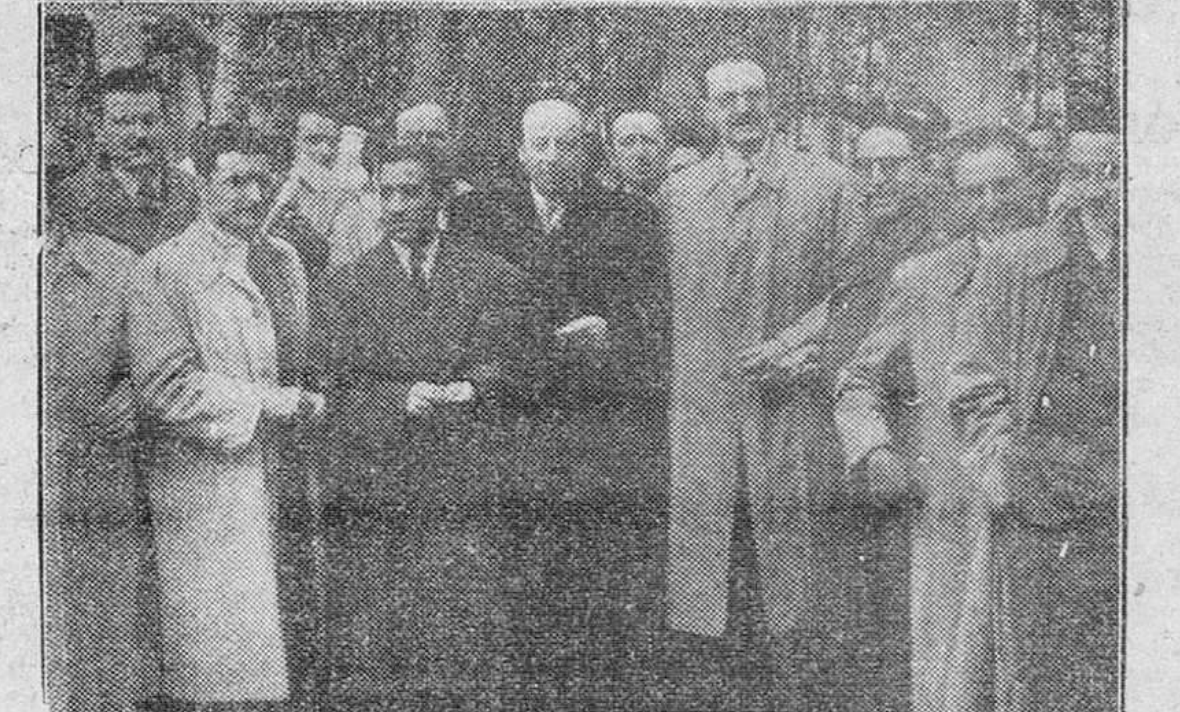
Grupo obtenido por "Fede", a la salida de la fiesta religiosa celebrada el domingo por el Sindicato de Papel, Prensa y Artes Gráficas en la conmemoración de la fiesta de su Patrono, San Juan Ante Portuñanam.