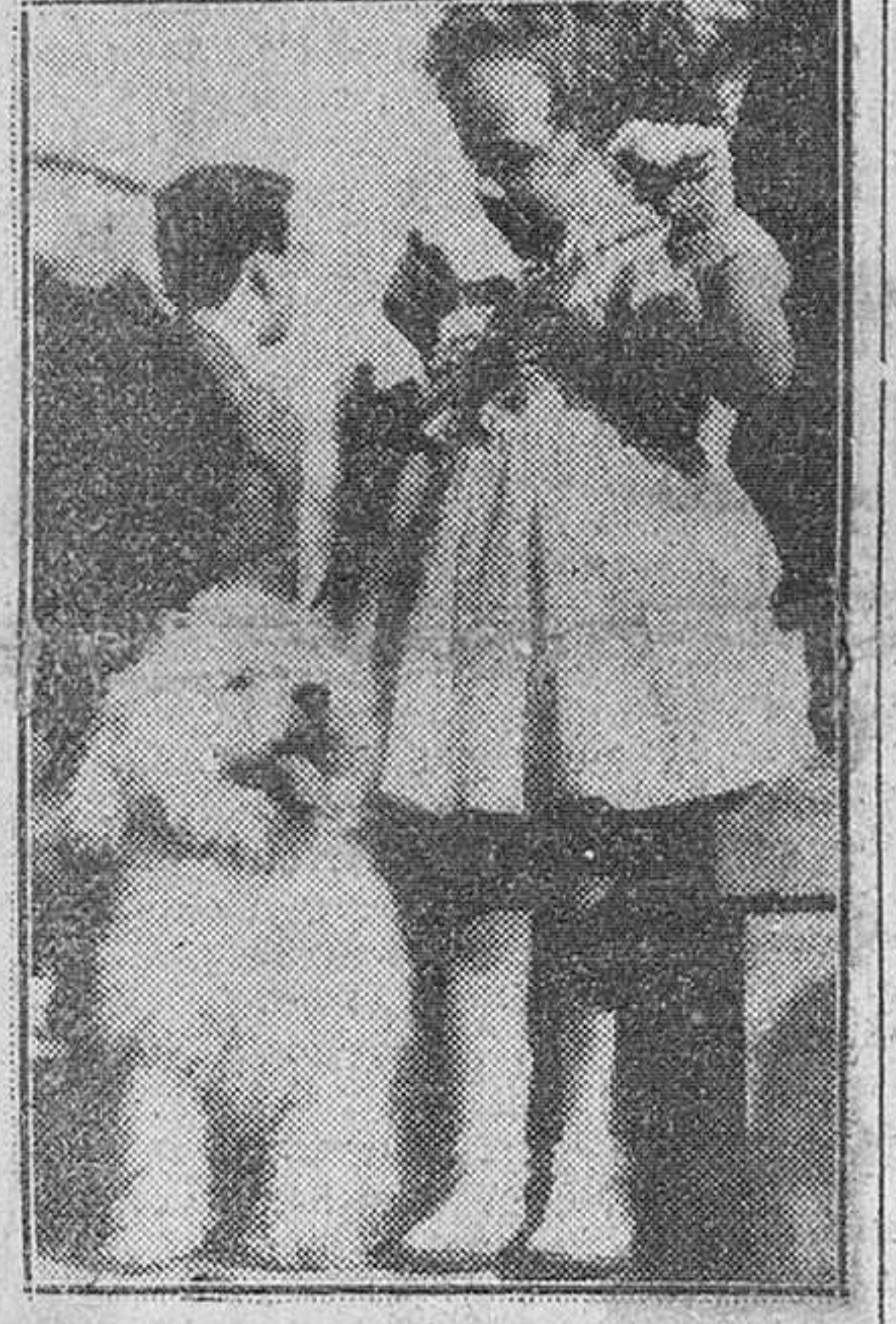
La gran gala de "La Belle y la Bestia" esto es, de la bella y la bestia, se ha celebrado en el Pabellón Dauphine de París, a beneficio de la infancia desvalida. Concurrieron cuarenta señoras acompañadas de animales de todas clases. He aquí la más joven de todas ellas que parece asustarse de su acompañante al presentarle ante el jurado.