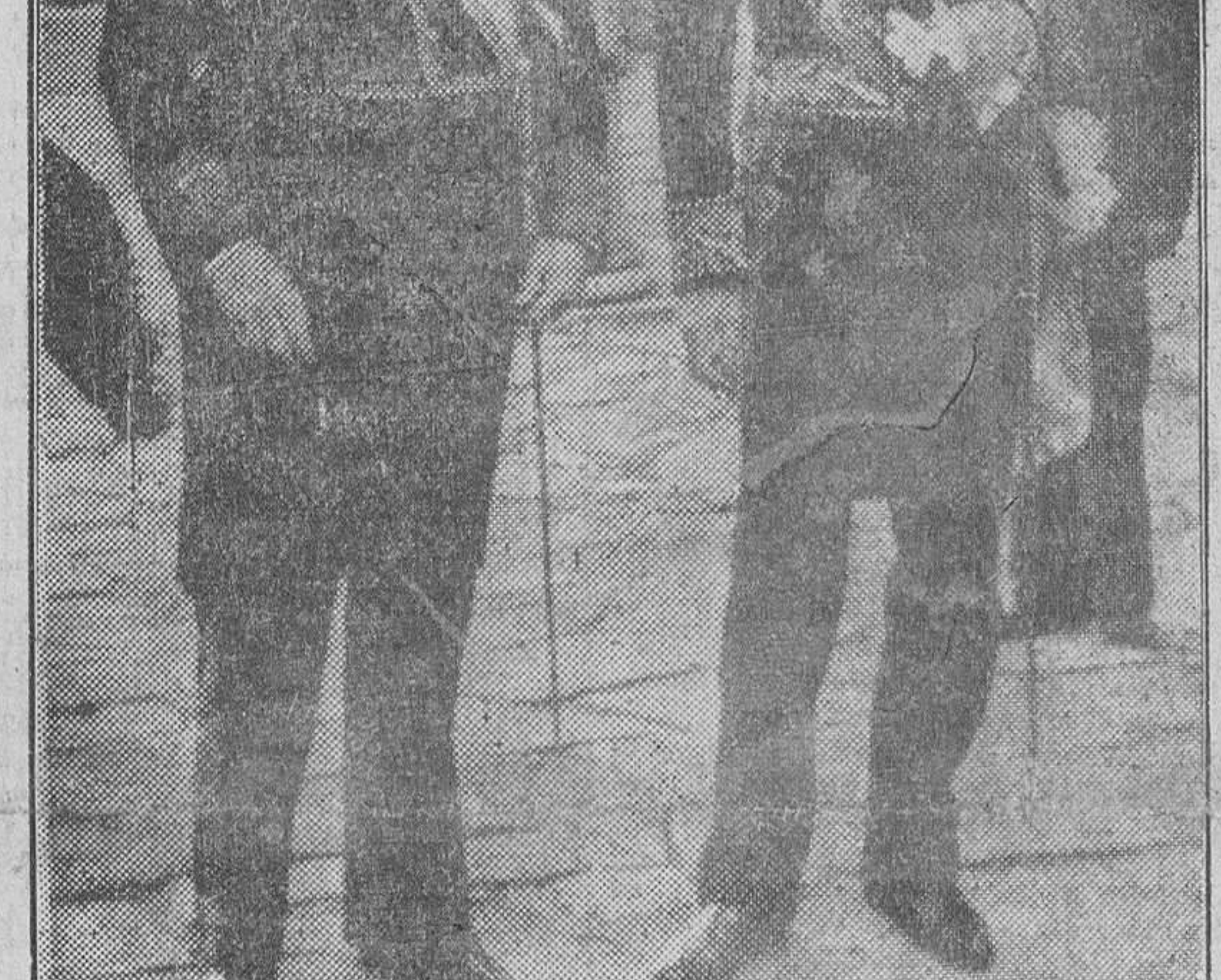
MADRID. — SIR JOHN BALFOUR PRESENTO EL MIÉRCOLES ULTIMO SUS CREDENCIALES COMO EMBAJADOR DE INGLATERRA ANTE S. E. EL JEFE DEL ESTADO ESPAÑOL. EN NUESTRAS FOTOGRAFIAS, DE FEDE Y GIL DEL ESPINAR, DOS MOMENTOS DE DICHA CEREMONIA: LA COMITIVA DIRIGIENDOSE AL PALACIO DE ORIENTE Y EL NUEVO EMBAJADOR EN EL MOMENTO DE SALIR DE SU RESIDENCIA CON TAL FIN