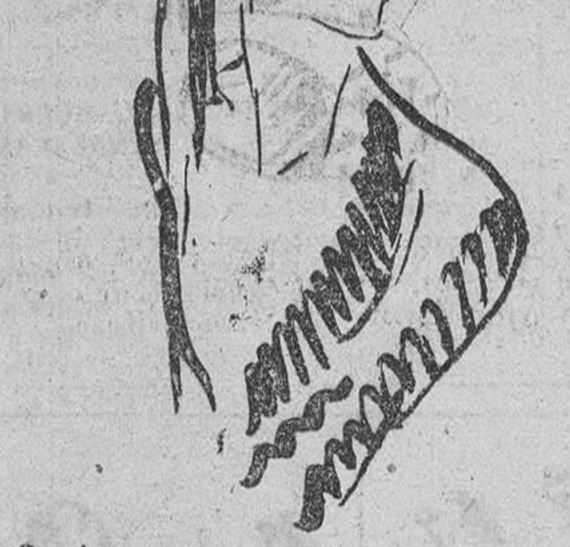
Sombrero de paja blanca, con copa drapada y flores de fular azul marino (Creación Teresa Peter)