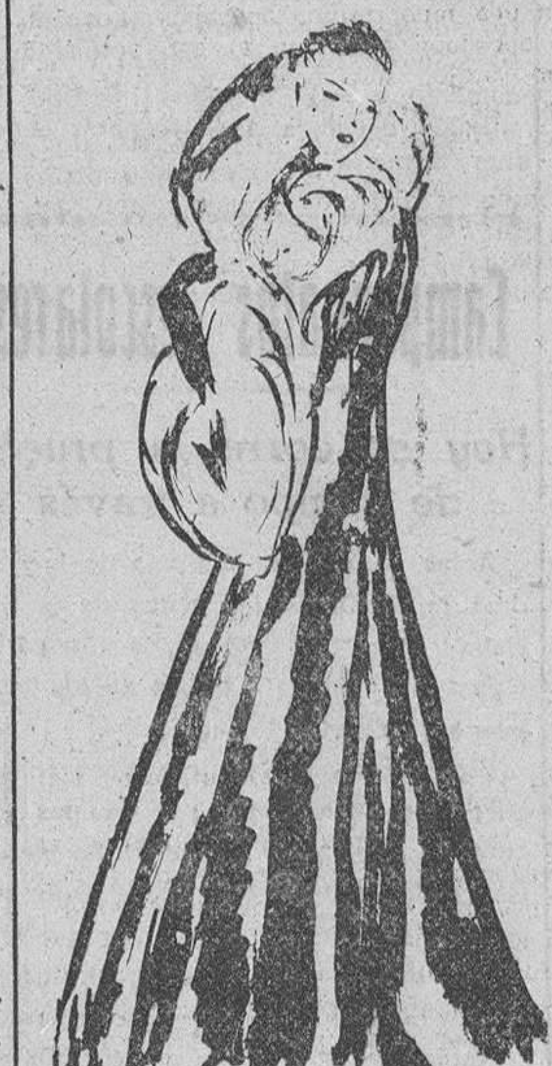
Abrigo de terciopelo violeta, con cuello y puños de zorro gris. (Creación Worth)