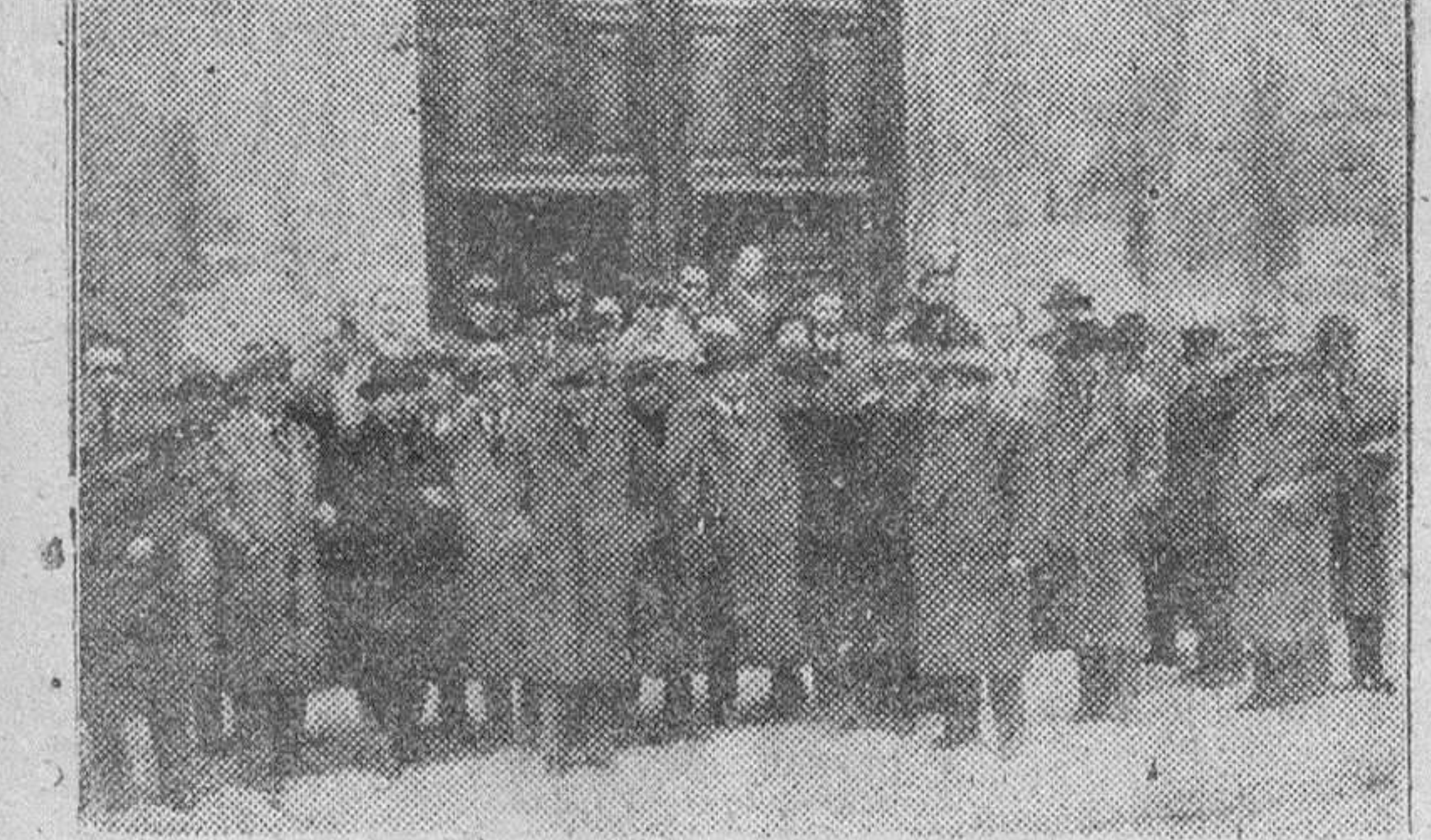
EN VALLADOLID SE REUNIERON ESTE AÑO LOS ODONTÓLOGOS DE AQUELLA CIUDAD HERMANA Y LOS DE PALENCIA, SALAMANCA Y BURGOS, PARA SOLEMNIZAR CON DIVERSOS ACTOS LA FESTIVIDAD DE SU PATRONA, SANTA APOLONIA. EN LA FOTO DE "FEDE" APARECEN EN PRIMER TERMINO LOS ODONTÓLOGOS BURGALÉSES, A LA SALIDA DEL ACTO RELIGIOSO CELEBRADO CON TAL MOTIVO.