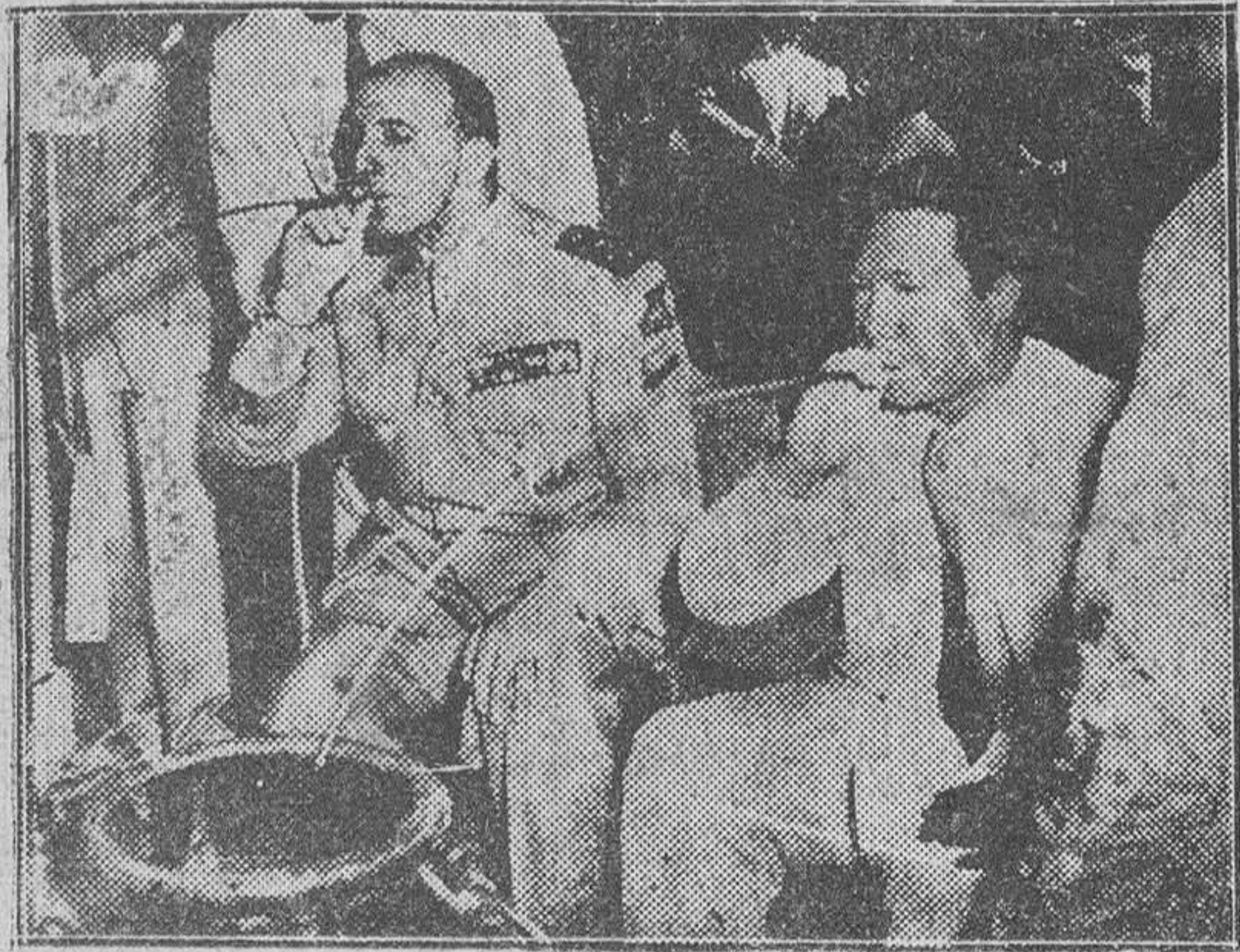
ES COSTUMBRE DE LOS JEFES MOIS, QUE TODOS LOS VISITANTES DE RENOMBRE BEBAN EL VINO DE LA AMISTAD EN UNA JARRA COMUN Y ASPIRANDO POR UN LARGO TUBO DE BAMBU. EL EMPERADOR BAO DAI Y EL ALTO COMISARIO FRANCÉS EN INDOCHINA, GENERAL DE LATTRE, APARECEN AQUI PRACTICANDO ESTE RITO, DURANTE SU VISITA A LAS REGIONES HABITADAS POR LOS MOIS

EL EMPERADOR BAO DAI Y EL GENERAL DE LATTRE, VISITAN A LOS MOIS