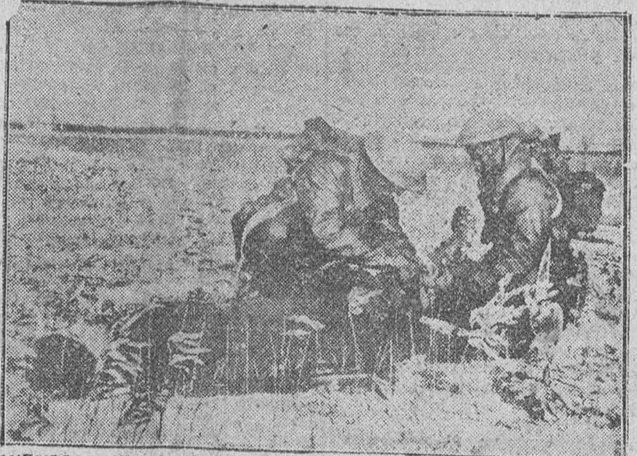
MIEMBROS DE LA AMBULANCIA SANITARIA INDIA QUE ACTUA EN COREA JUNTO A LAS TROPAS DE LAS NACIONES UNIDAS, RETIRANDO UN HERIDO DE LA LINEA DE FUEGO.