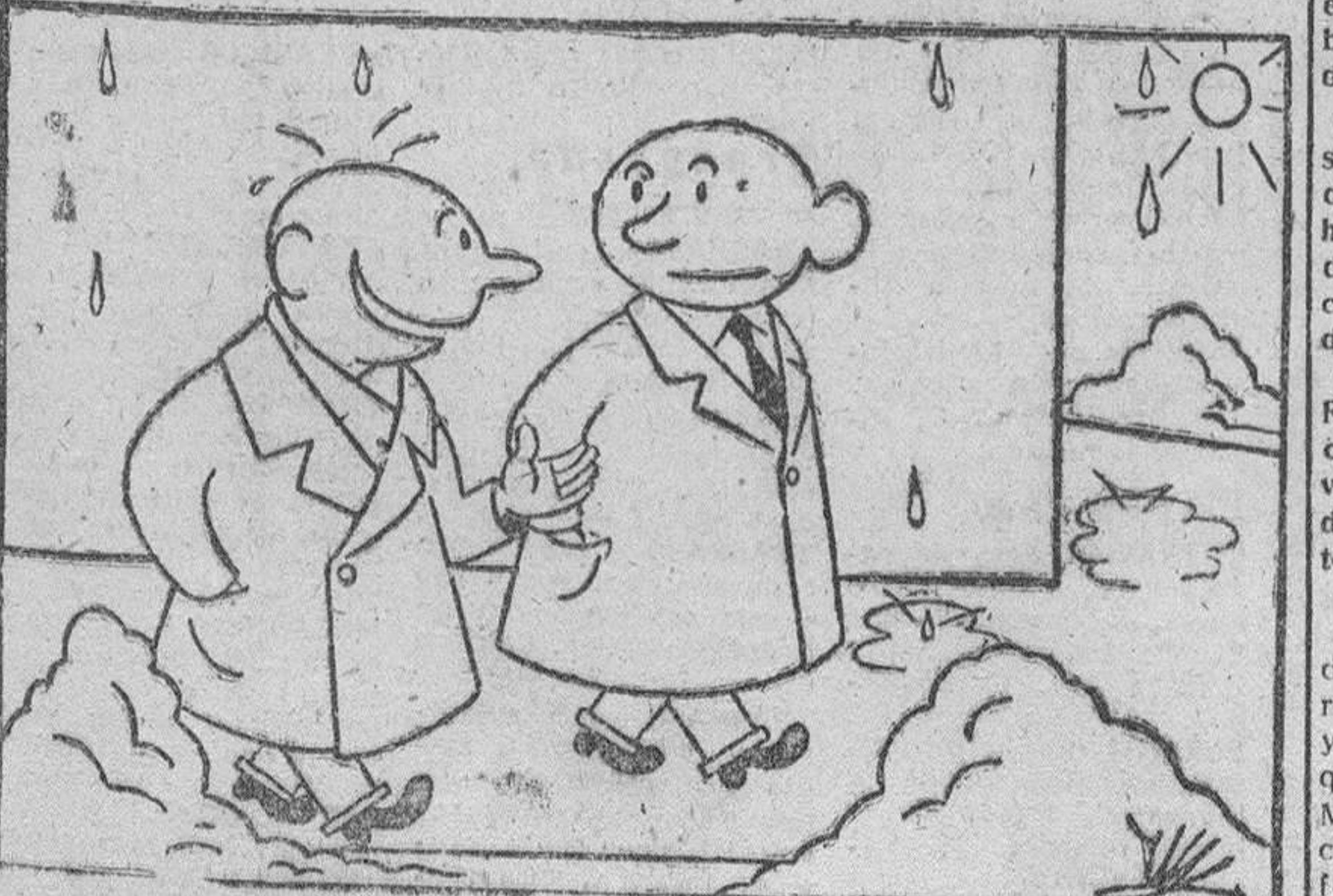
—Ha pasado una semana y todavía está la nieve en las calles ¡Es inconcebible! —Creo que se trata de un procedimiento original para almacenar agua..., por si vuelve la sequía