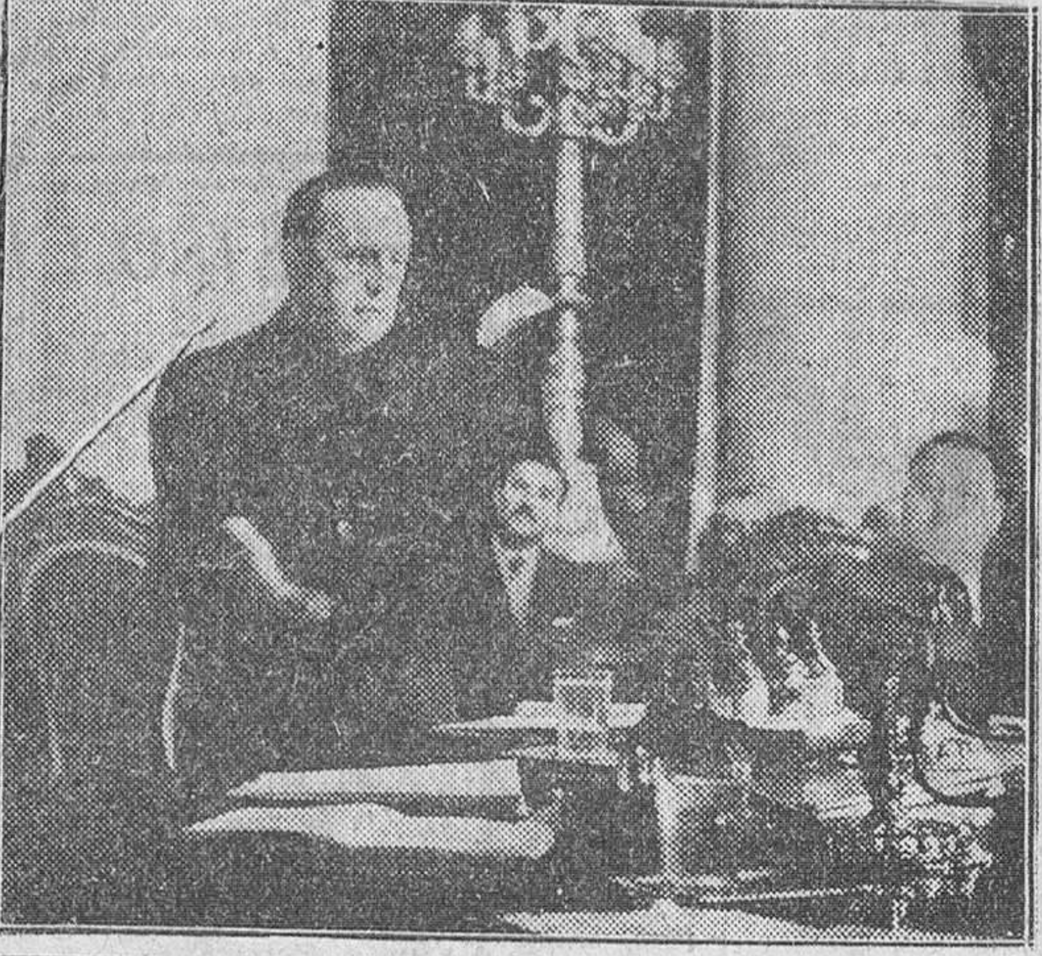
MADRID. — EL MINISTRO DE JUSTICIA Y SECRETARIO GENERAL DEL MOVIMIENTO, SEÑOR FERNÁNDEZ CUESTA, PRONUNCIANDO SU DISCURSO EN EL ACTO DE CLAUSURA DEL VII PLENO DEL CONSEJO ECONOMICO SINDICAL. — (Foto Gil del Espinar)

Bonn. — Adenauer ha recibido su primera información directa sobre los planes de las naciones del Pacto Atlántico de rearmar a los alemanes con cañones y posiblemente con carros de combate y aviones.