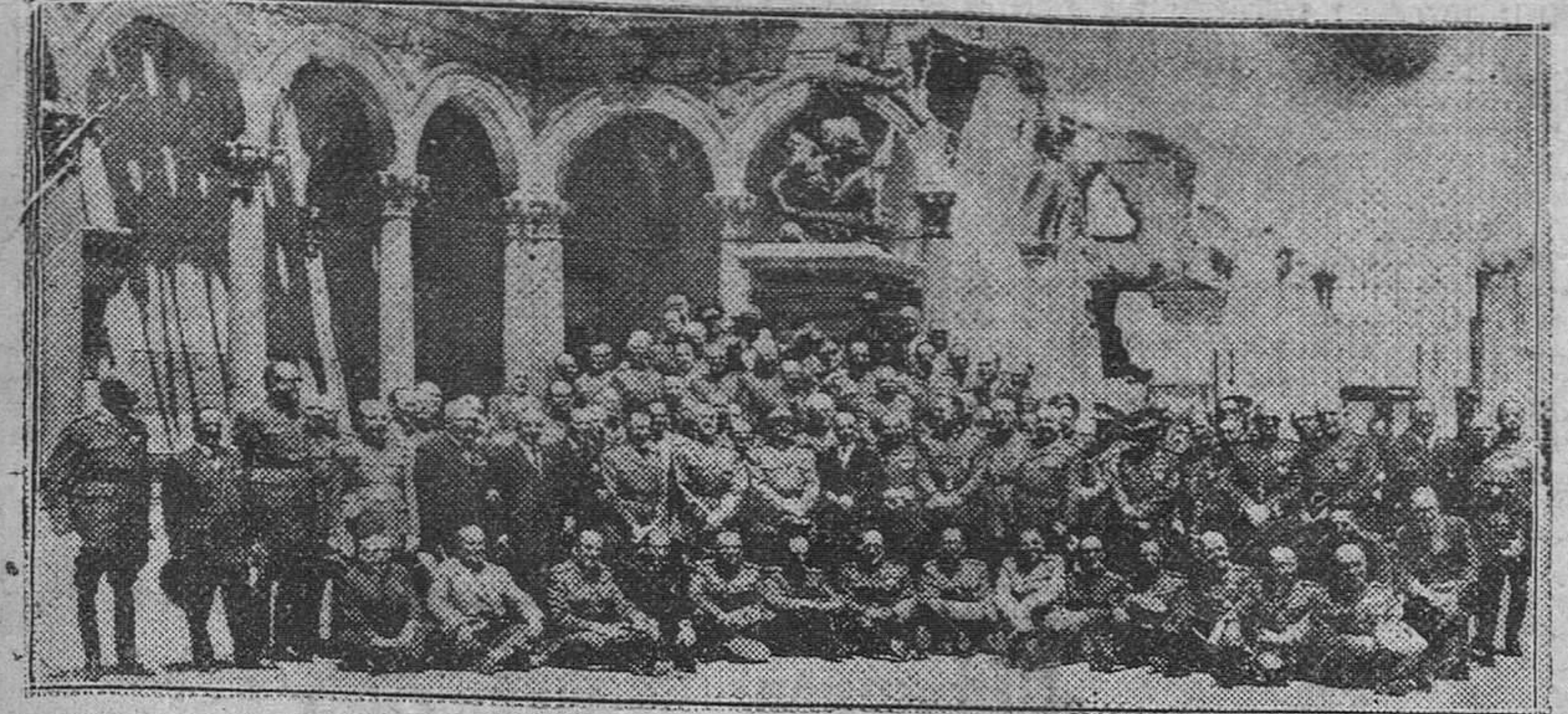
TOLEDO. — SU EXCELENCIA EL JEFE DEL ESTADO RODEADO DE SUS COMPANEROS DE PROMOCION EN EL PATIO DEL ALCAZAR TOLEDANO, DURANTE LA CELEBRACION DEL XL ANIVERSARIO DE LA FECHA EN QUE FUERON ENTREGADOS LOS DESPACHOS A LA XIV PROMOCION DE INFANTERIA.