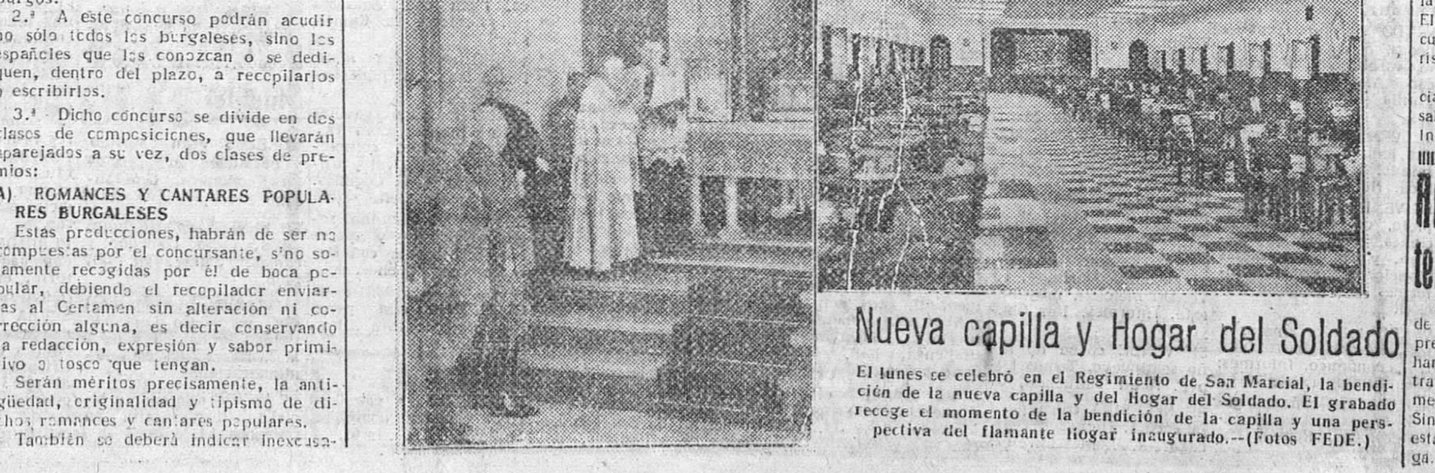
Nueva capilla y Hogar del Soldado. El lunes se celebró en el Regimiento de San Marcial, la bendición de la nueva capilla y del Hogar del Soldado. El grabado recoge el momento de la bendición de la capilla y una perspectiva del flamante hogar inaugurado.

También deberá contener la tradición, leyenda o costumbre, el punto de procedencia, o la comarca a la cual pertenecían. (Pasa a última página)